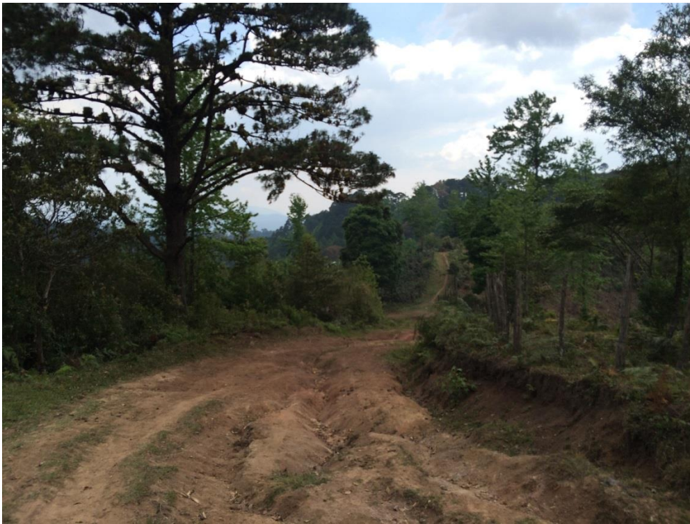
VISTA ACTUAL DEL TRAMO A REPARAR