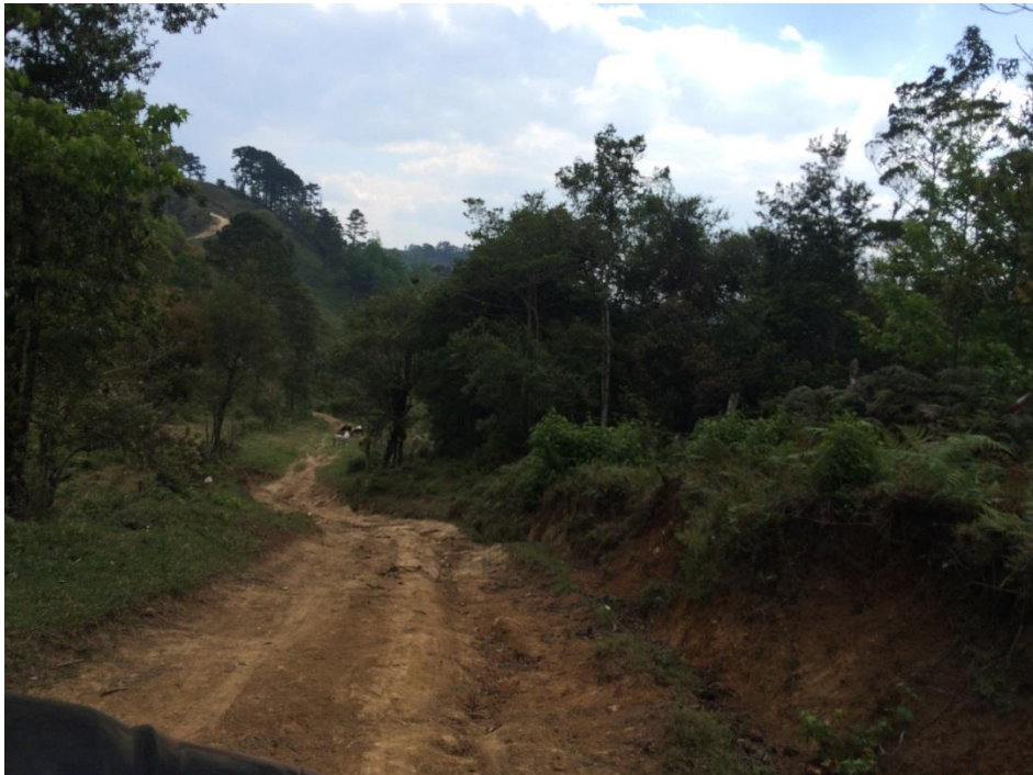
VISTA ACTUAL DEL MAL ESTADO DEL TRAMO A REPARAR