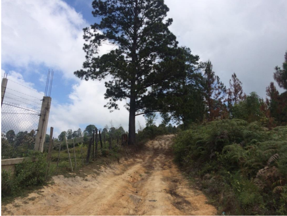
VISTA PANORAMICA DE TRAMO A REPARAR