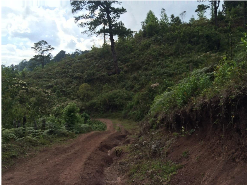
VISTA PANORAMICA DE TRAMO A REPARAR