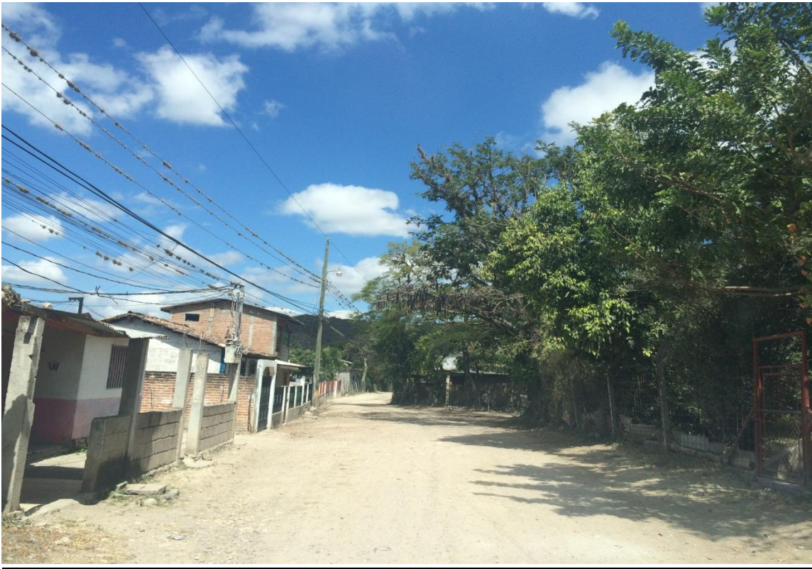
Inicio de proyecto