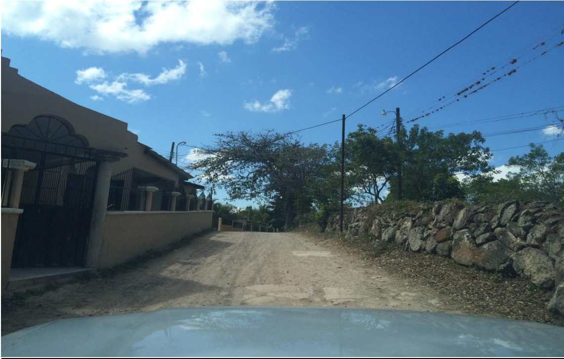
Tramo de calle para arreglar