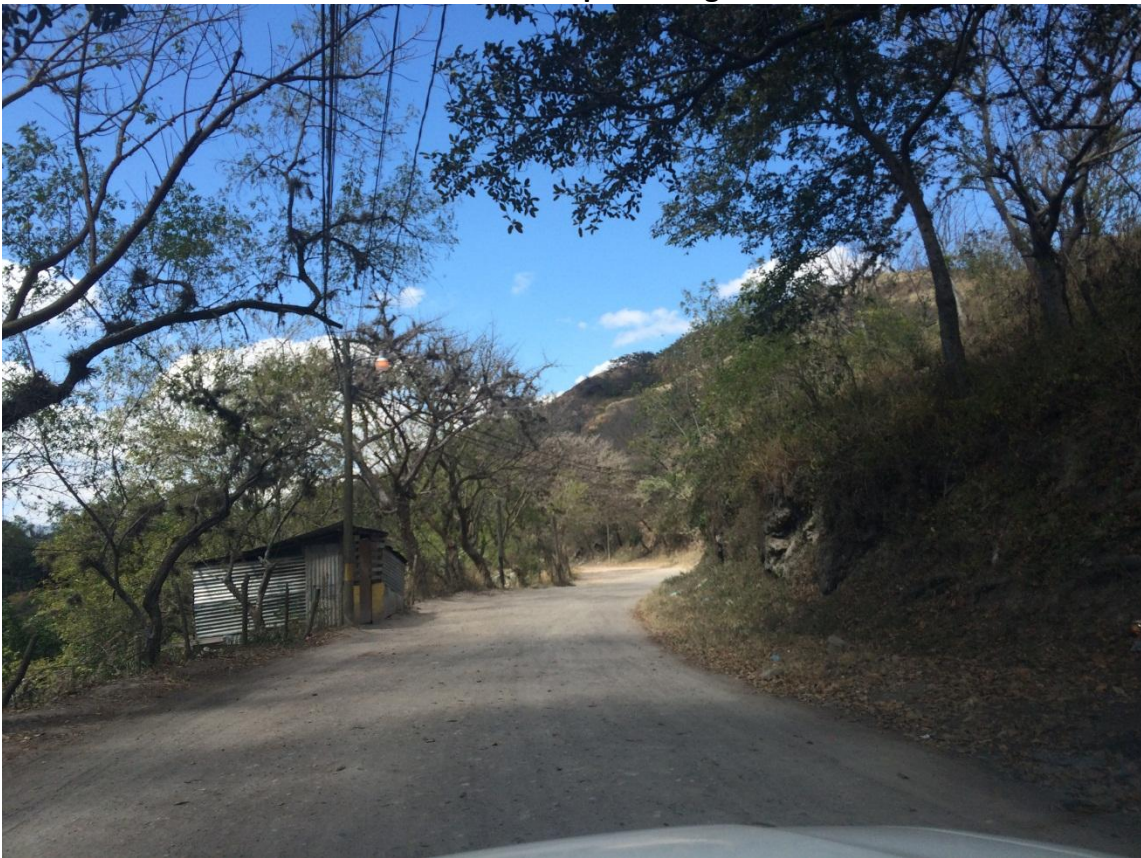
Final de proyecto a formular