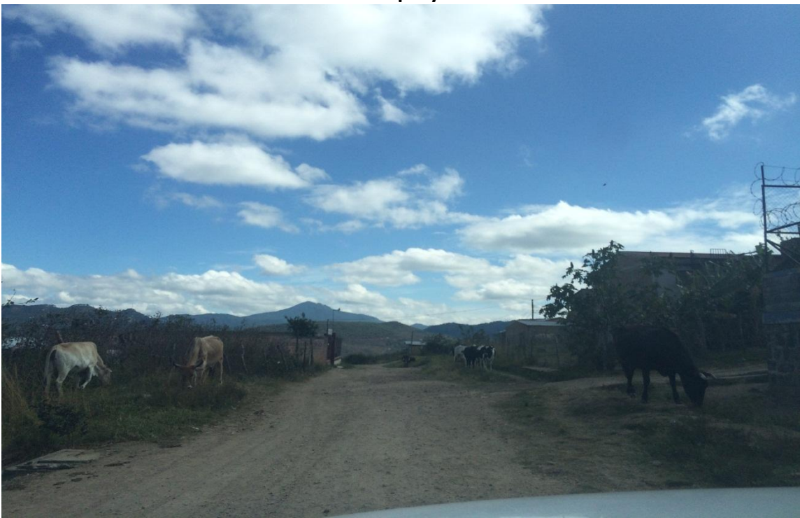
Vista panorámica de calle de proyecto