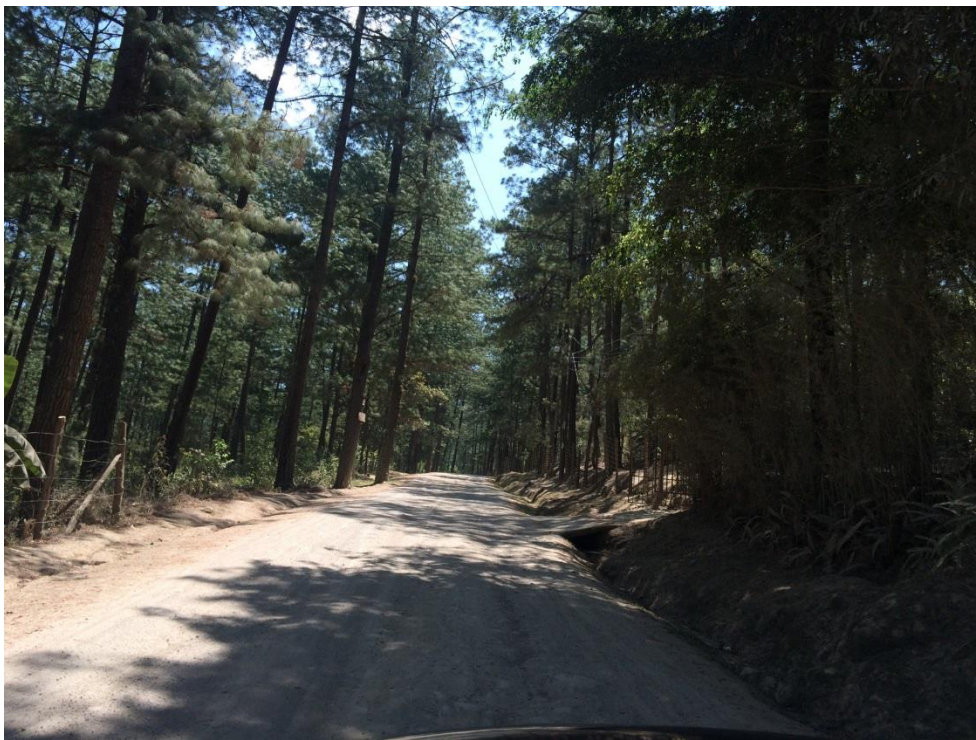
VISTA PANORAMICA DEL TRAMO A REHABILITAR