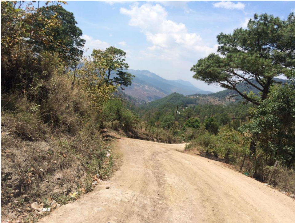
VISTA DEL MAL ESTADO DE LA CALLE HACIA ALDEA PILIGUIN