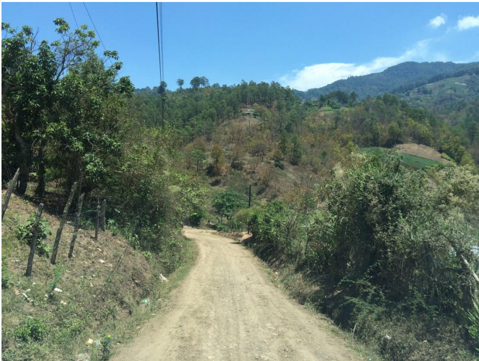
FINAL DEL TRAMO A REHABILITAR