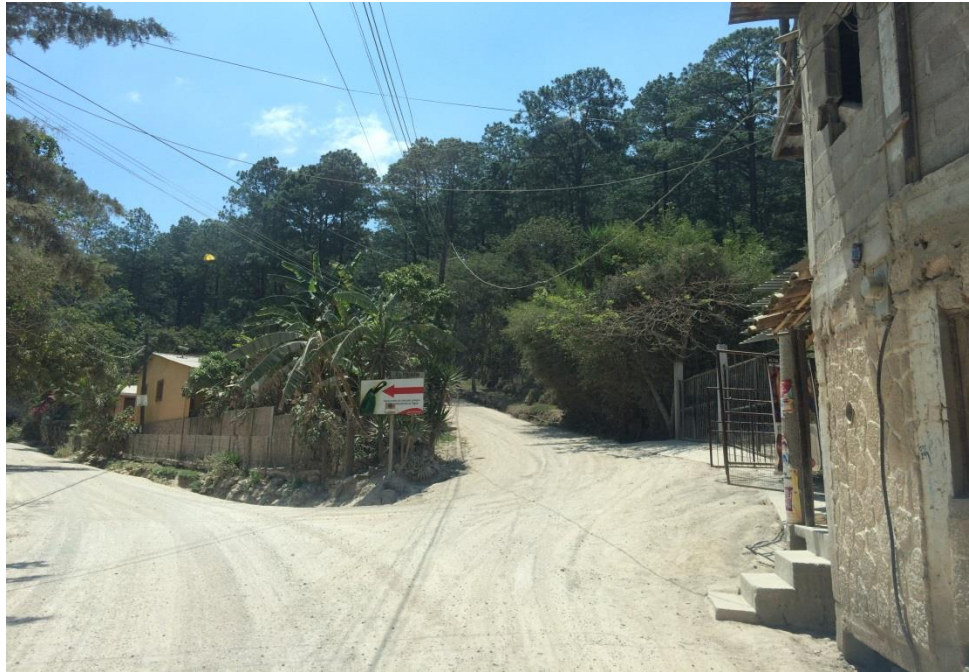
DESVIO HACIA ALDEA EL PILIGUIN E INICIO DE PROYECTO