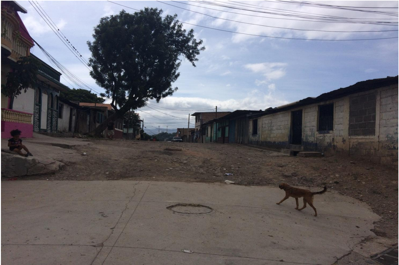
INICIO DE PROYECTO DE PAVIMENTACION