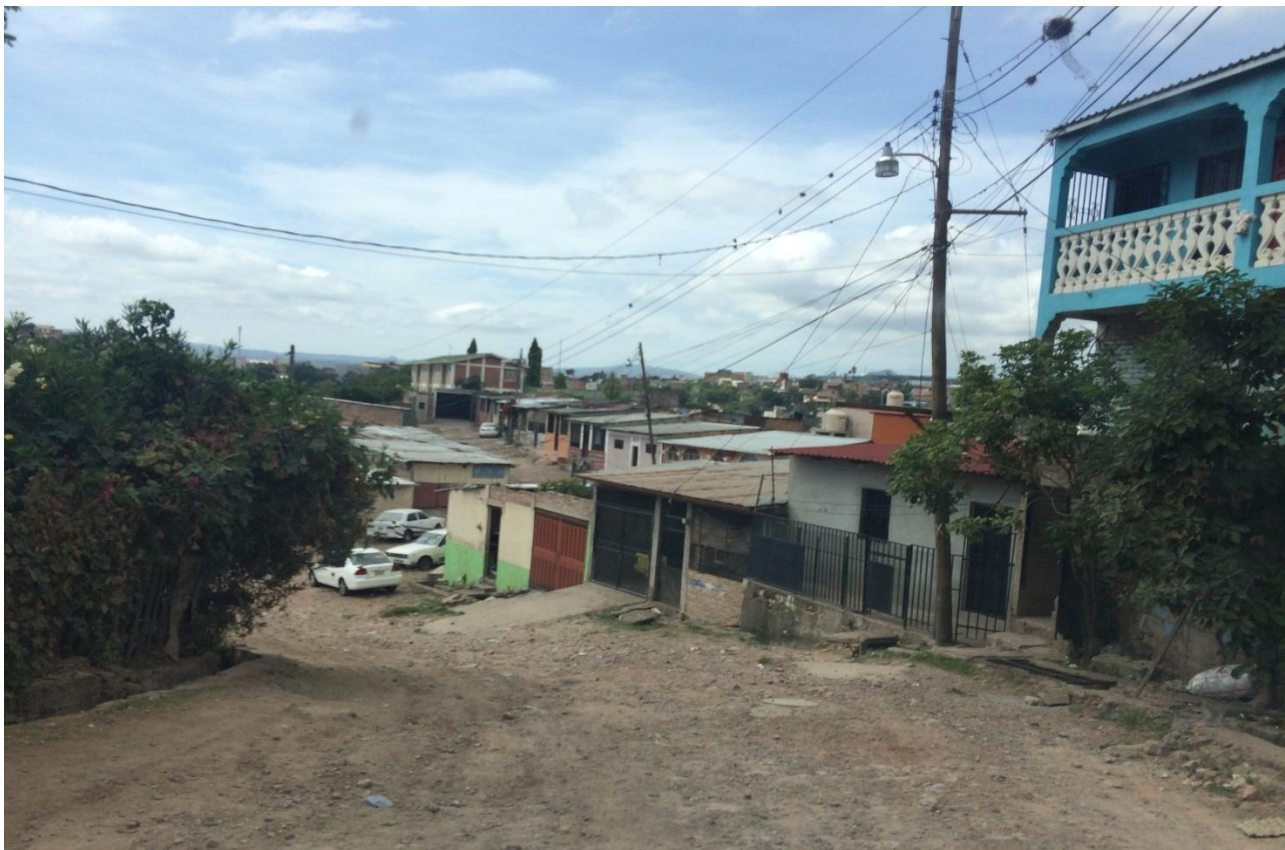
VISTA PANORAMICA DE CALLE A PAVIMENTAR