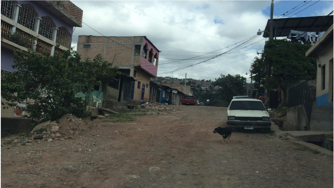
TRAMO DE CALLE A PAVIMENTAR