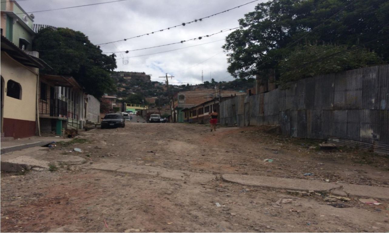
CALLE A PAVIMENTAR EN CALLE COL. LAS AYESTAS