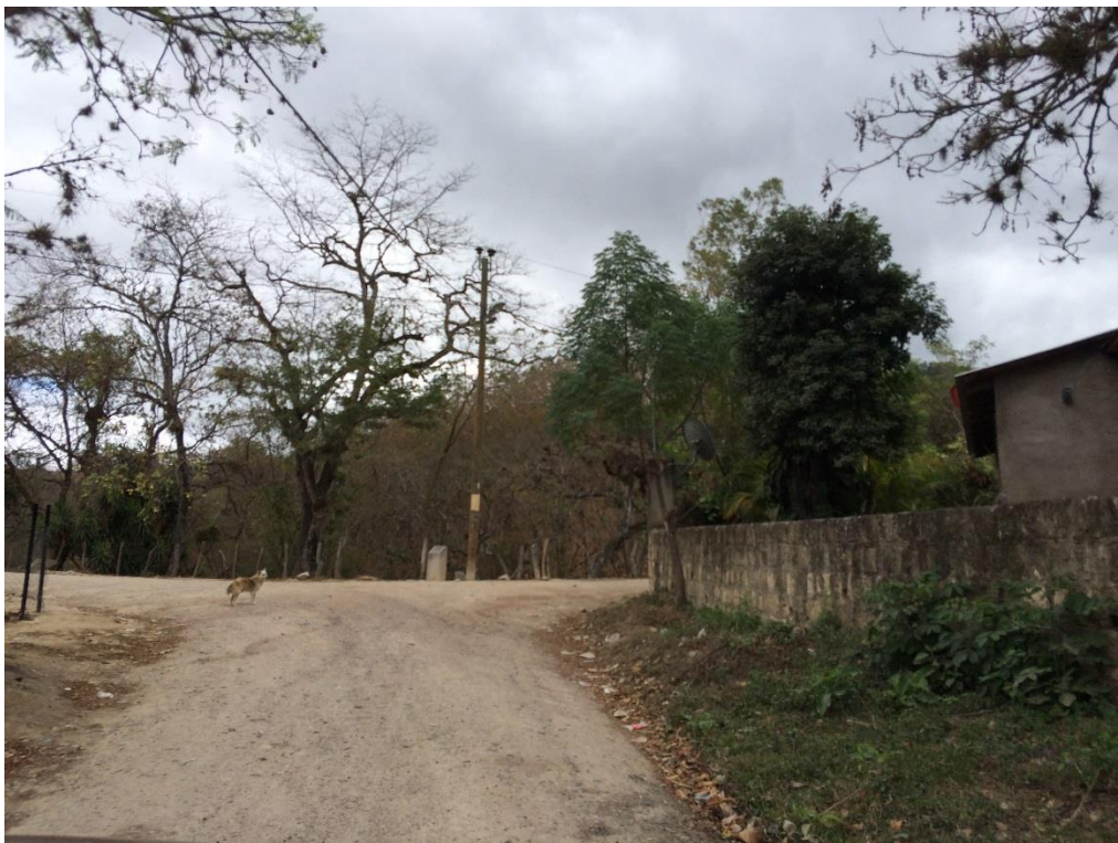
VISTA DEL FINAL DEL BALASTADO