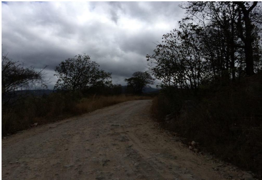
VISTA ACTUAL DE CALLE A REPARAR