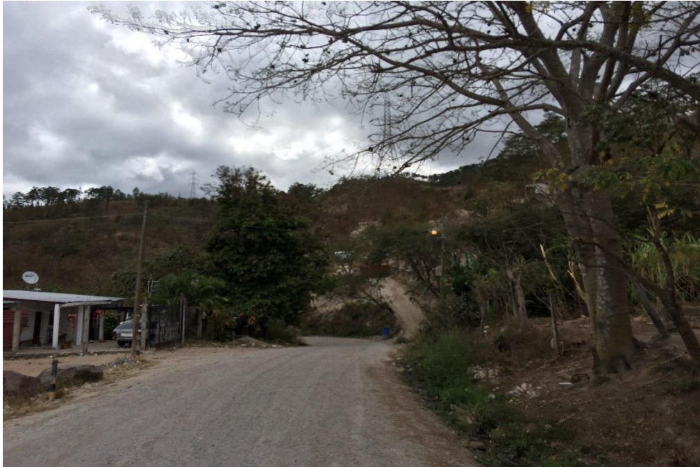
INICIO DE CALLE A REPARAR