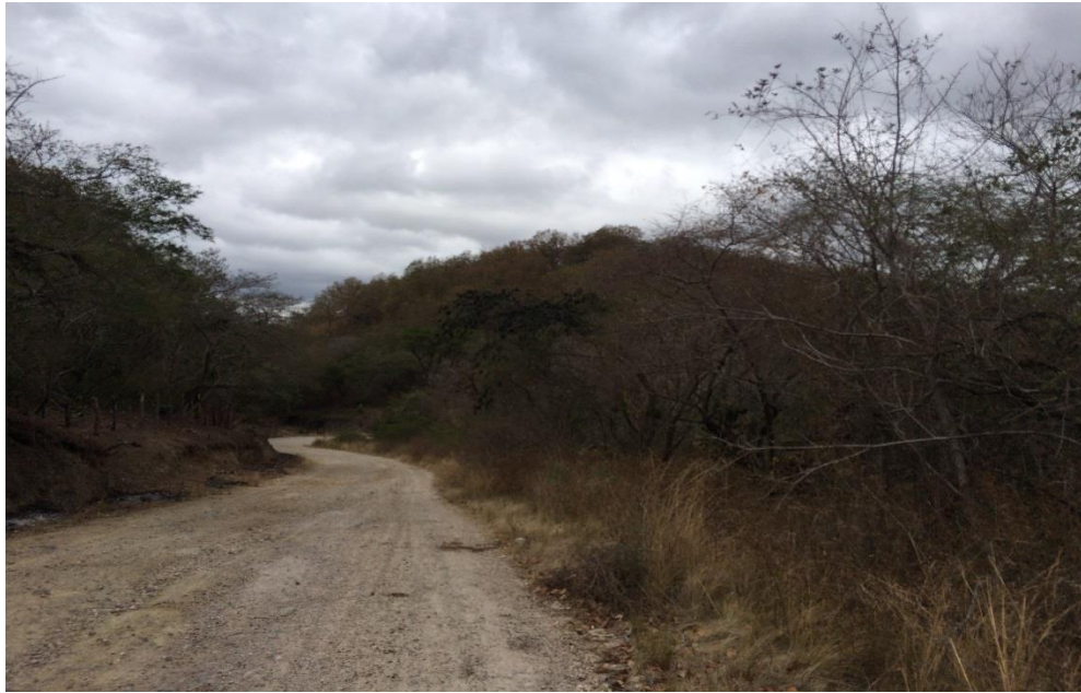
VISTA PANORÁMICA DE CALLE A REPARAR