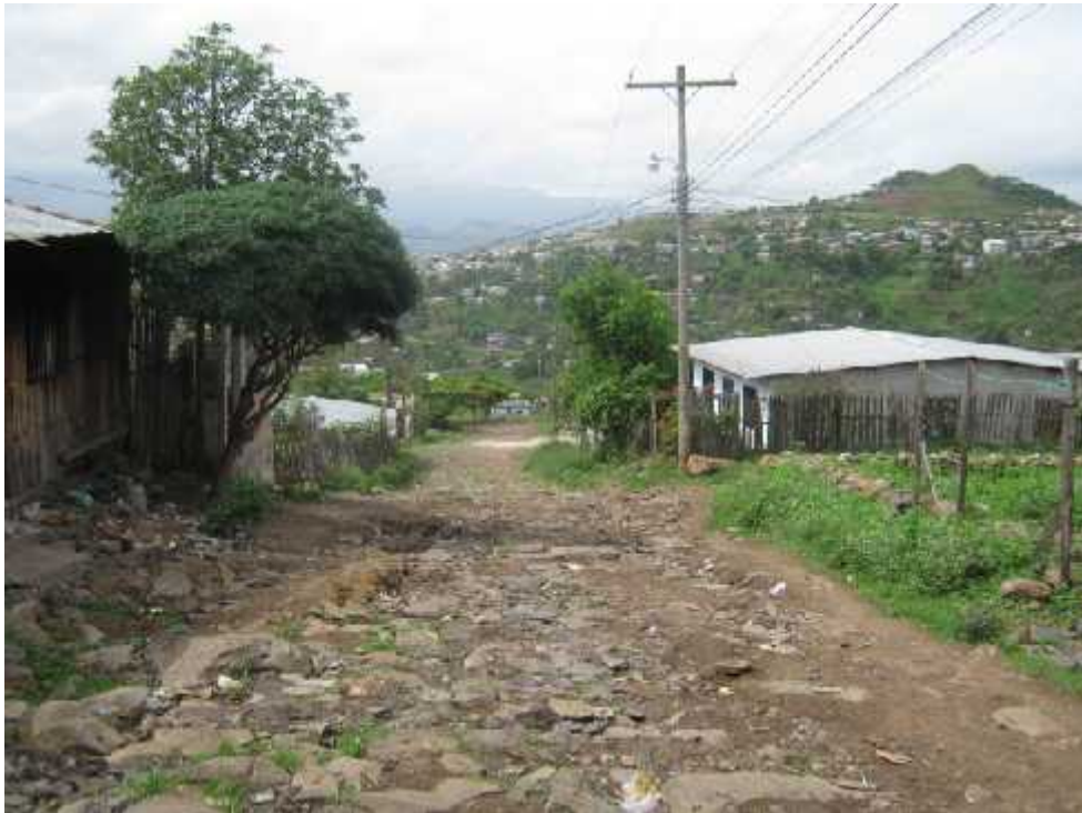
Panorama de calle a la que se le hará el balastado