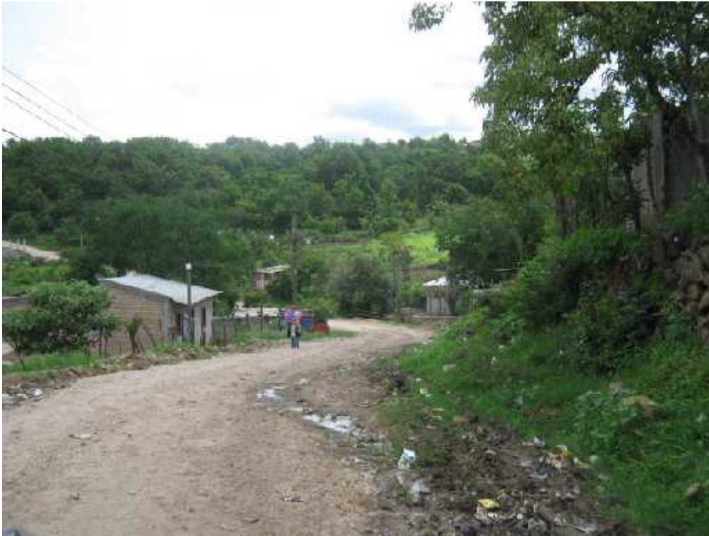
Panorama de calle a la que se le hará el balastado

Conformación y balastado de calles, colonia Berlín y colonia Nueva Capital Código: 1172