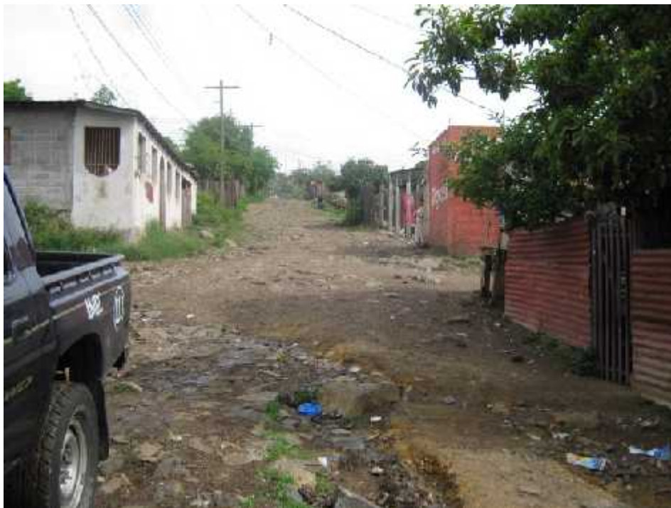
Panorama de calle a la que se le hará el balastado