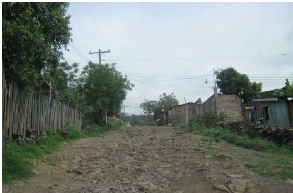
Panorama de calle a la que se le hará el balastado