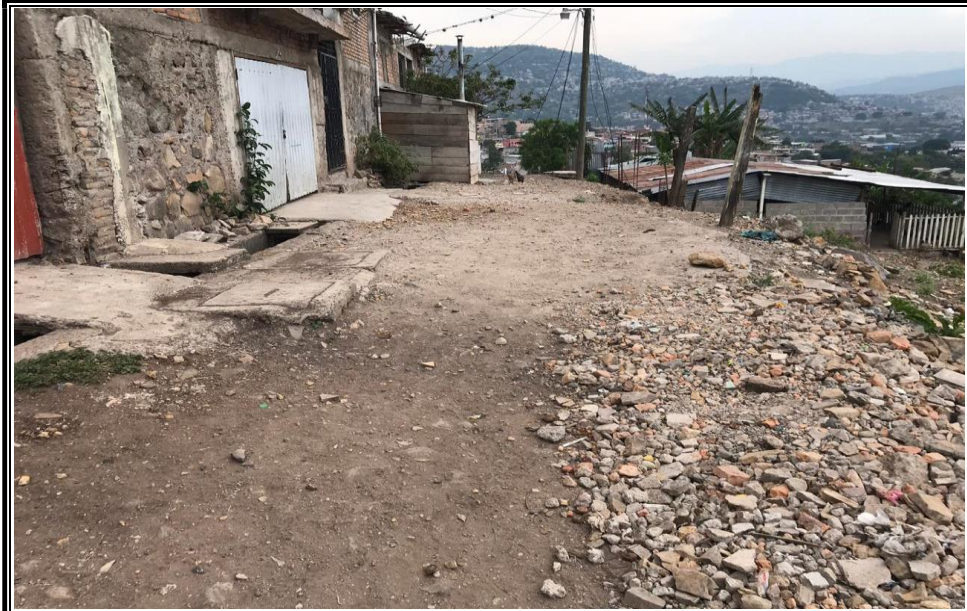
No. 1 Vista intermedia de calle No.1 se observan cunetas existentes.