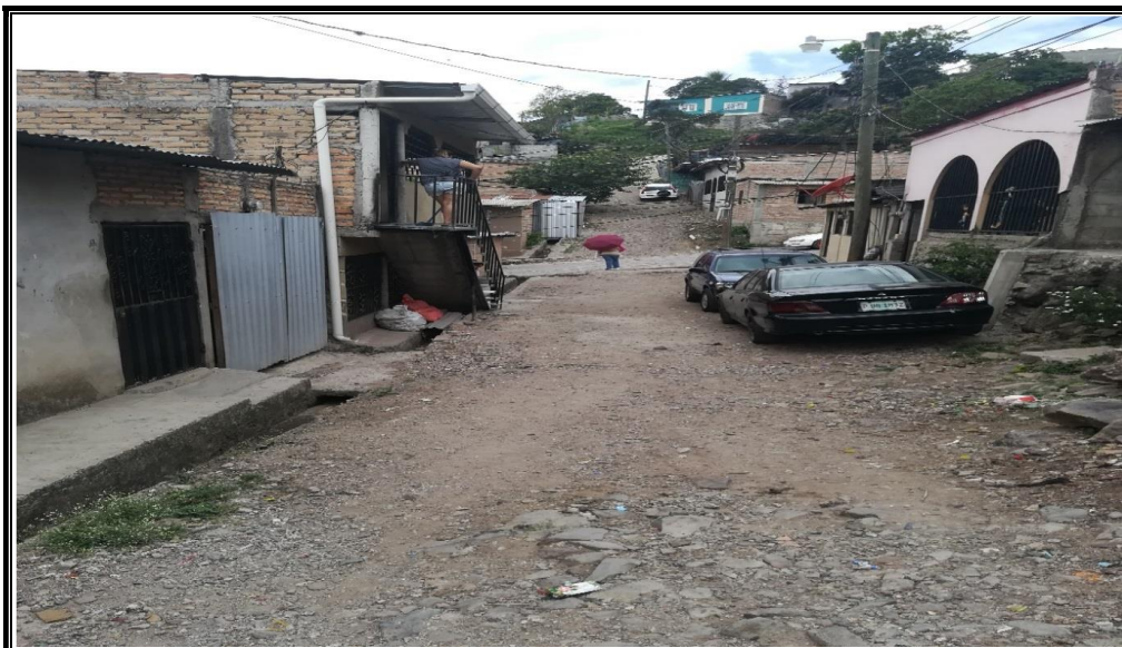
No. 2 Vista final calle No.2 a pavimentar, al fondo la calle principal empedrada col. Abraham Lincoln.