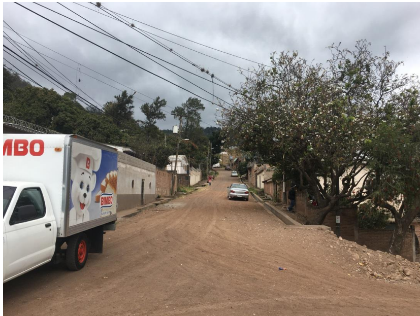
PANORAMA DE LA CALLE A PAVIMENTAR