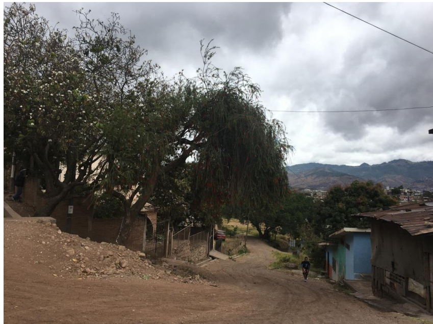
FINAL DE CALLE A PAVIMENTAR CON CONCRETO HIDRÁULICO