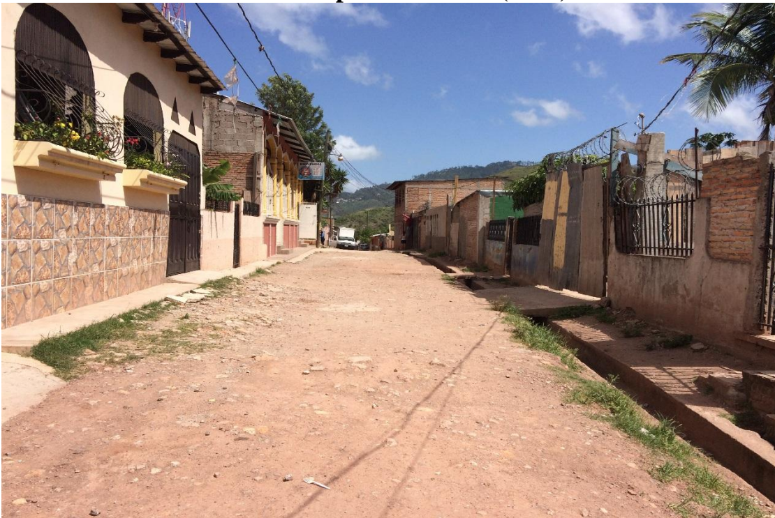
Fin de pavimento(4474)