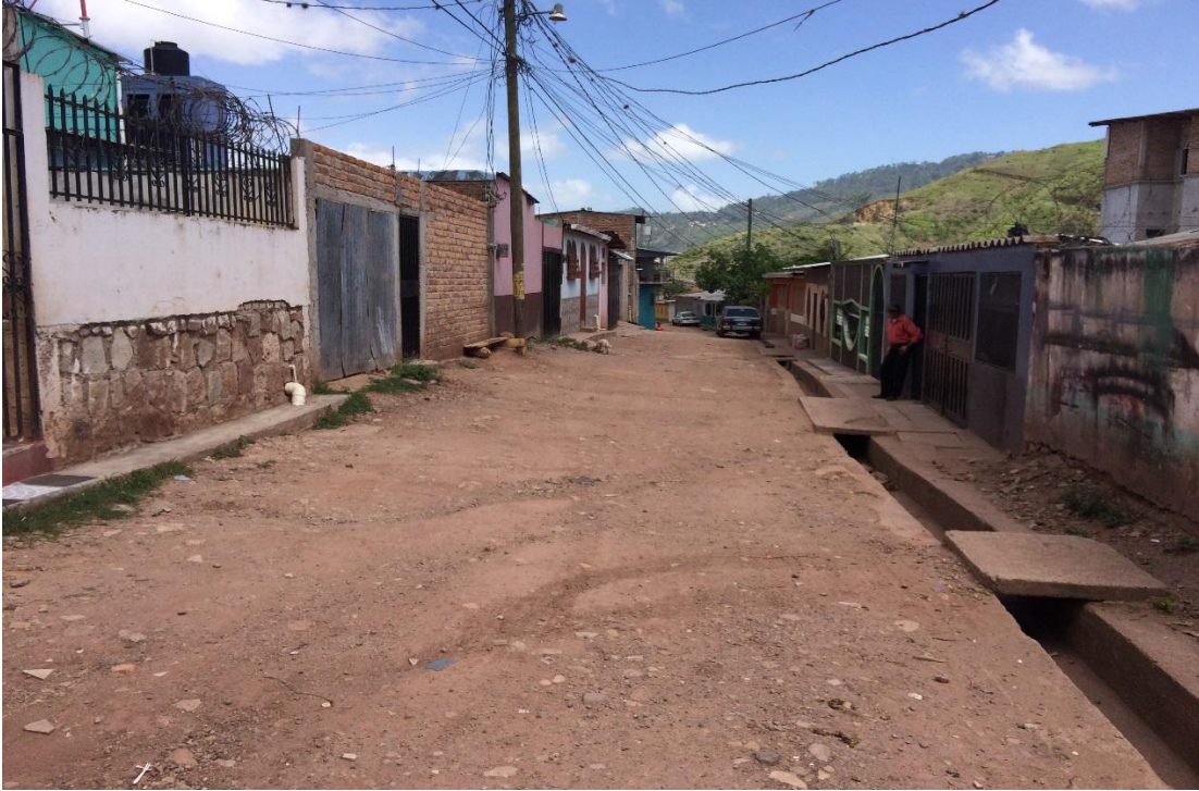
Vista de la pavimentacion(4464)