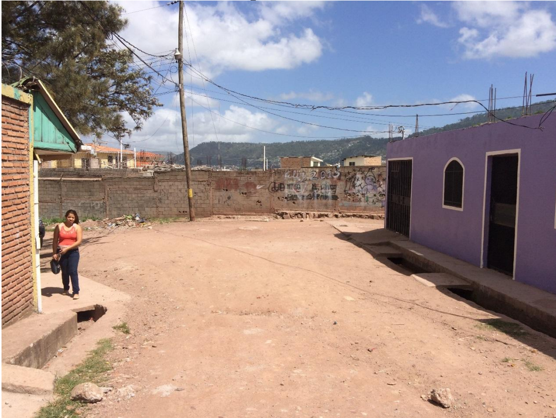
Vista panoramica de la pavimentacion(4467)