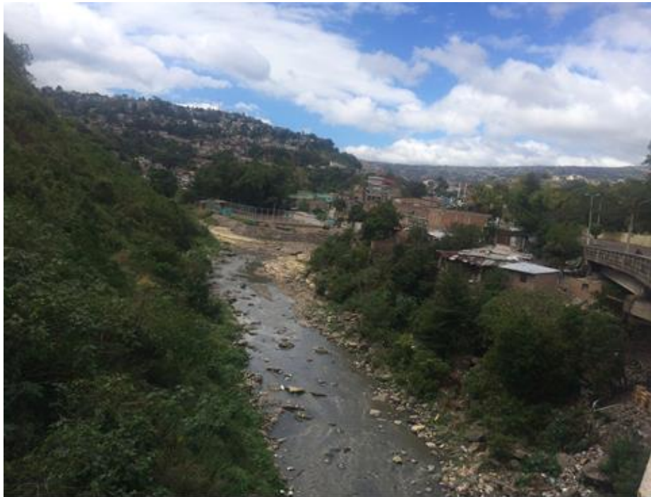
VISTA DEL TRAMO, LOCALIZADO EN COL. PROGRESO