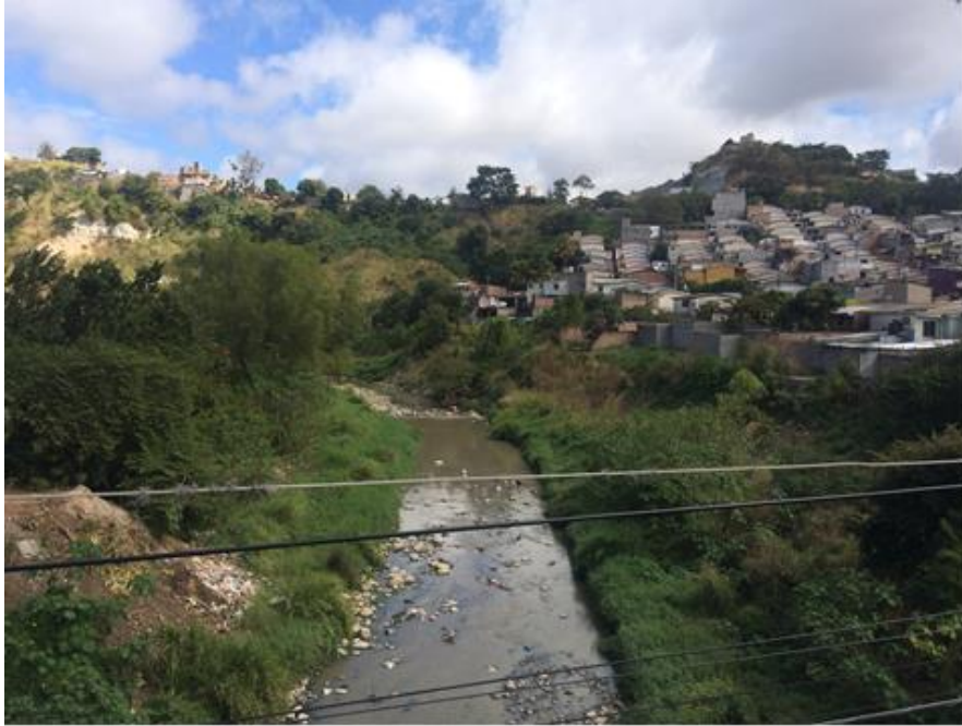
VISTA DEL TRAMO A CANALIZAR, COL. VENEZUELA