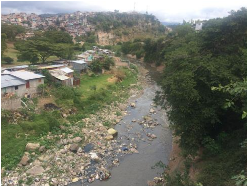
VISTA DEL TRAMO A CANALIZAR COL. PRIMAVERA

Proyecto: Mantenimiento en cauce de río Guacerique, puente col. Venezuela-barrio La Bolsa Código: 1598