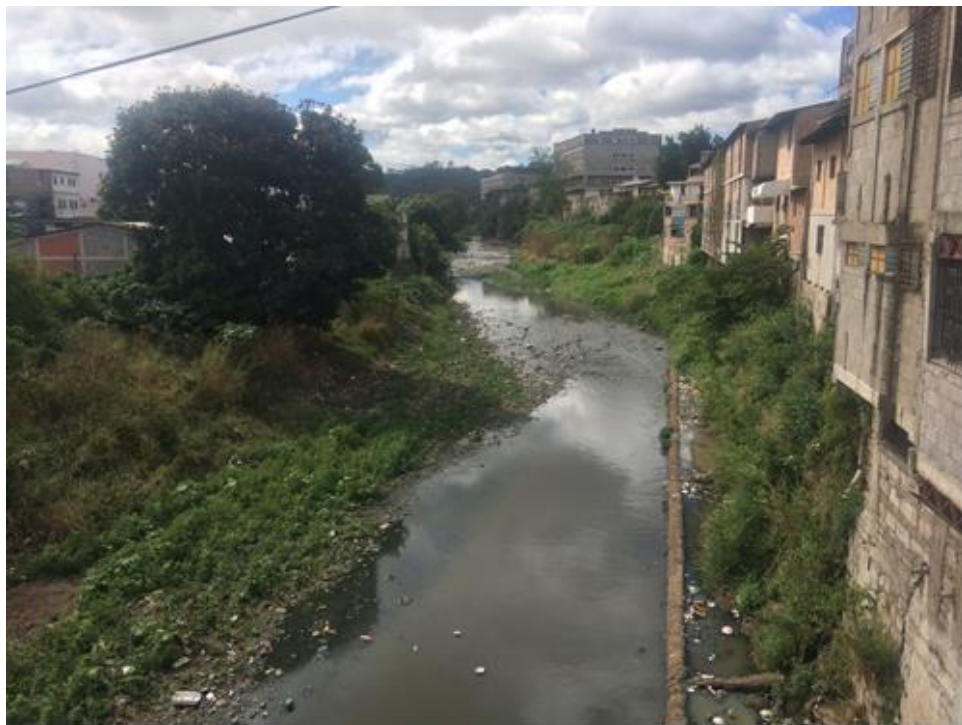
VISTA DEL TRAMO, LOCALIZADO EN EL BARRIO LA BOLSA