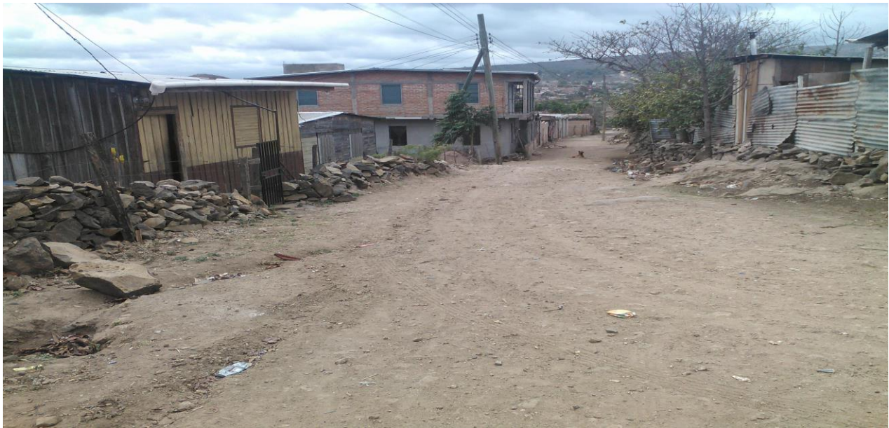
FOTO NO 2 Col. Brisas de Mogote Vista Panorámica de la Calle