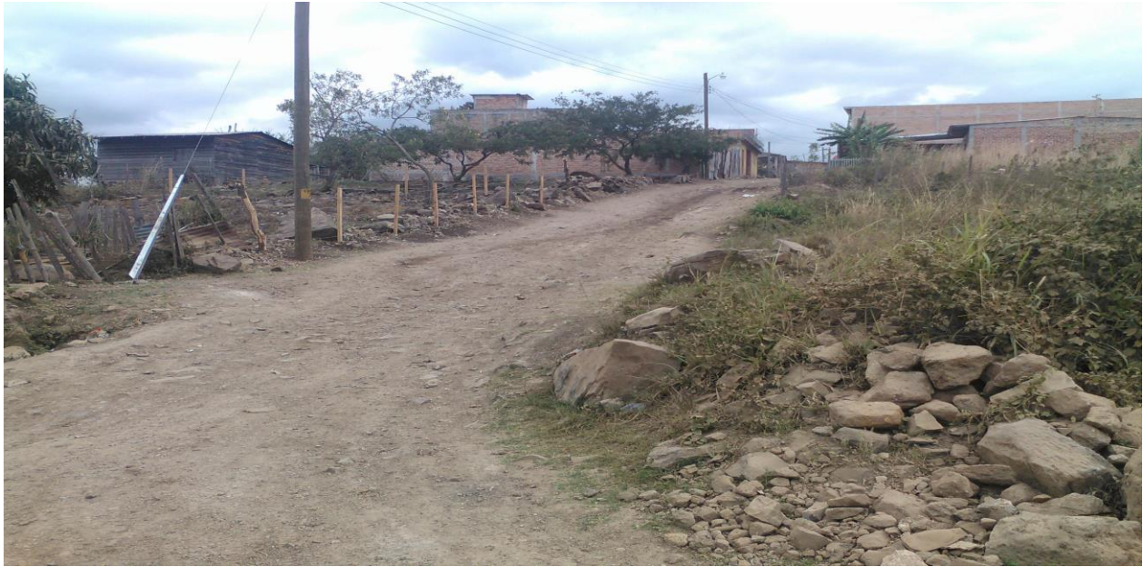
FOTO NO 1 Col. Brisas del Mogote Vista del Conformado y Balastado de Calles