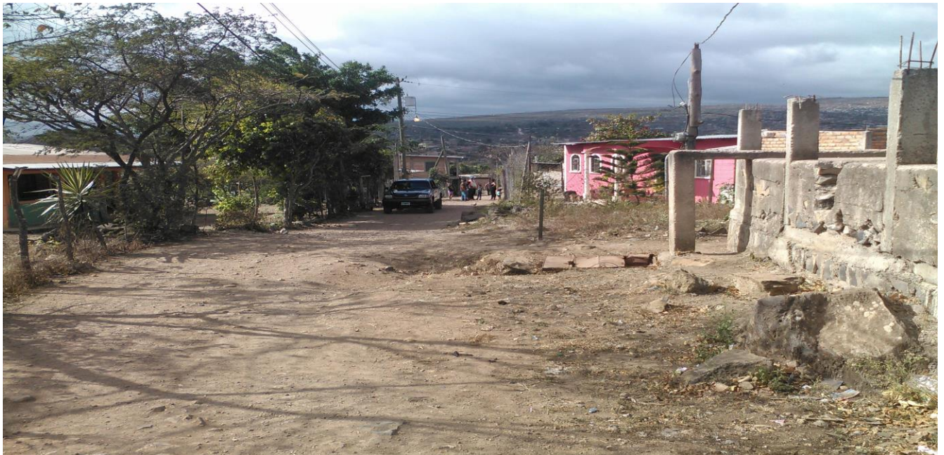
Foto no 4 Colonia Brisas del Mogote Conformar y Balastar

Vista de la Calle a Conformar y Balastar