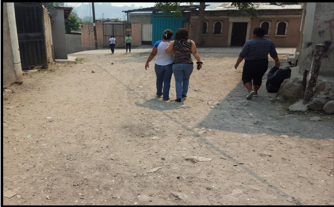
VISTA DE LA 4TA ENTRADA DE LA COL. VILLA LOS LAURELES