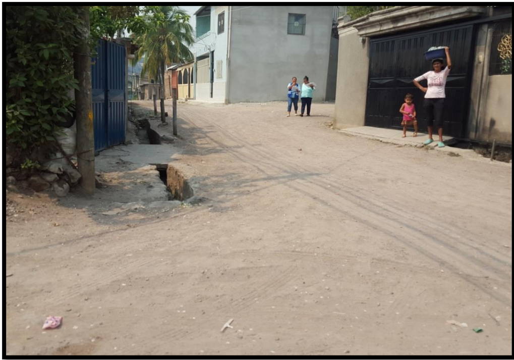
VISTA PANORAMICA DEL TRAMO A REPARAR