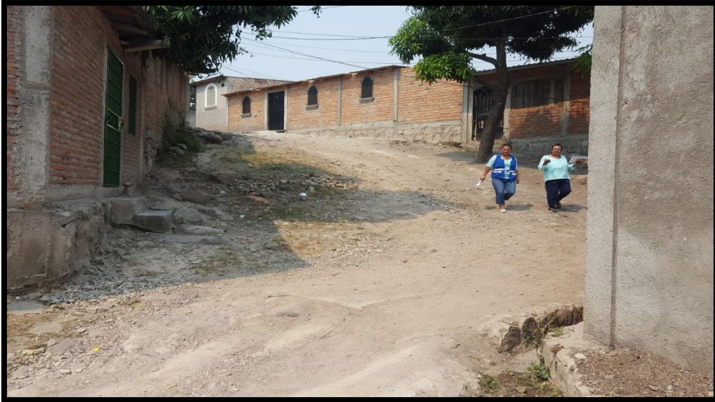
INICIO DE TRAMO A PAVIMENTAR