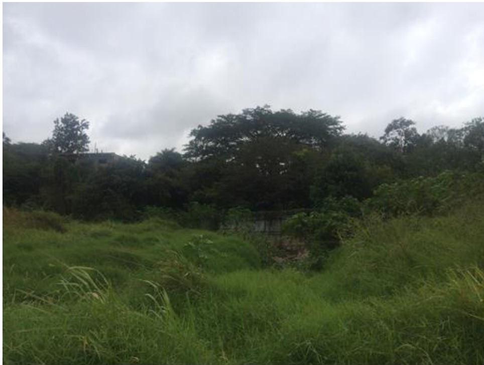
VISTA DEL TRAMO A CANALIZAR COL. HATO DE EN MEDIO

Proyecto: Mantenimiento en cauce de quebrada Salada, aldea Suyapa-quebrada Cajón Código: 1599