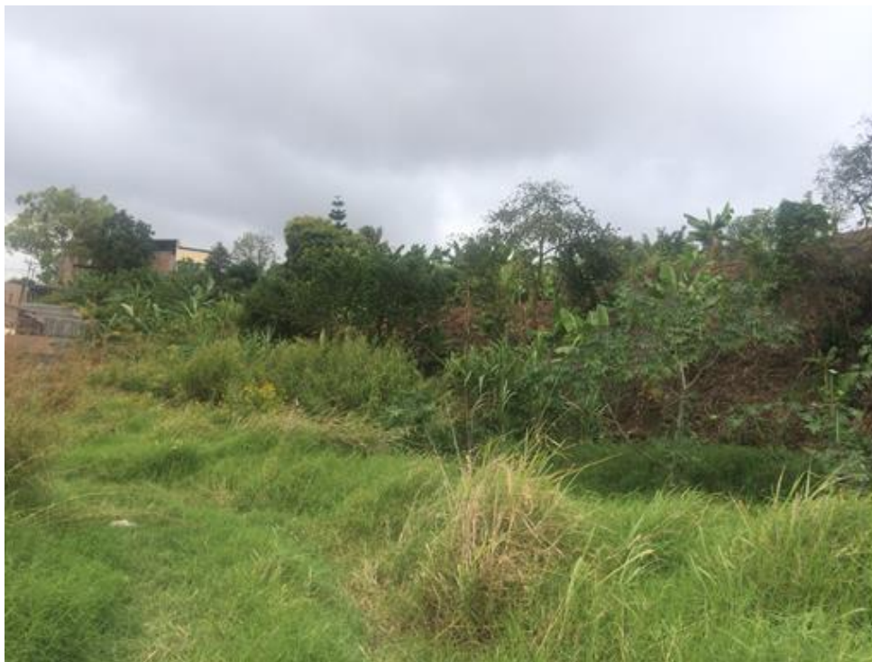
VISTA DEL TRAMO, LOCALIZADO EN COL. BELLA ORIENTE