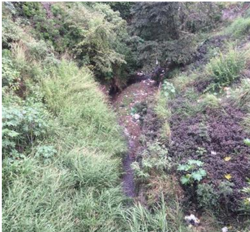
VISTA DEL TRAMO, LOCALIZADO EN ALDEA SUYAPA