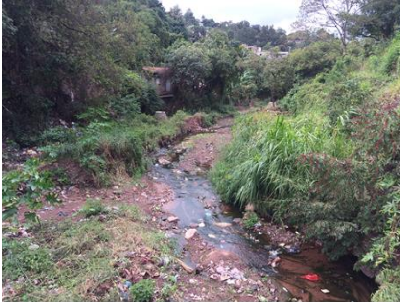
VISTA DEL TRAMO A CANALIZAR, COL. NUEVA SUYAPA