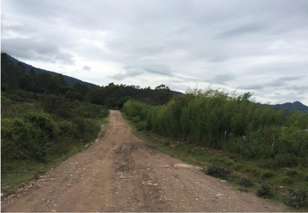
Vista Panorámica de un Tramo del Proyecto