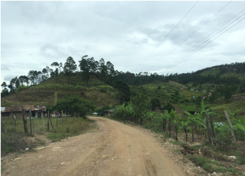
Final del proyecto calle rumbo a la comunidad de La Estancia