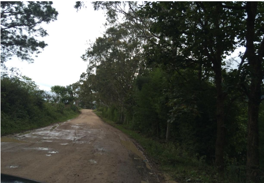
Vista Panorámica de un Tramo del Proyecto