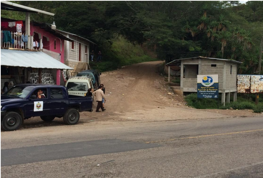
Inicio del Proyecto, en el desvío ubicado en la carretera de Oriente