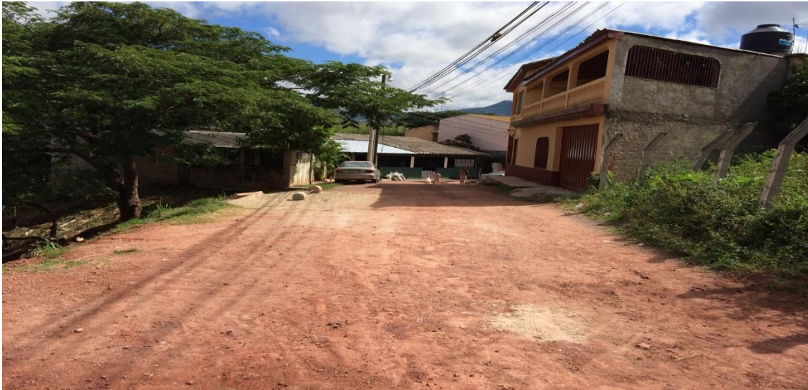
Vista panorámica de calle a pavimentar

Proyecto: Pavimentación de calle con concreto hidráulico, col. Altos de La Joya (última calle) Código: 931