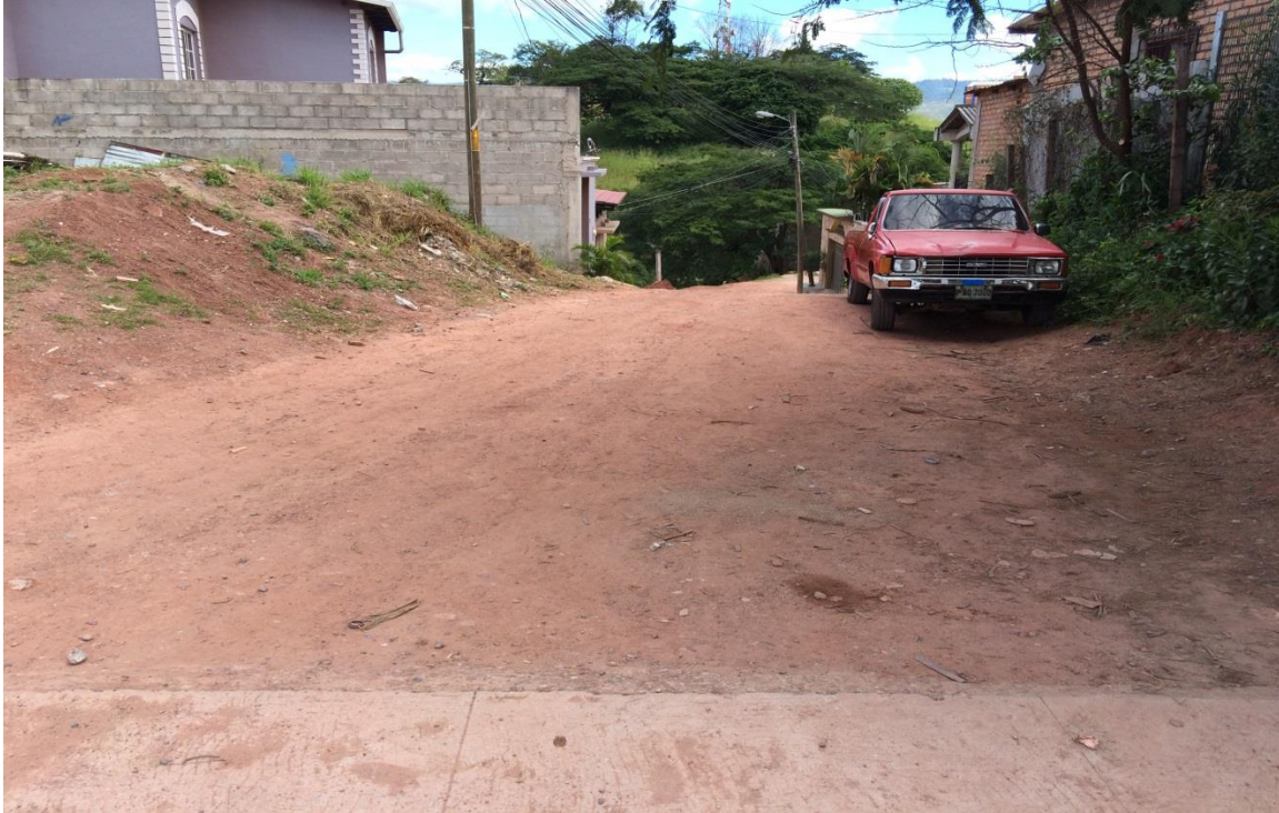
Inicio de pavimentación de calle