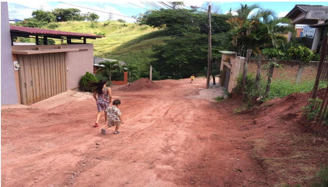
Tramo de calle a pavimentar en col. Altos de La Joya