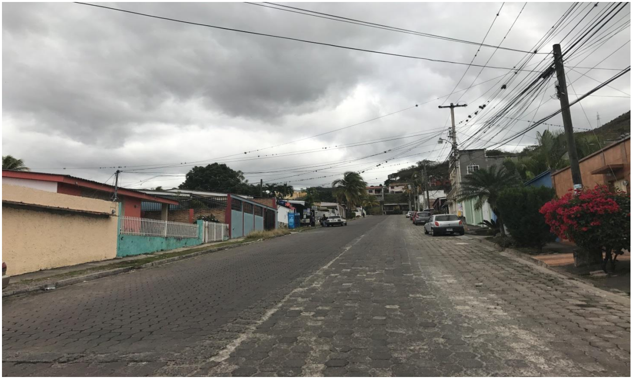
VISTA DE LA CALLE DONDE SE DESMONTARÁ EL ADOQUÍN