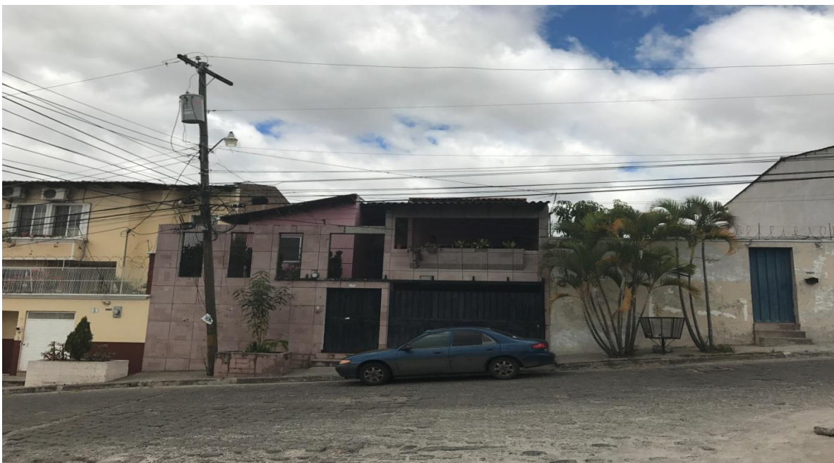
SE OBSERVA EL MAL ESTADO DEL ADOQUINADO