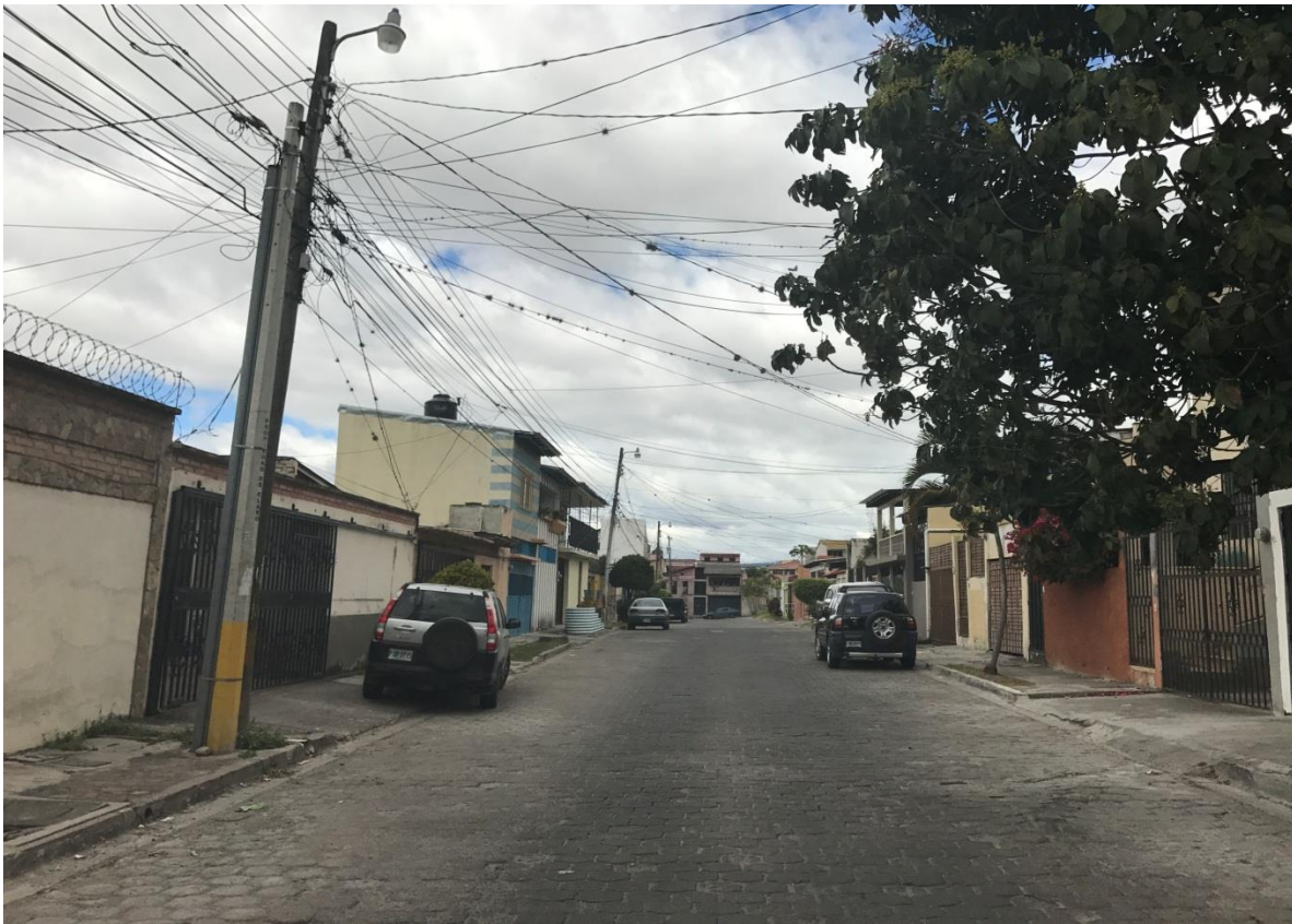
PANORÁMA DE LA CALLE A PAVIMENTAR

Proyecto: Pavimentación de calle con concreto hidráulico, col. Loarque, calle a Inice, salida al sur Código: 1555