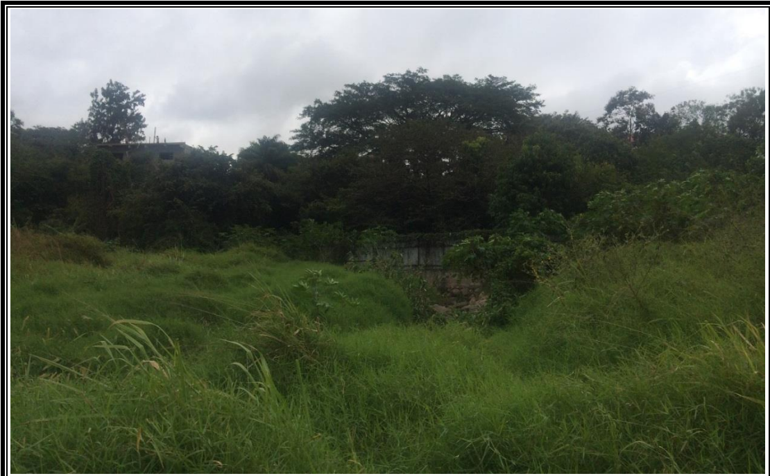
No. 3 SE OBSERVA UN TRAMO DEL CAUCE LLENO DE MALESA DE LA QUEBRADA SALADA