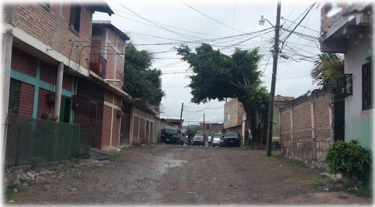
Inicio de calle a pavimentar con concreto hidráulico