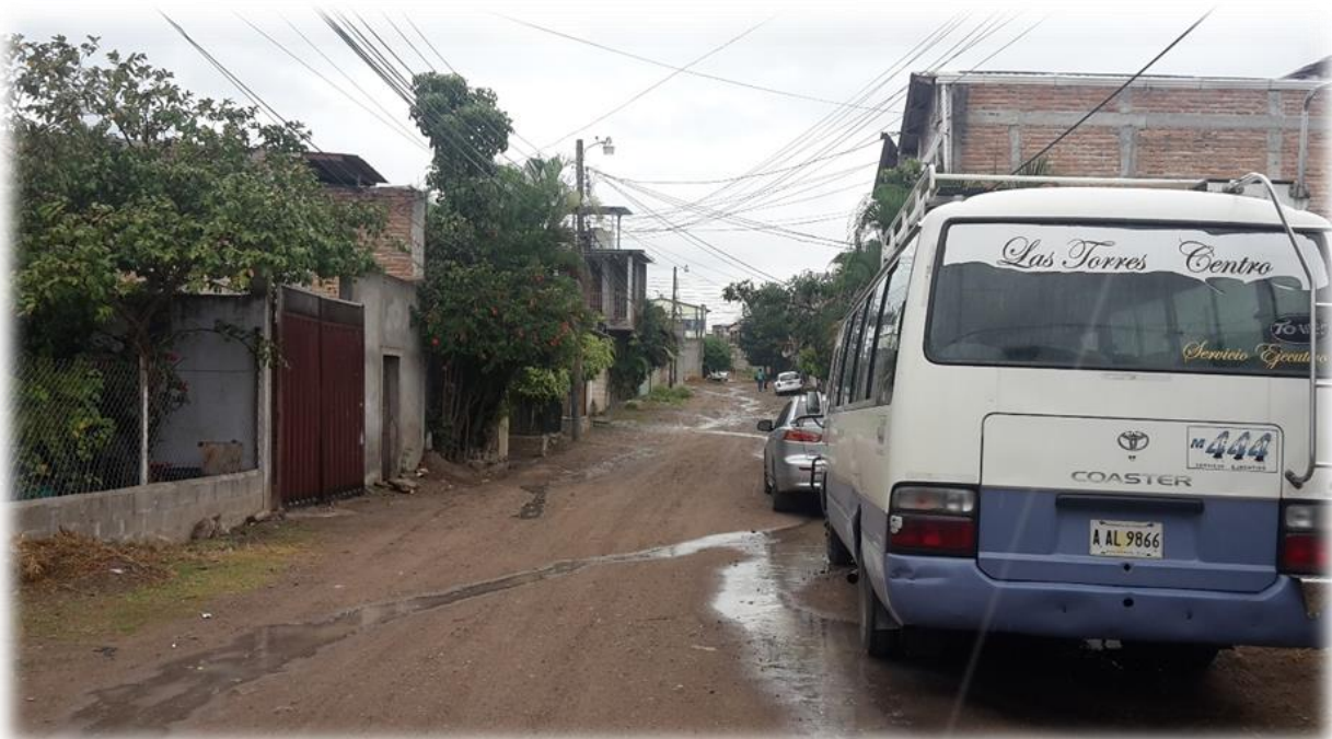
Vista de calle a pavimentar con concreto hidráulico