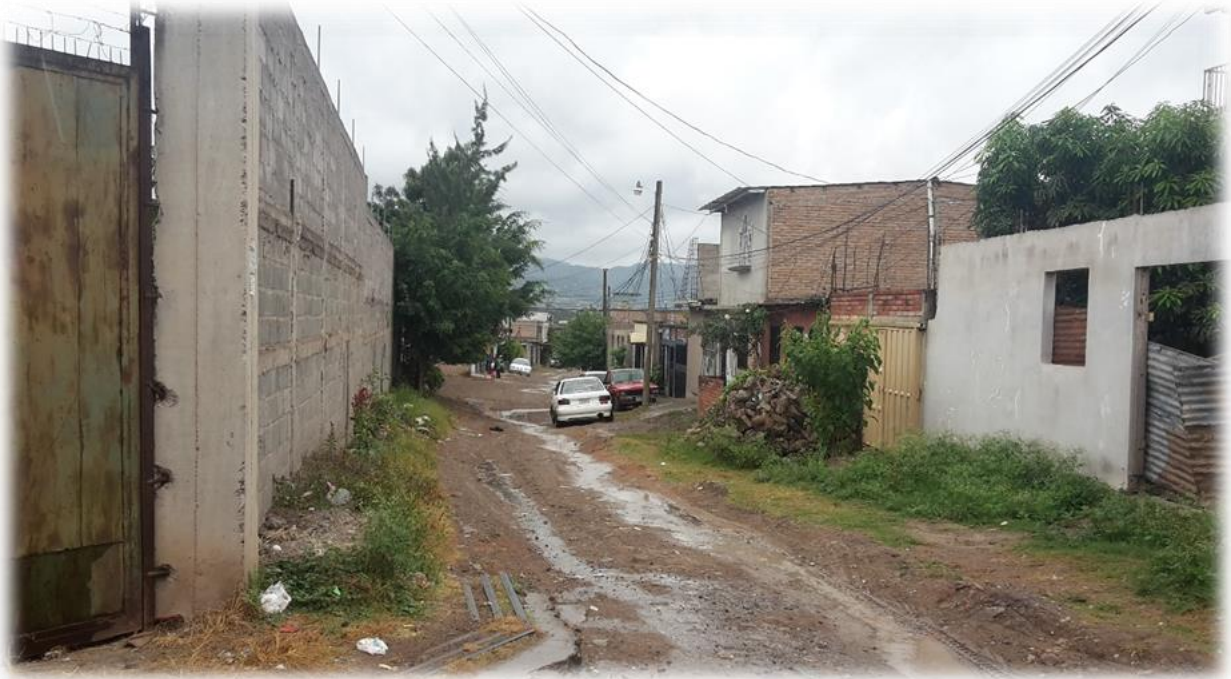
Vista de calle a pavimentar con concreto hidráulico