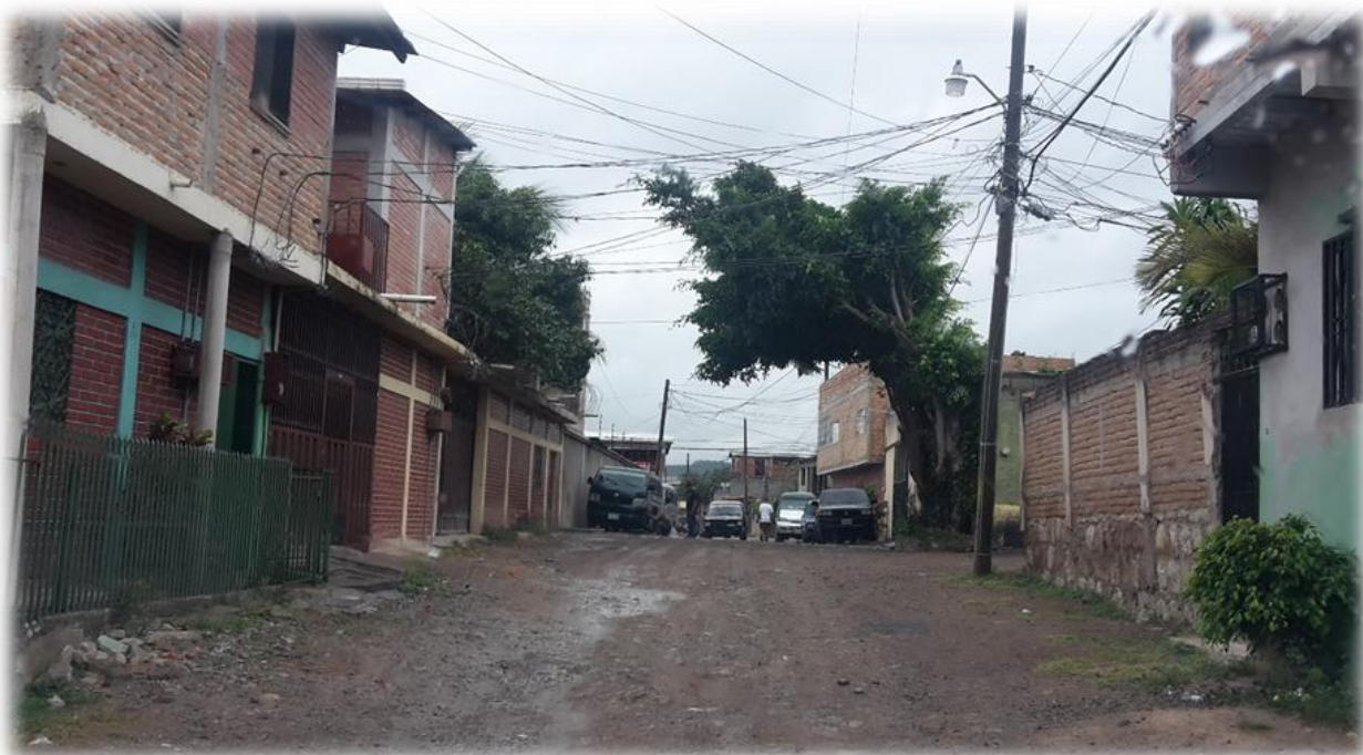
Final de calle a pavimentar con concreto hidráulico