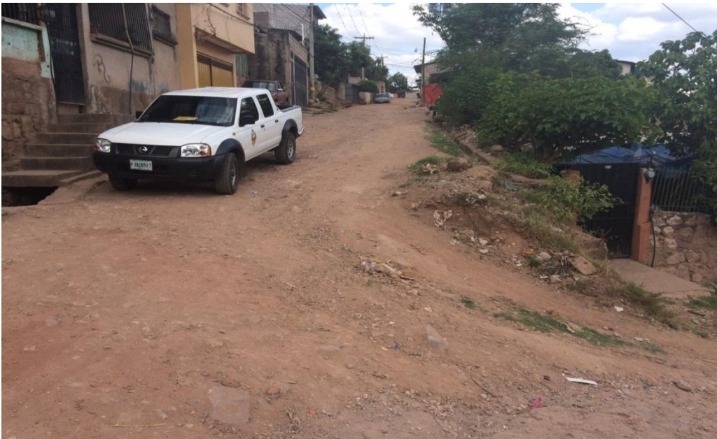
FIN DE LA CALLE A PAVIMENTA