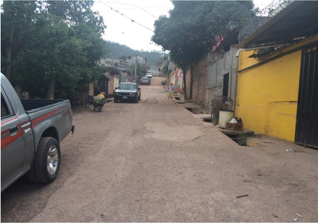
PANORÁMICA DE LA CALLE A PAVIMENTAR