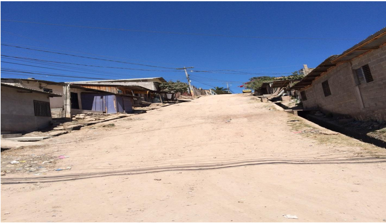
TRAMO DE CALLE DEL PROYECTO