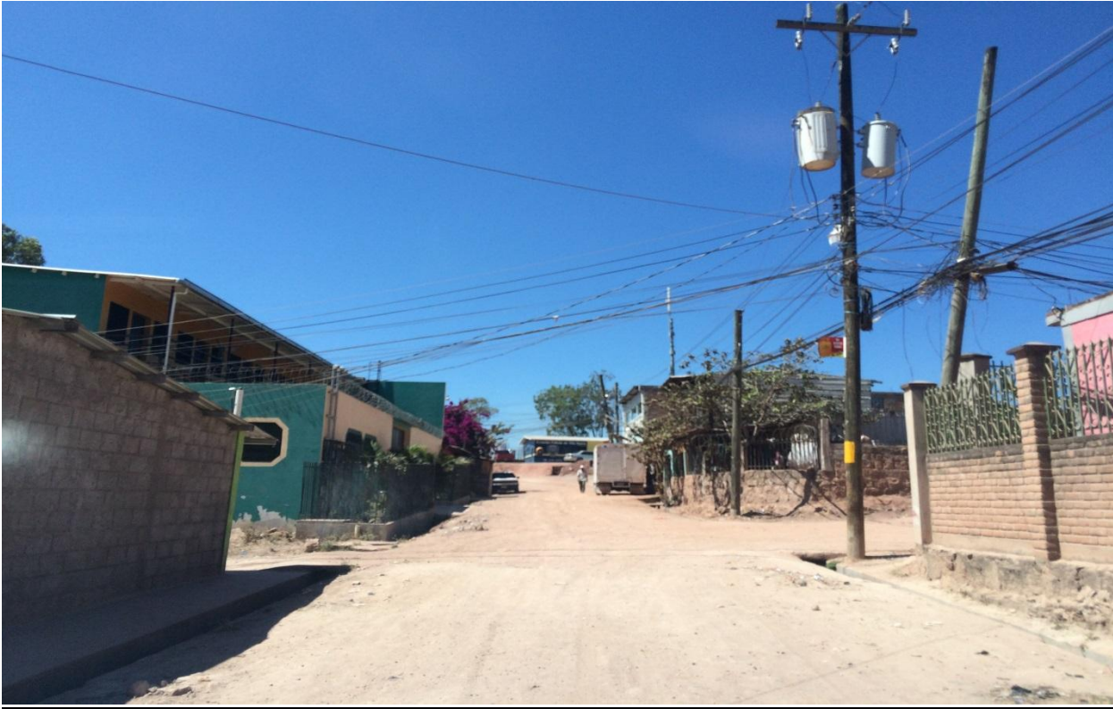
INICIO DE PROYECTO