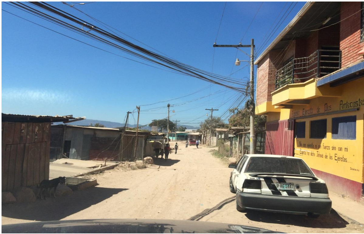
FINAL DE PROYECTO