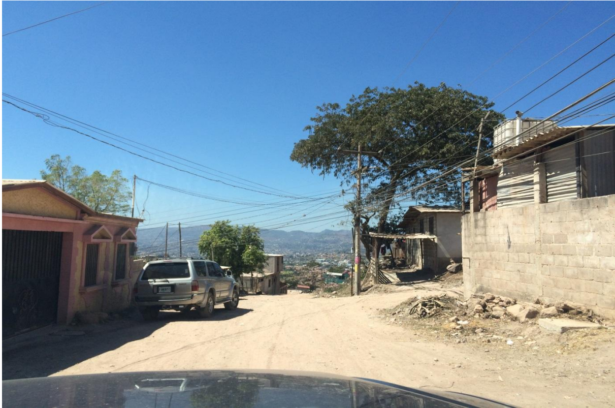
VISTA PANORAMICA DE CALLE PARA ARREGLAR