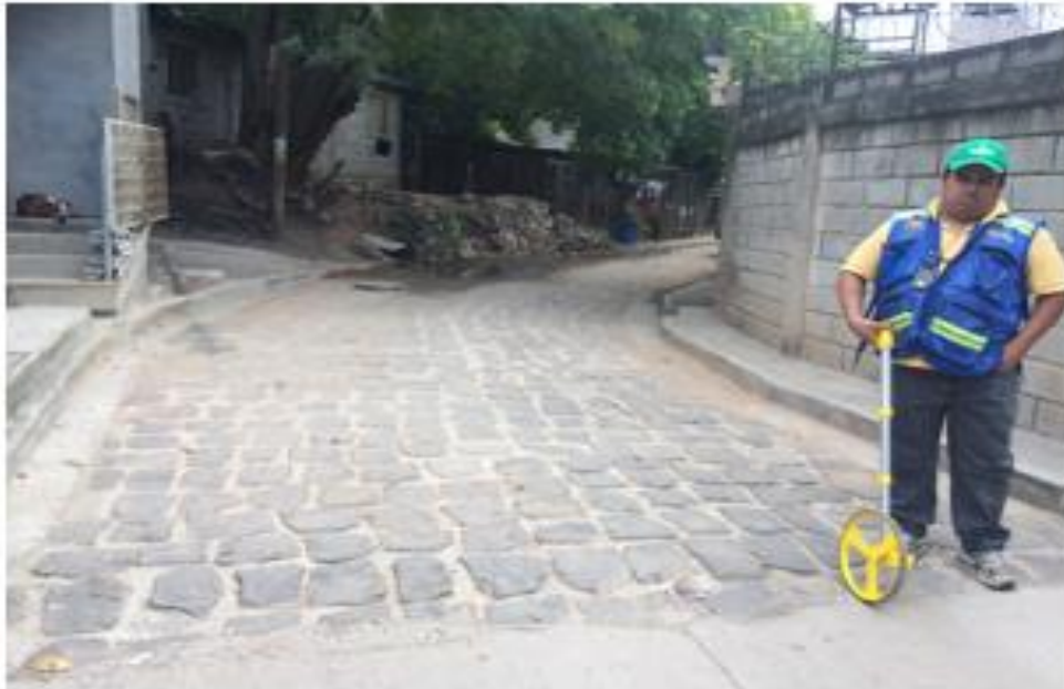
Inicio de calle a pavimentar con white topping

Proyecto: Pavimentación de calle con white topping, aldea Germania Código: 1590