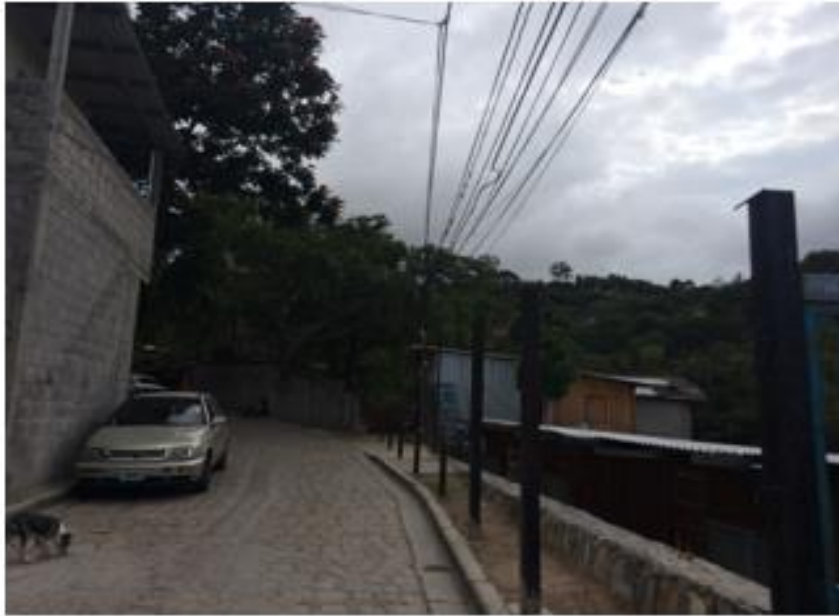
Vista de calle a pavimentar con white topping

Proyecto: Pavimentación de calle con white topping, aldea Germania Código: 1590