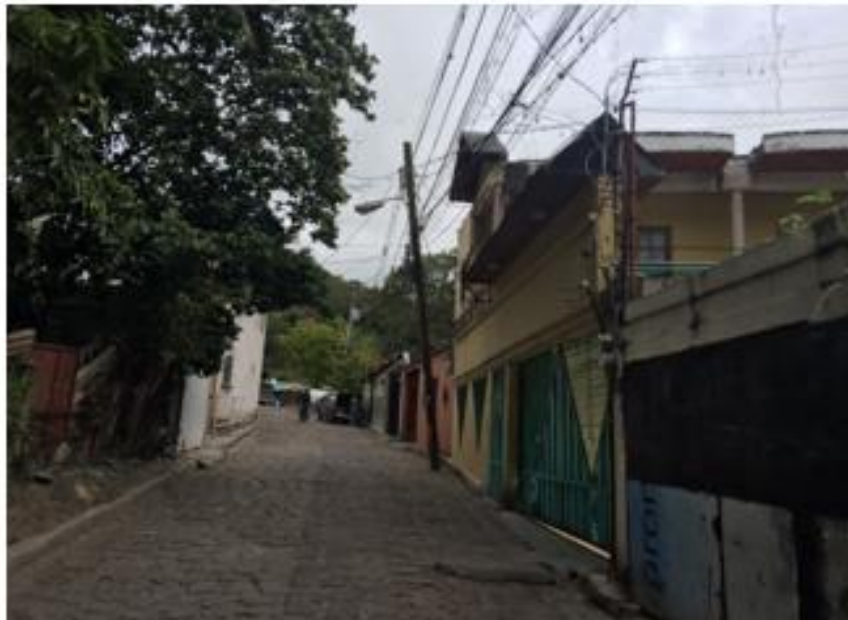
Panoráma de calle a pavimentar con white topping