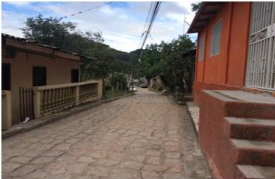
Vista de empedrado de calle a pavimentar con white topping