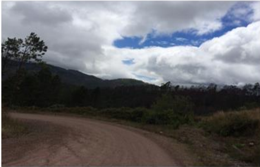
VISTA DE CALLES A REPARAR