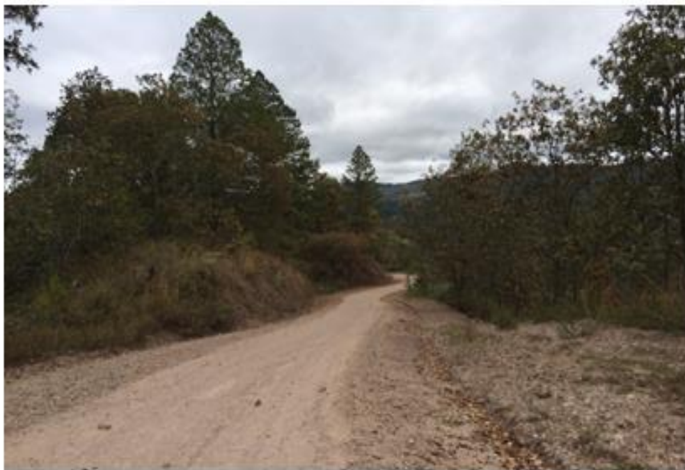
VISTA DE CALLE QUE REQUIERE BALASTADO