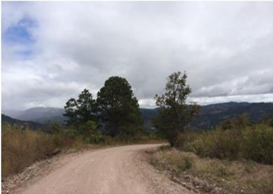
VISTA PANORÁMICA DE CALLES A REPARAR