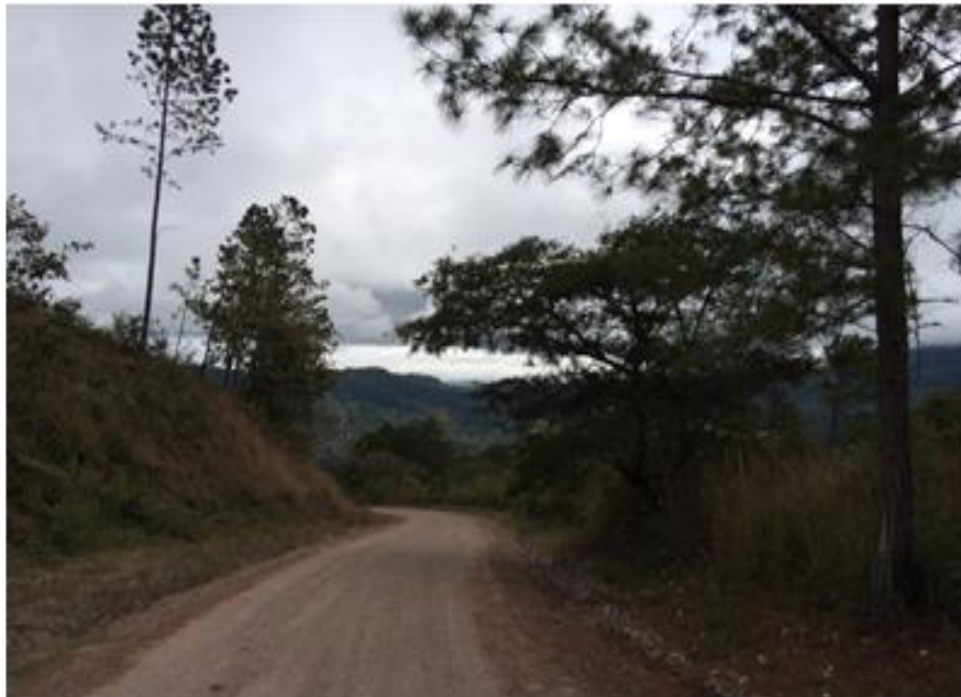
VISTA ACTUAL DE CALLES A REPARAR