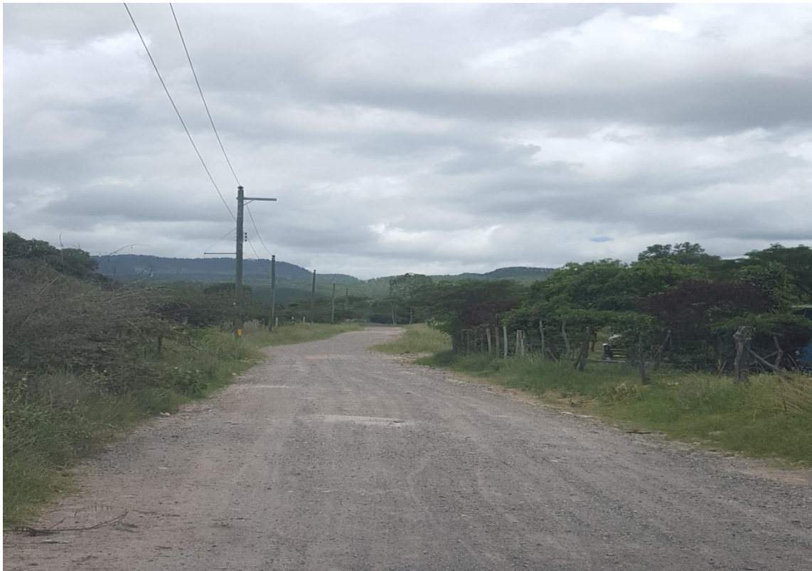
VISTA PANORAMICA DE CALLE A CONFORMAR