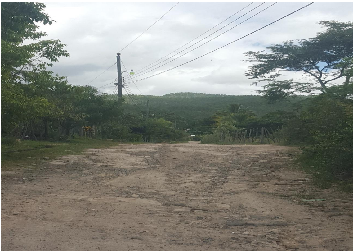
FINAL DE PROYECTO DE CONFORMACION DE CALLE