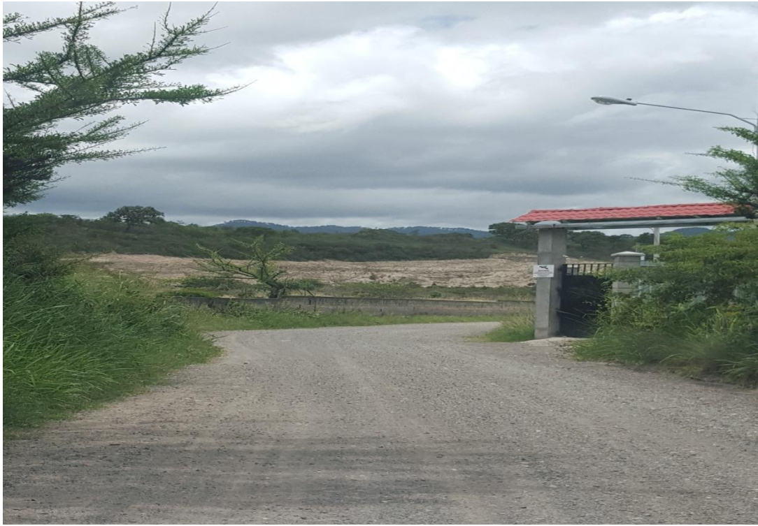
INICIO DE PROYECTO DE CONFORMACION Y BALASTADO