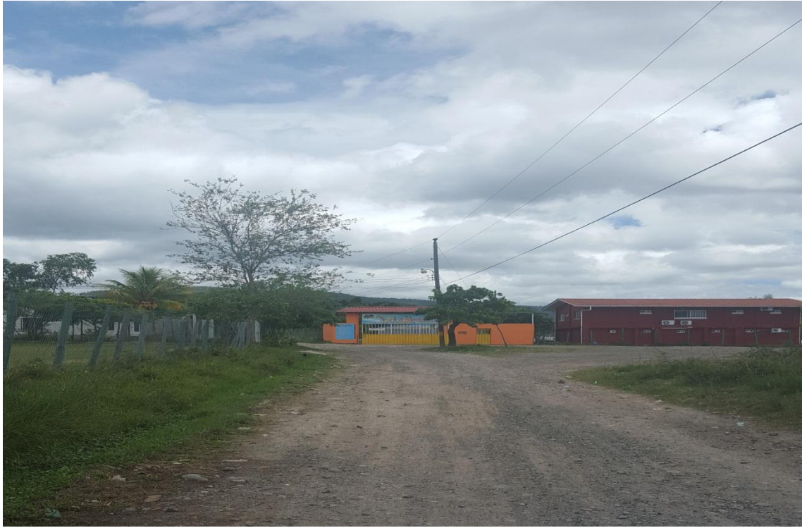
TRAMO DE CALLE A CONFORMAR