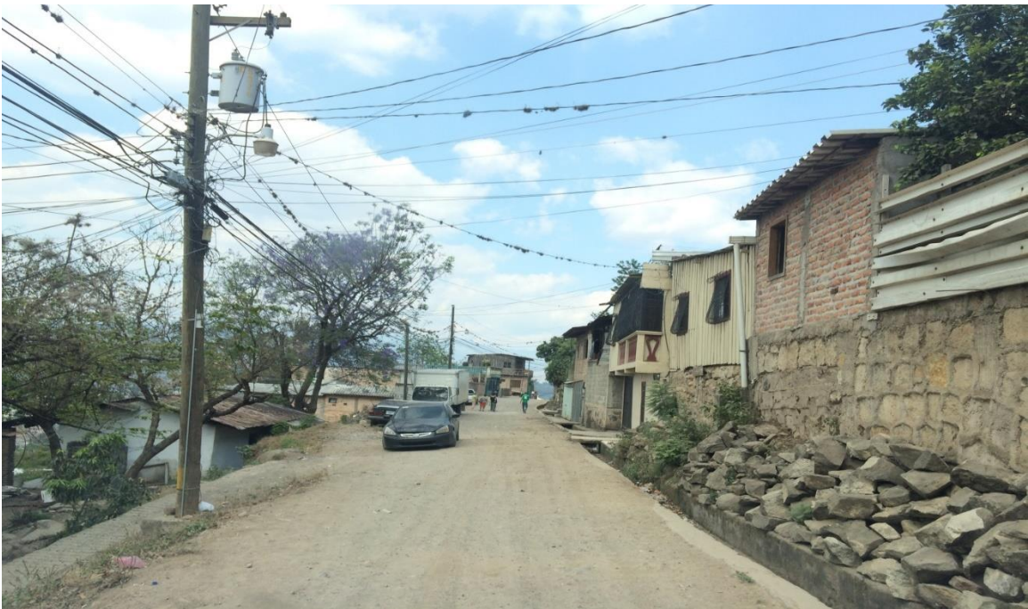
Fin de la calle a pavimentar