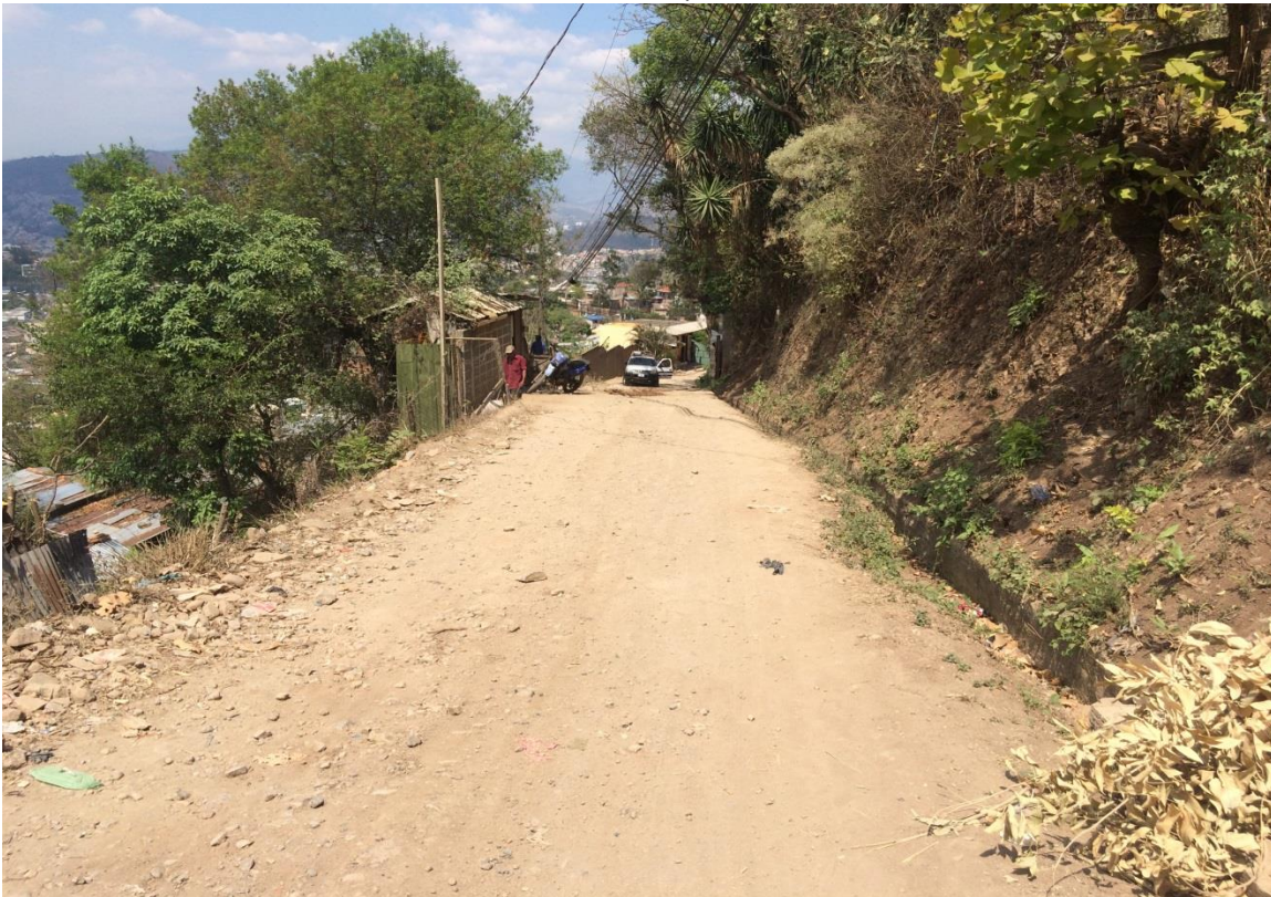
Vista de calle a pavimentar