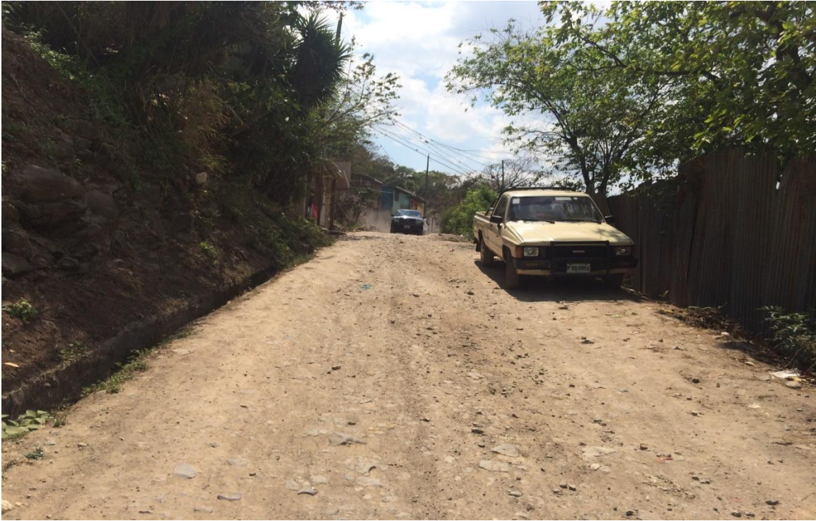
Vista de la calle

Proyecto: Pavimentación de calle con concreto hidráulico, barrio La Soledad. Código: 1157