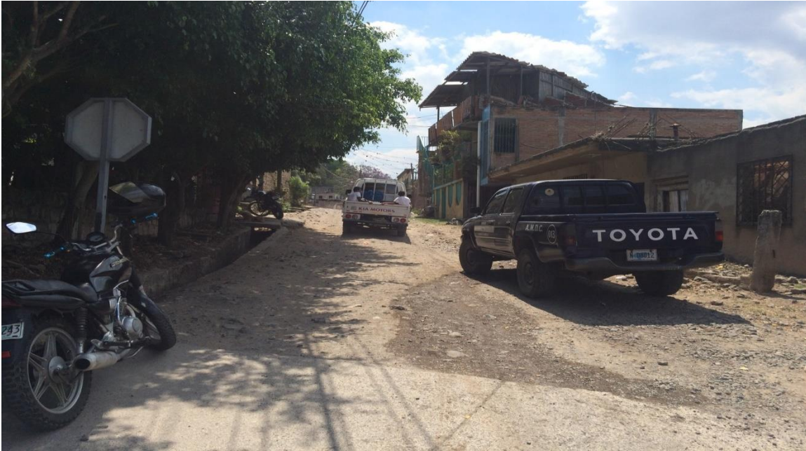
Inicio de la calle a pavimentar

Proyecto: Pavimentación de calle con concreto hidráulico, barrio La Soledad. Código: 1157