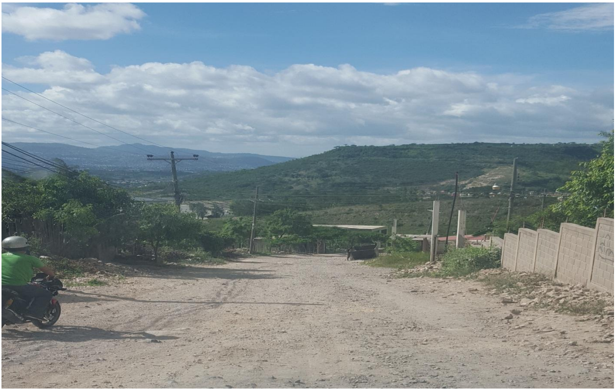
TRAMO DE CALLE A REPARAR