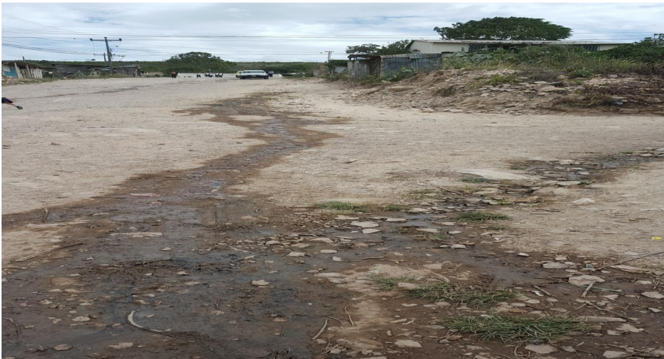
CONSTRUCCION DE CUNETAS EN COL. REYNEL FUNEZ