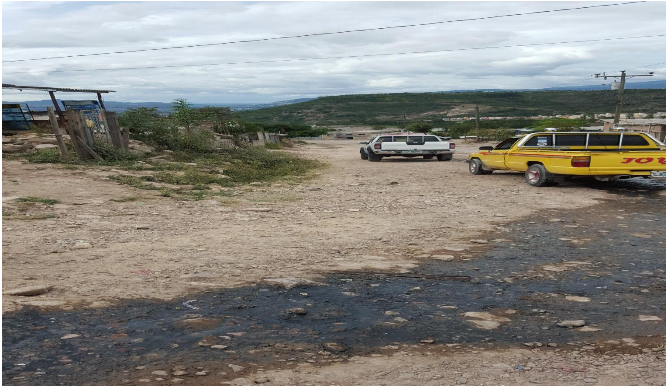
TRAMO DONDE SE CONSTRUIRAN LAS CUNETAS