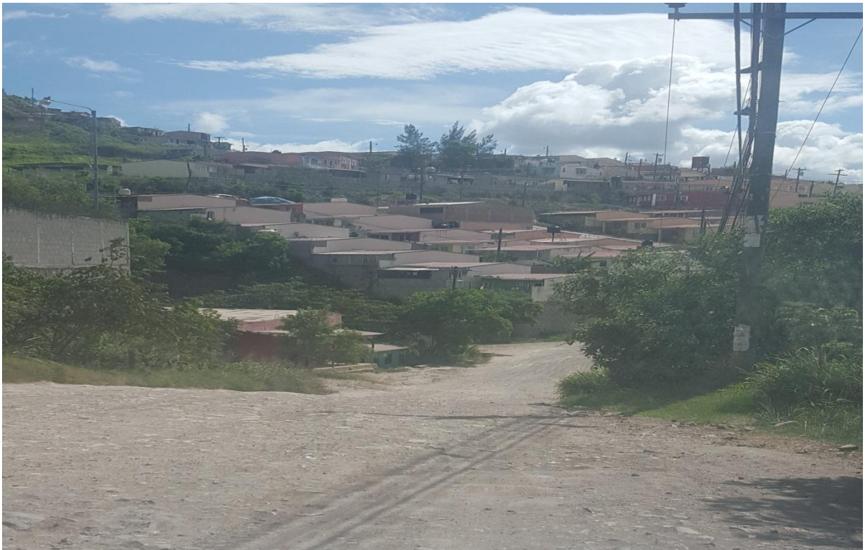
VISTA PANORAMICA DE CALLE A REPARAR