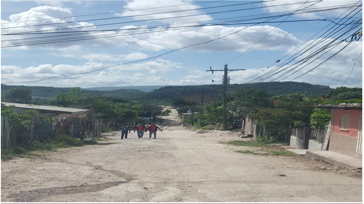
REPARACION DE CALLE COL. REYNEL FUNEZ