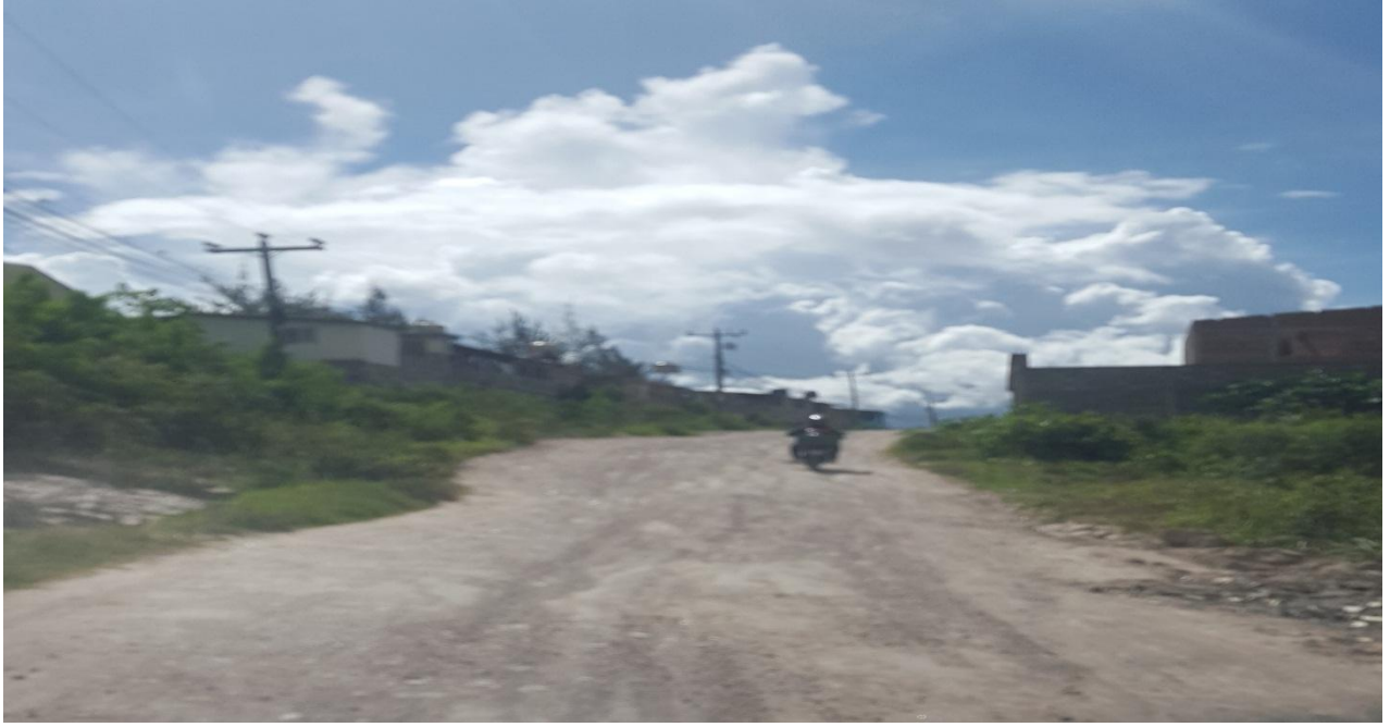
INICIO DE PROYECTO DE CONFORMACION Y BALASTADO