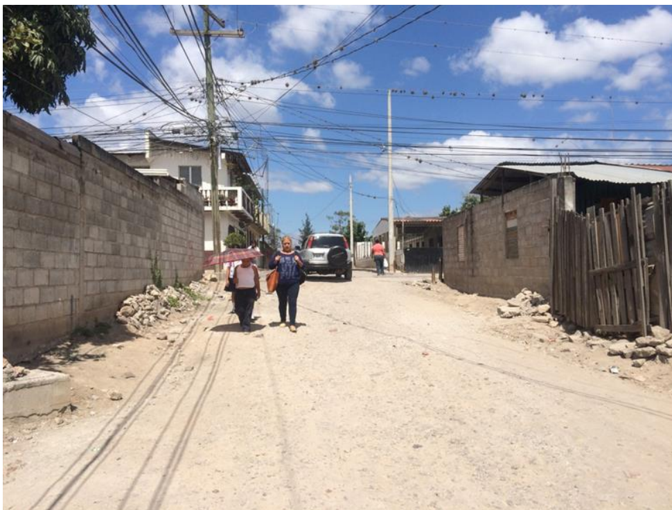
TRAMO A PAVIMENTAR CON CONCRETO HIDRÁULICO