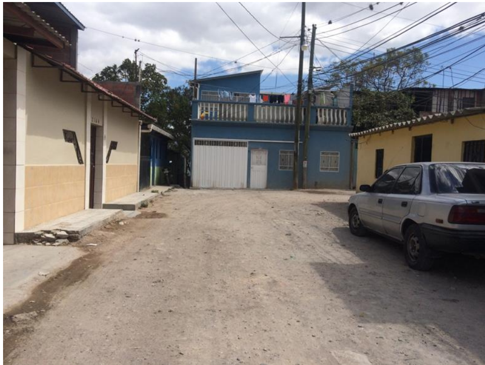
PANORAMA DE LA CALLE A PAVIMENTAR

Proyecto: Pavimentación de calle con concreto hidráulico, col. Flor del Campo, Zona 2 Código: 1635