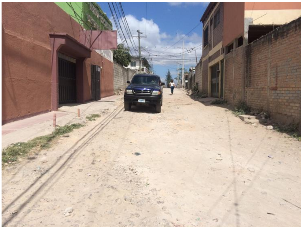
VISTA DE TRAMO A PAVIMENTAR CON CONCRETO HIDRÁULICO