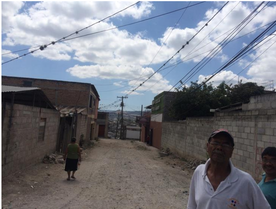
INICIO DE TRAMO A PAVIMENTAR CON CONCRETO HIDRÁULICO

Proyecto: Pavimentación de calle con concreto hidráulico, col. Flor del Campo, Zona 2 Código: 1635