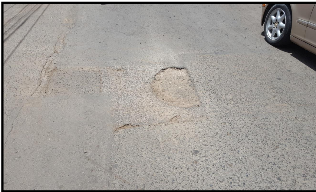
VISTA DEL TRAMO EN MAL ESTADO DE LAS CALLES