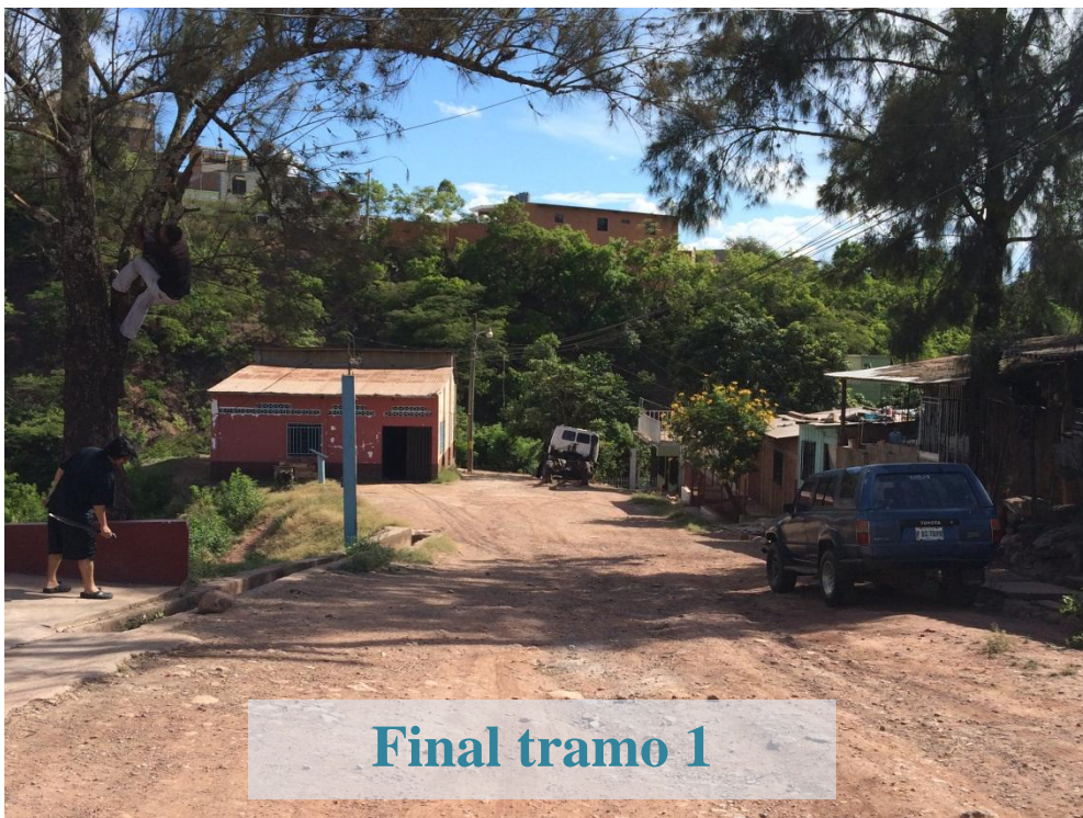
Final tramo 1