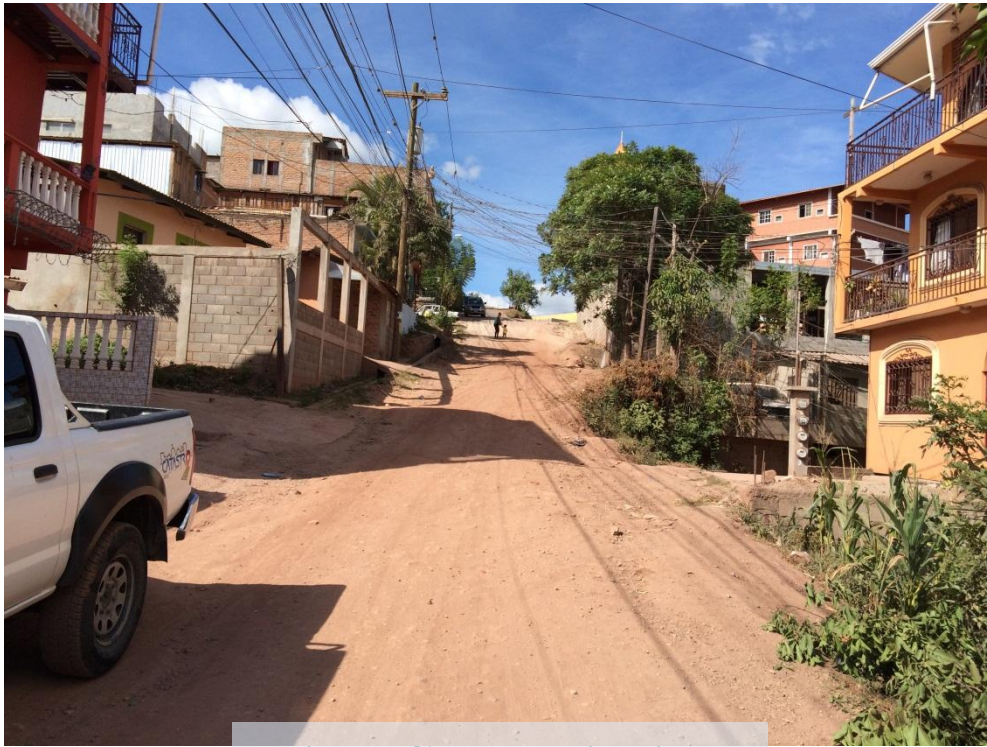
Vista Calle Principal