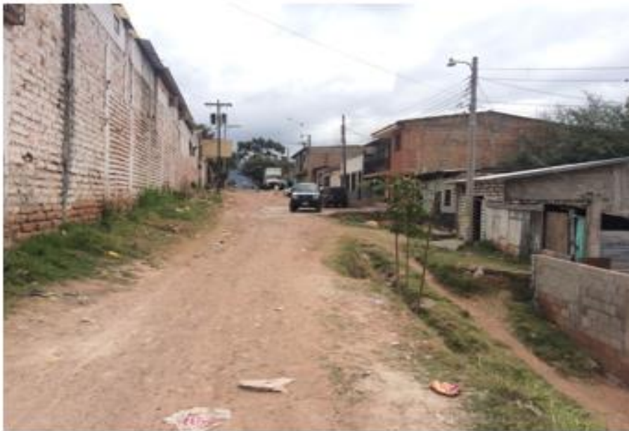
VISTA GENERAL DE LA CALLE DONDE OBSERVA EL SITIO DONDE FINALIZA EL MURO DE CONTENCIÓN Y GRADAS