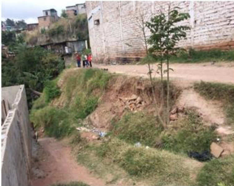
CONDICIONES ACTUALES DE LA CALLE EN LA ZONA DONDE CONSTRUIRÁ MURO DE CONTENCIÓN PARA RETENCIÓN DEL TALUD Y AMPLIACIÓN DE LA CALLE