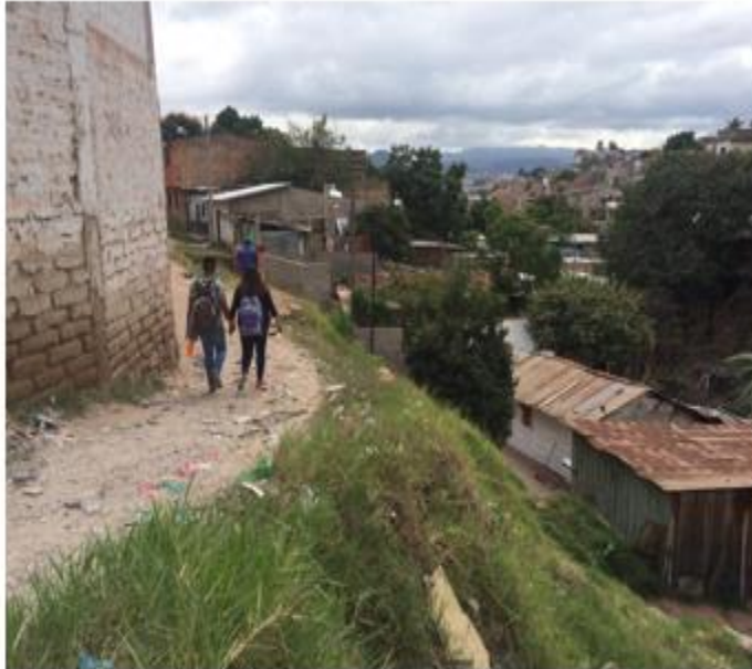
CONDICIONES ACTUALES DE CALLE Y TALUD EN EL SITIO DONDE CONSTRUIRÁ MURO CON ALTURA DE 6.00 M