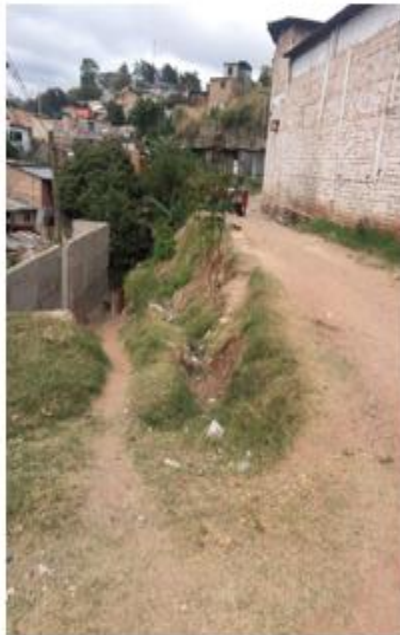
VISTA GENERAL DE LA CALLE EN LA ZONA DONDE SE COSTRUIRÁ MURO PARA PODER AMPLIAR EL ANCHO DE LA CALLE Y GRADAS DE ACCESO EN CALLEJÓN QUE DA ACCESO A LAS VIVIENDAS UBICADAS FRENTE AL MURO A CONSTRUIR.