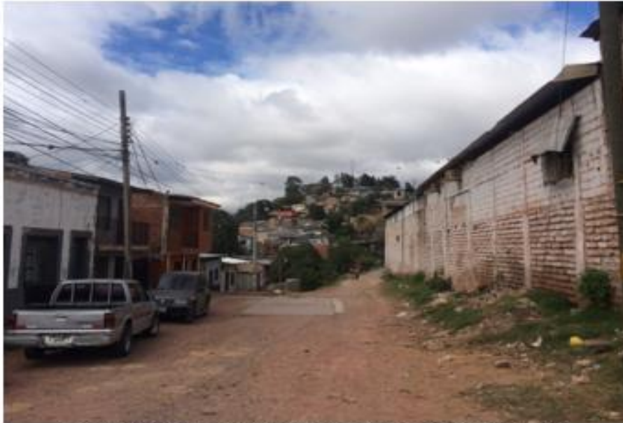
CONDICIONES ACTUALES DE LA CALLE A PAVIMENTAR