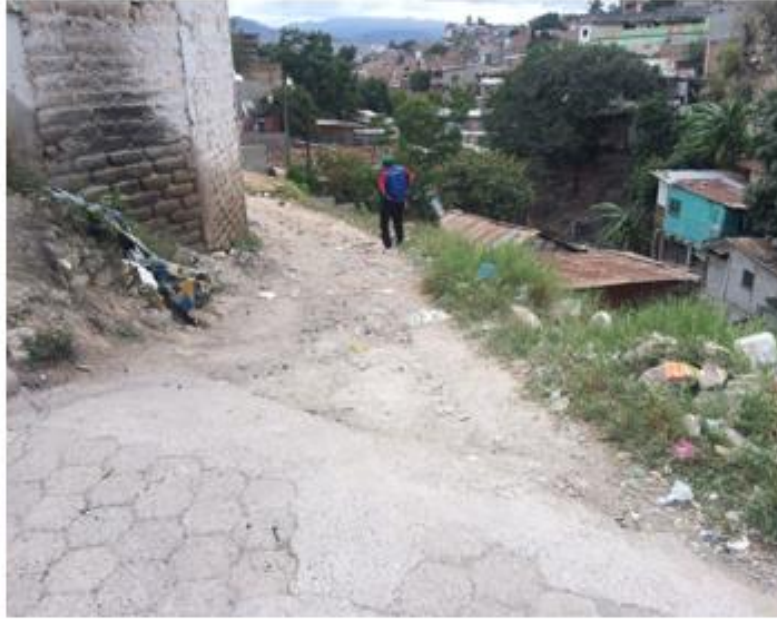
INICIO DE LA PAVIMENTACIÓN QUE SE CONECTARÁ A ADOQUINADO EXISTENTE