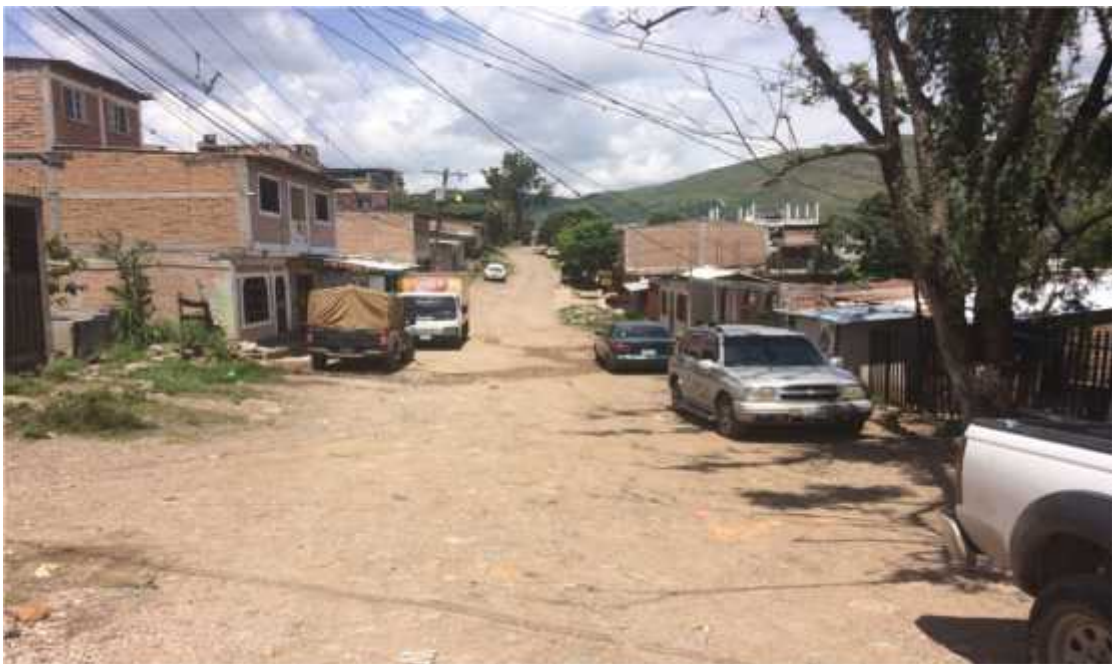
VISTA PANORAMICA DE UNA DE LAS CALLES A PAVIMENTAR