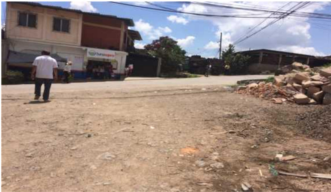
INICIO DE PAVIMENTACION DE CALLE