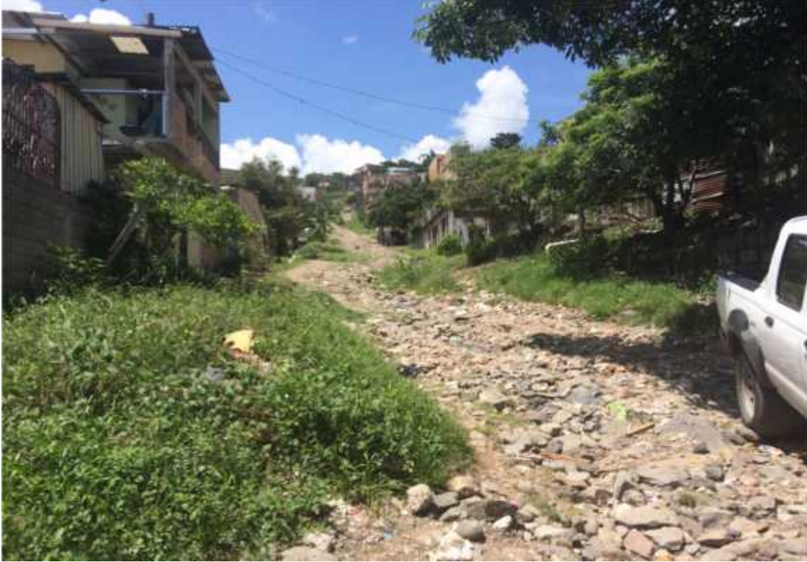
TRAMO DE CALLE INTRANSITABLE