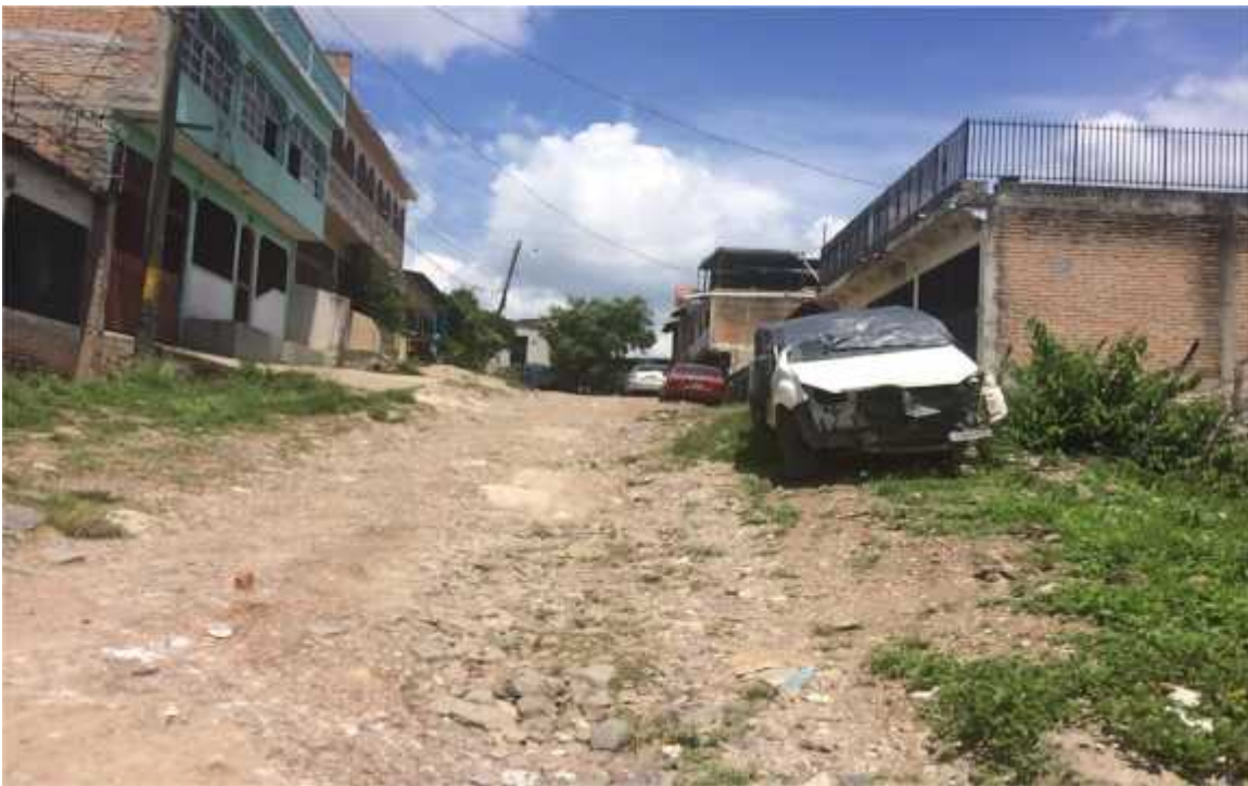
FINAL DE CALLE A PAVIMENTAR