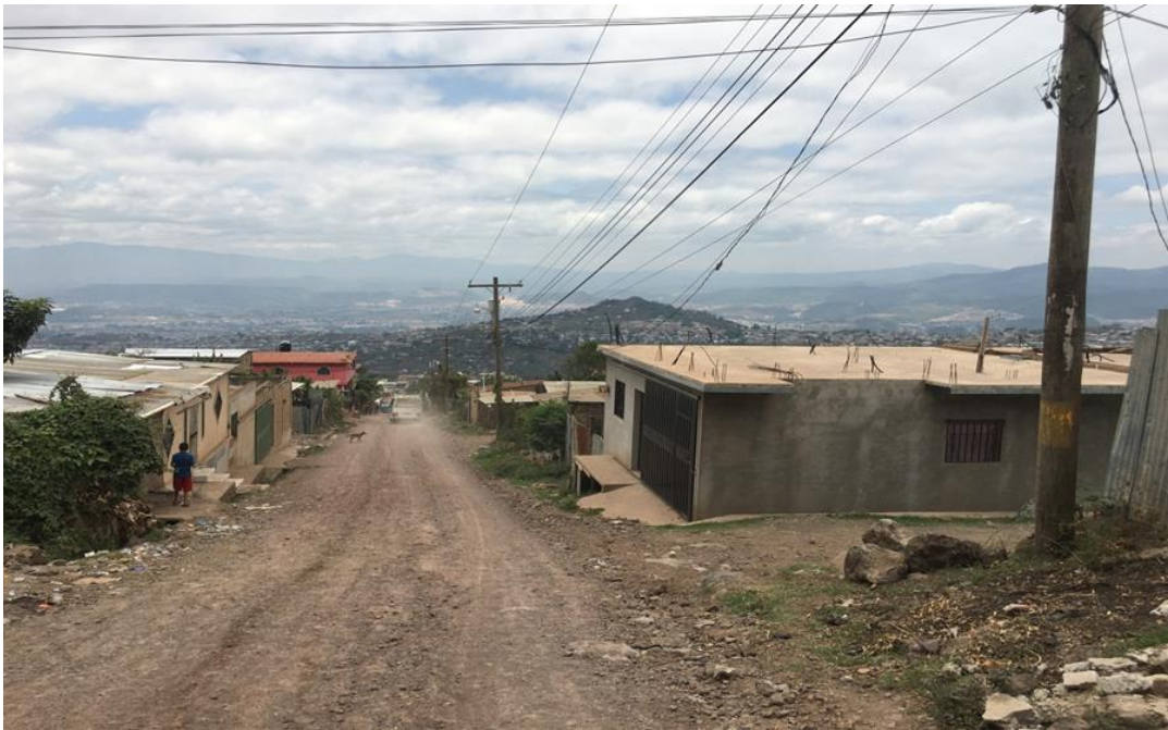
Inicio del proyecto