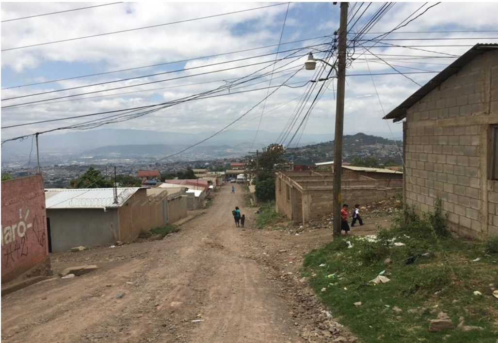
Vista panorámica de calle de proyecto