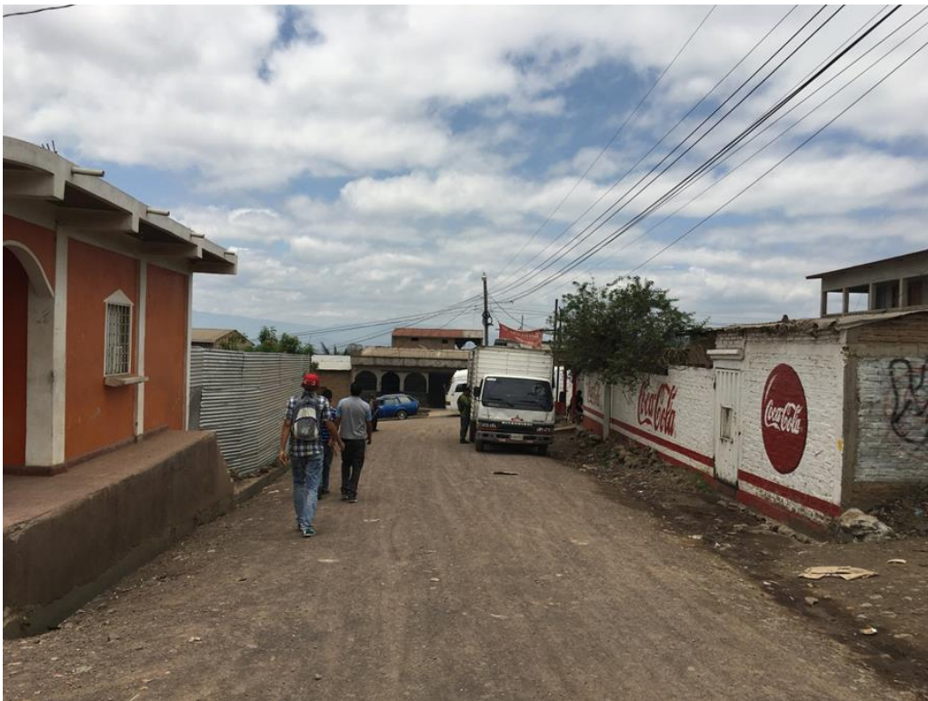
Final del proyecto