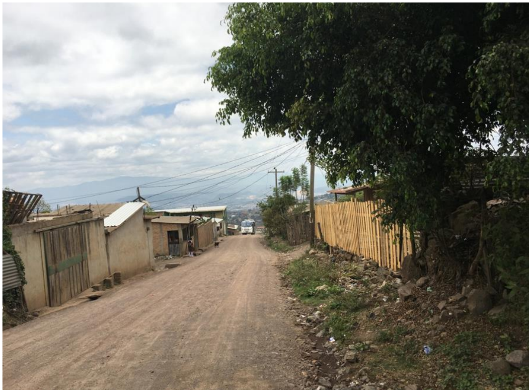
Tramo a reparar con huellas vehiculares