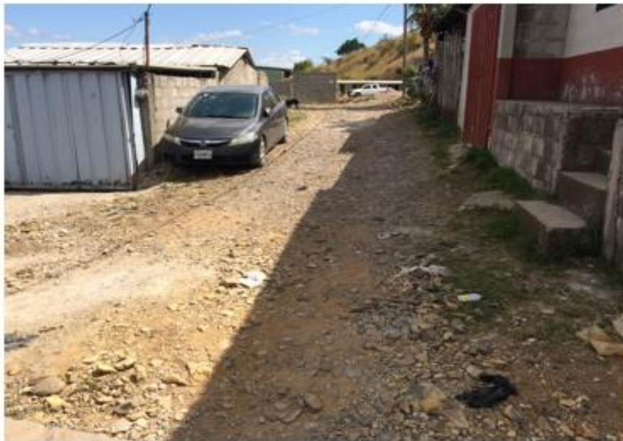
PANORÁMA DE LA CALLE A PAVIMENTAR