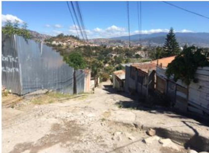
CALLE A PAVIMENTAR CON CONCRETO HIDRÁULICO