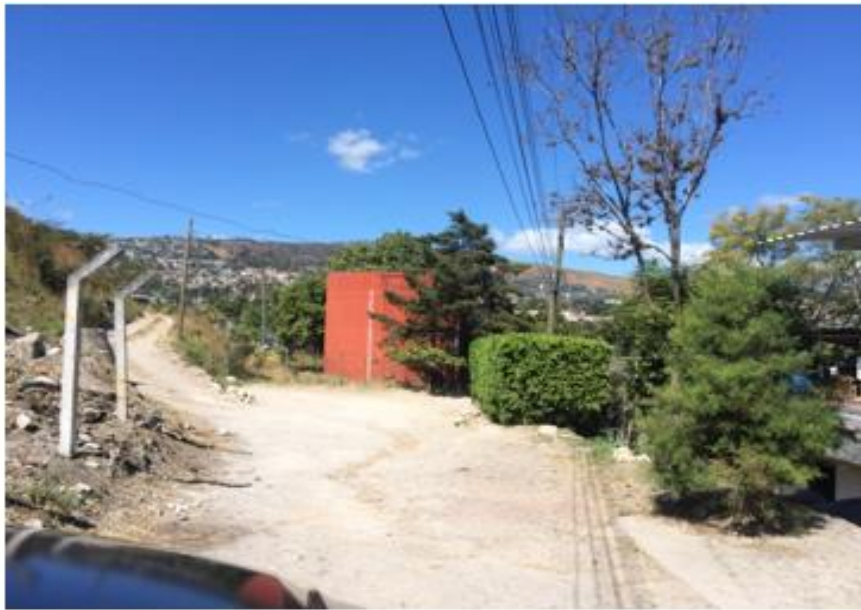
PANORÁMA DE LA CALLE A PAVIMENTAR