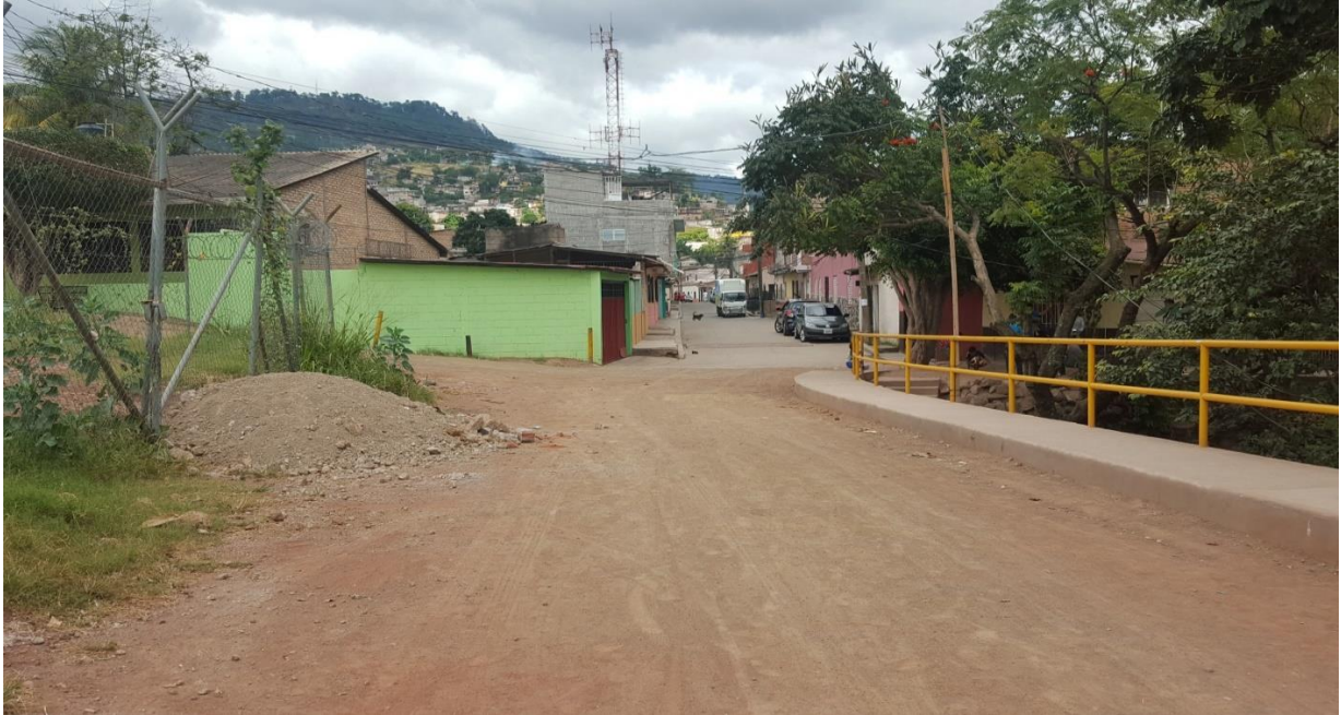
Vista panorámica de calle a reparar

Proyecto: Pavimentación de calle con concreto hidráulico, barrio El Manchen (atrás de gasolinera Uno) Código: 1081