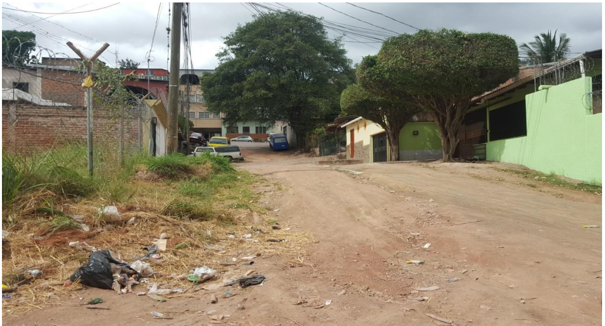
Vista del final del tramo