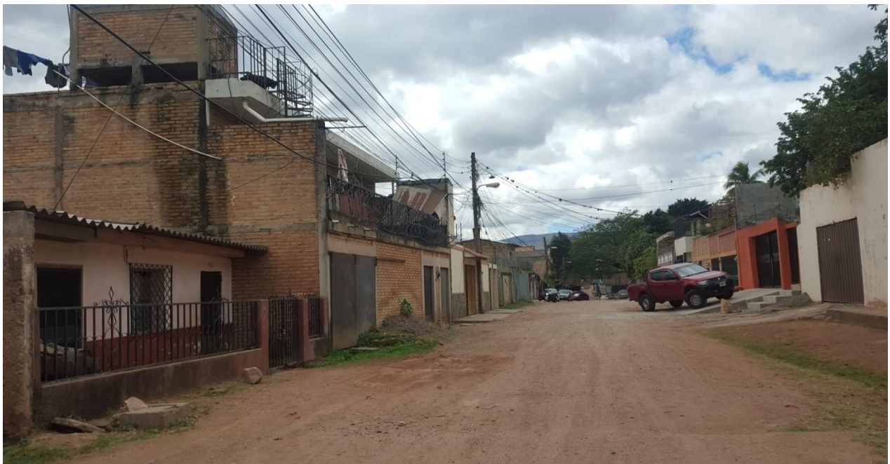
Vista del tramo a reparar