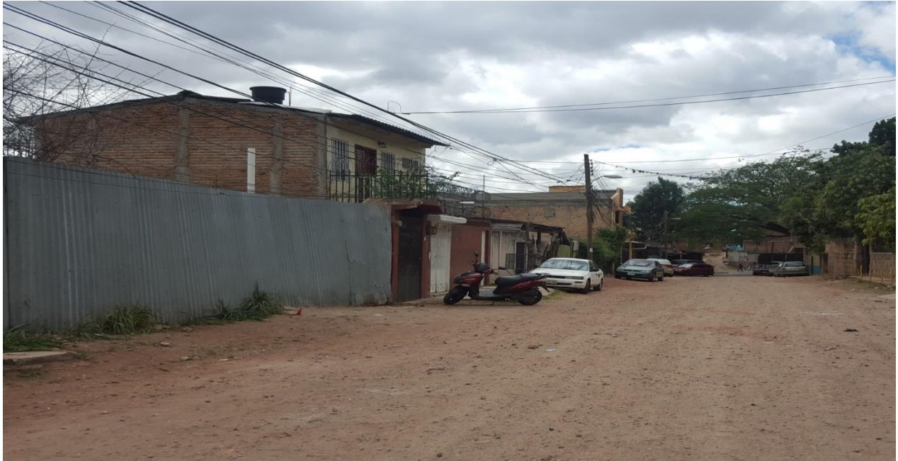
Vista del inicio del tramo a reparar

Proyecto: Pavimentación de calle con concreto hidráulico, barrio El Manchen (atrás de gasolinera Uno) Código: 1081