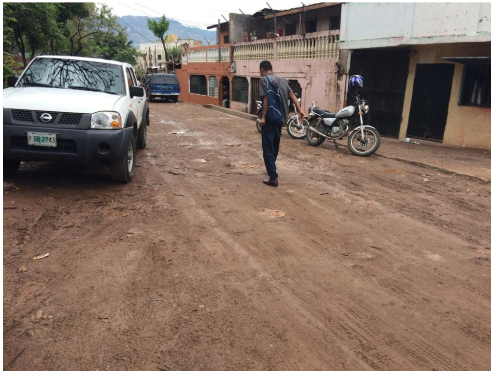
INICIO DE CALLE A PAVIEMENAR