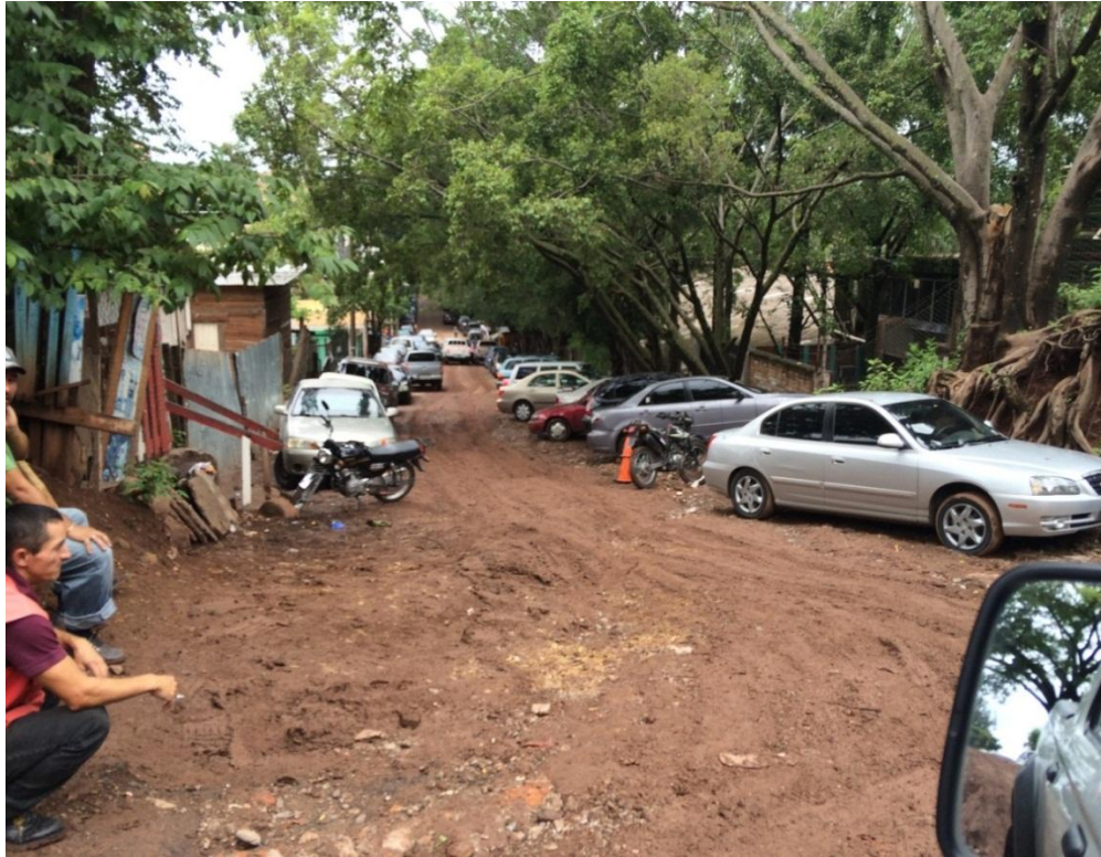
TRAMO DE CALLE A PAVIMENTAR