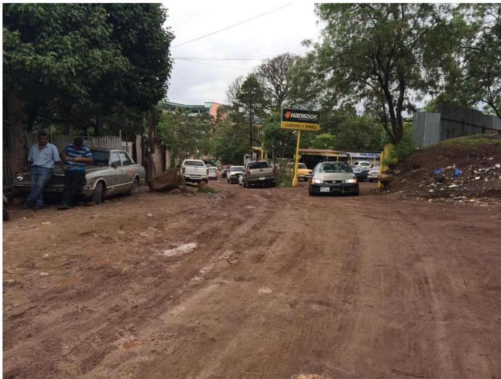
CALLE A PAVIMENTAR