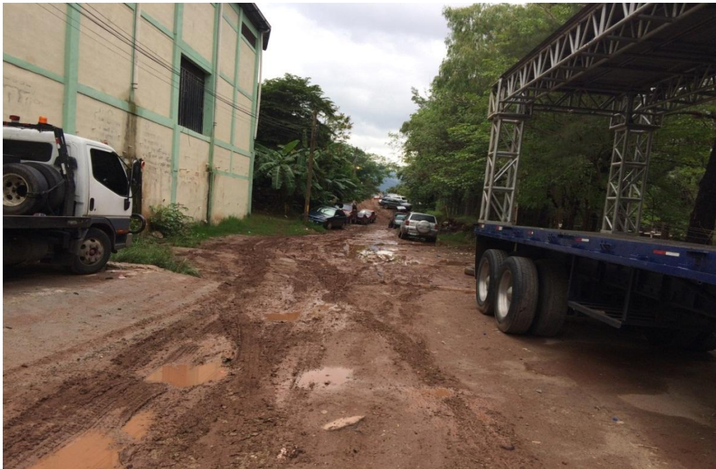
VISTA PANORAMICA DE CALLE DE COL. ALTAMIRA