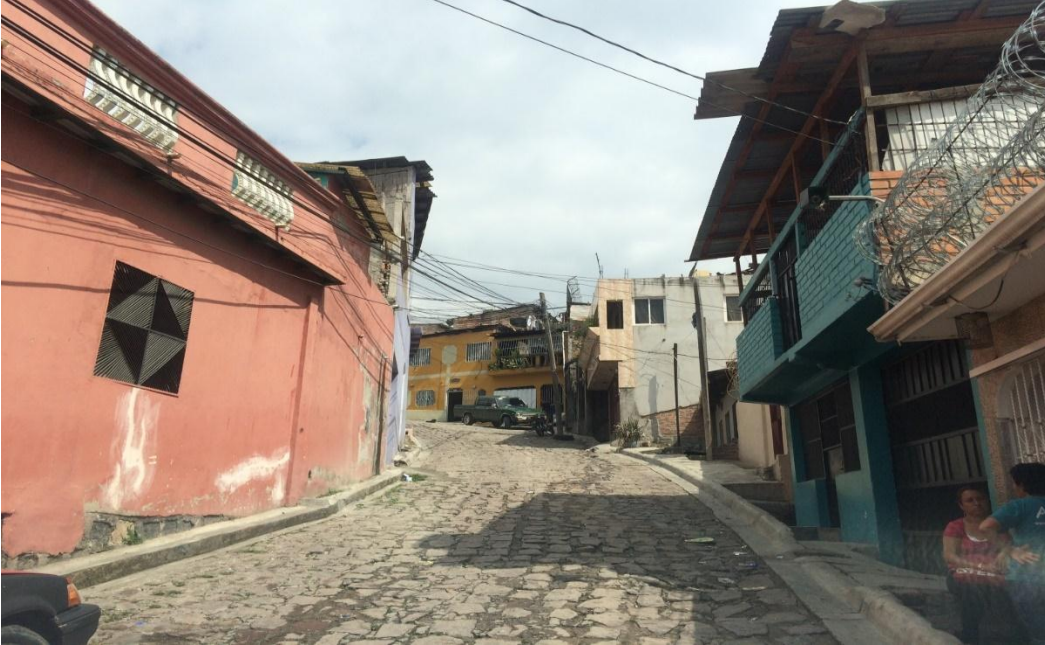
Vista de la sección de la calle empedrada

Proyecto: Pavimentación de calle con white topping, col. Policarpo Paz García Código: 1130