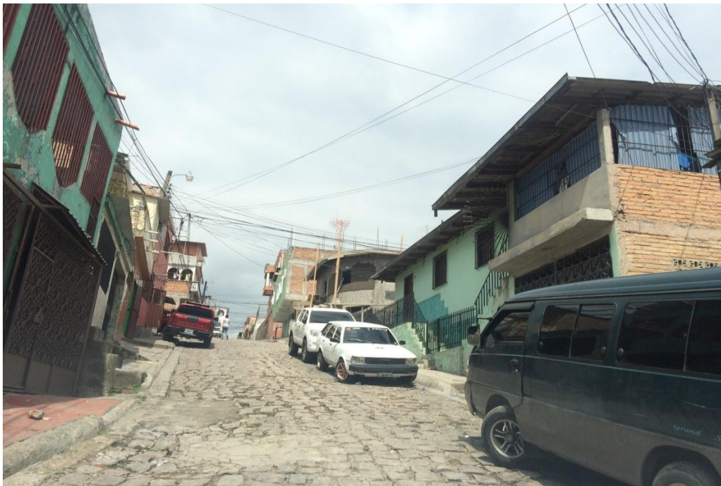
Calle empedrada a pavimentar