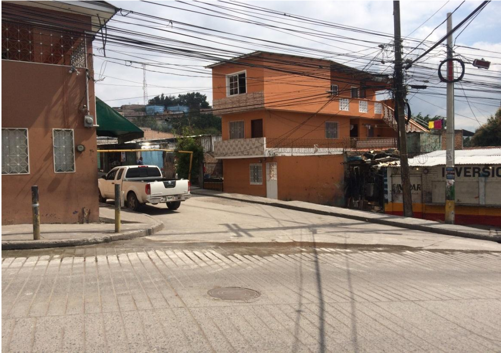
Inicio de la calle a pavimentar

Proyecto: Pavimentación de calle con white topping, col. Policarpo Paz García Código: 1130