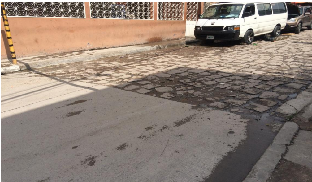
Calle a pavimentar