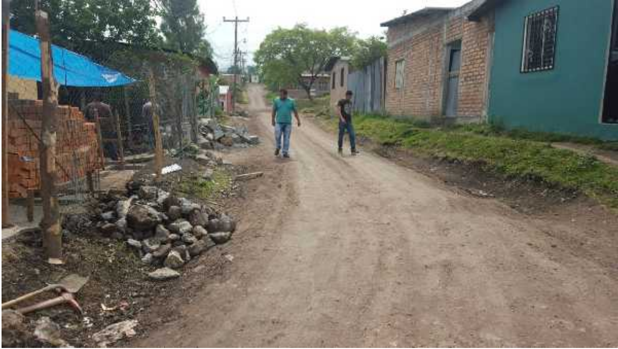
Condiciones actuales de la calle