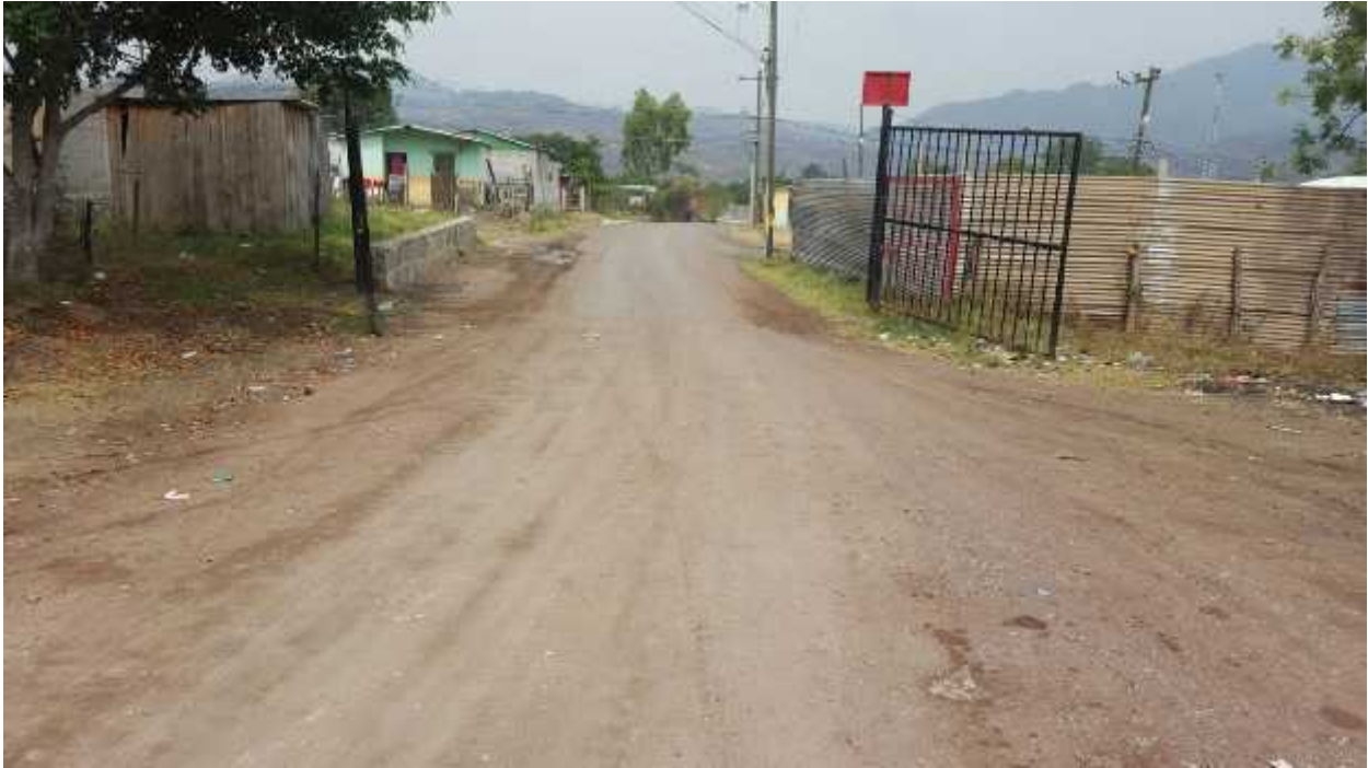
Inicio del pavimento

Pavimentación de calle con concreto hidráulico, col. Villa Peniel Código 1094