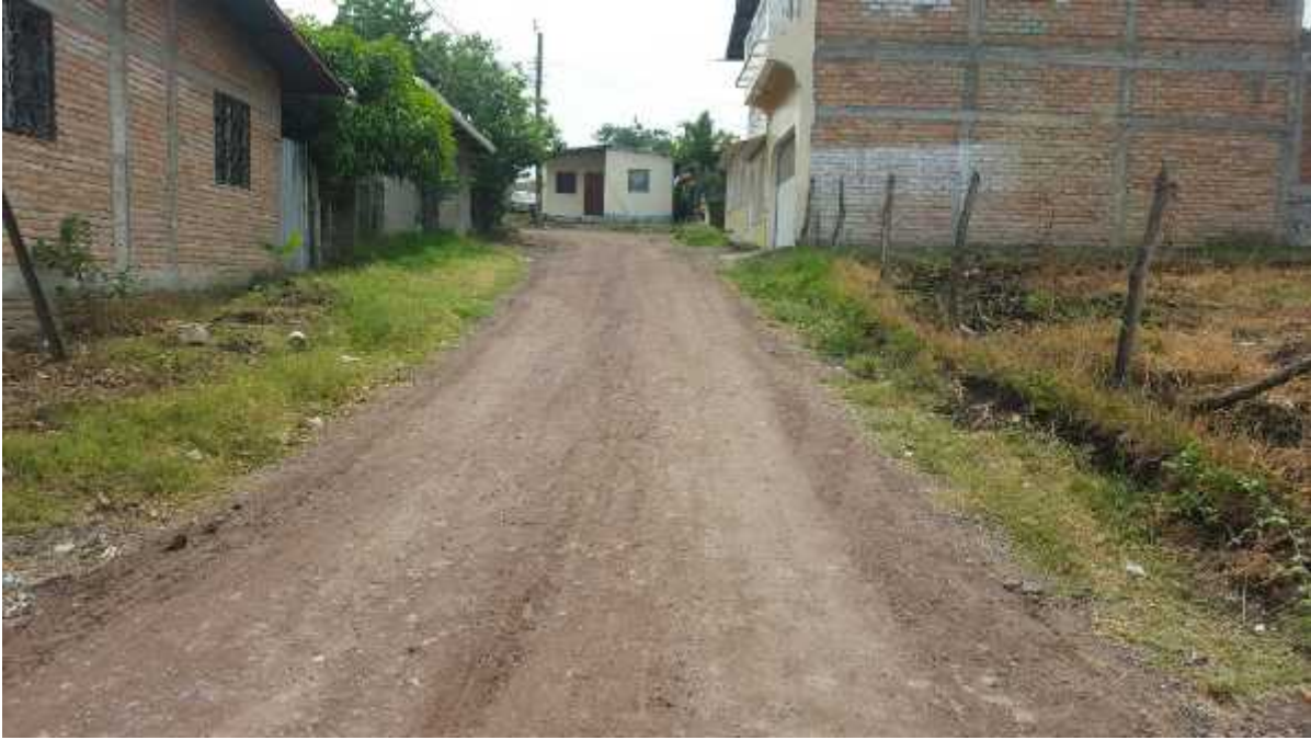
Fin de pavimento