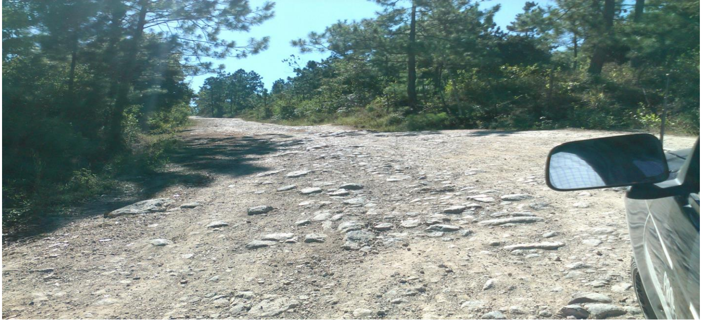
Otra vista panorámica del tramo a reparar