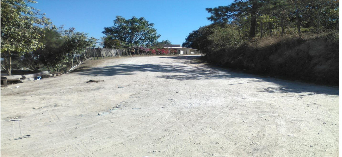
Inicio de tramo a reparar