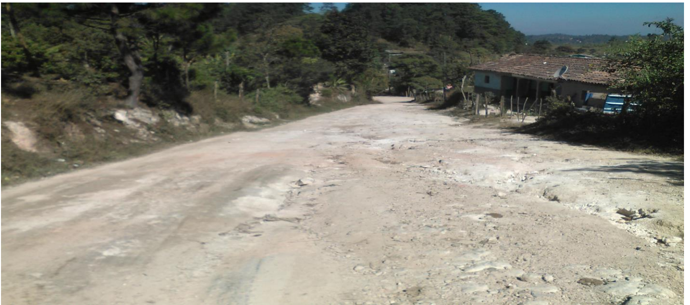
Vista panorámica de calle a reparar