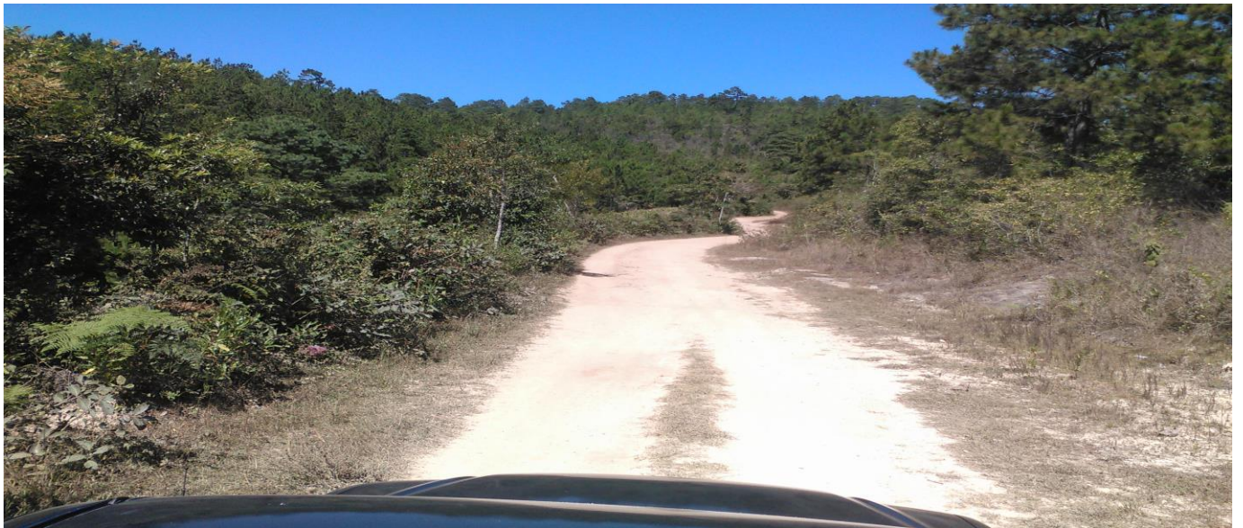
Final de calle a reparar