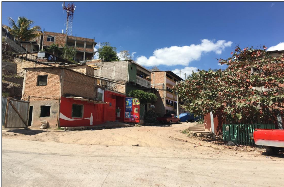
FINAL DE TRAMO A PAVIMENTAR CON CONCRETO HIDRÁULICO