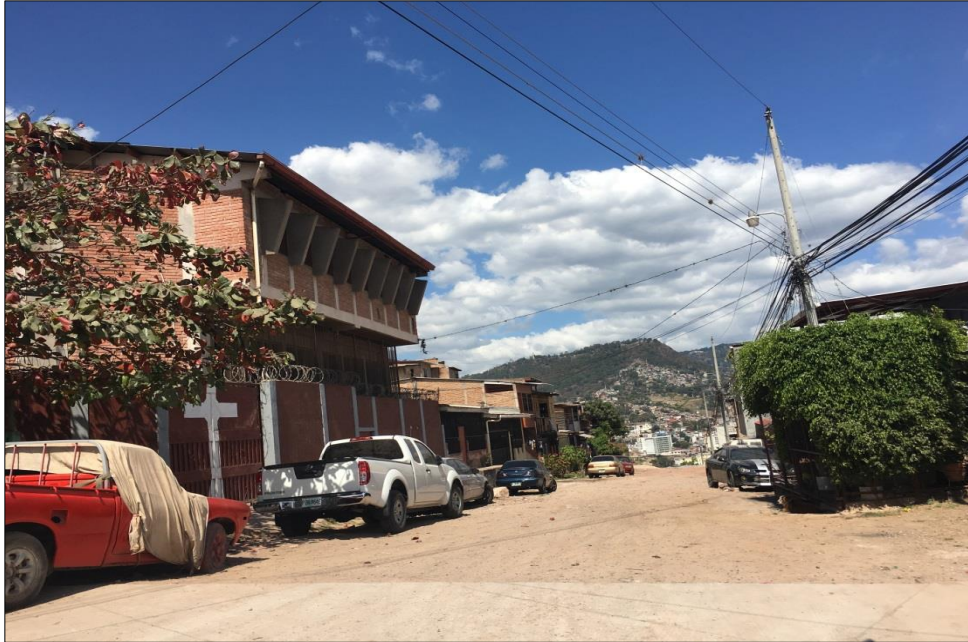
INICIO DE TRAMO A PAVIMENTAR CON CONCRETO HIDRÁULICO

Proyecto: Pavimentación de calle con concreto hidráulico, col. Bella Vista, calle frente a la iglesia Código: 1611