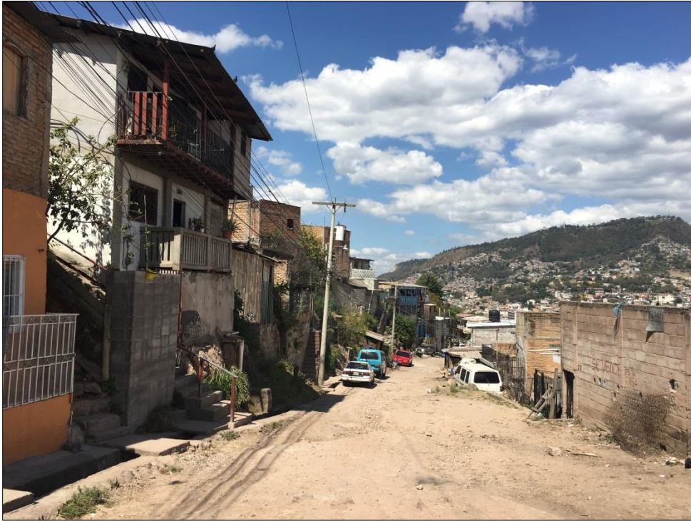
VISTA PANORÁMICA DE CALLE A PAVIMENTAR CON CONCRETO HIDRÁULICO