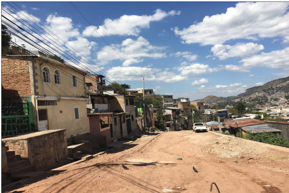
VISTA PANORÁMICA DE CALLE A PAVIMENTAR CON CONCRETO HIDRÁULICO