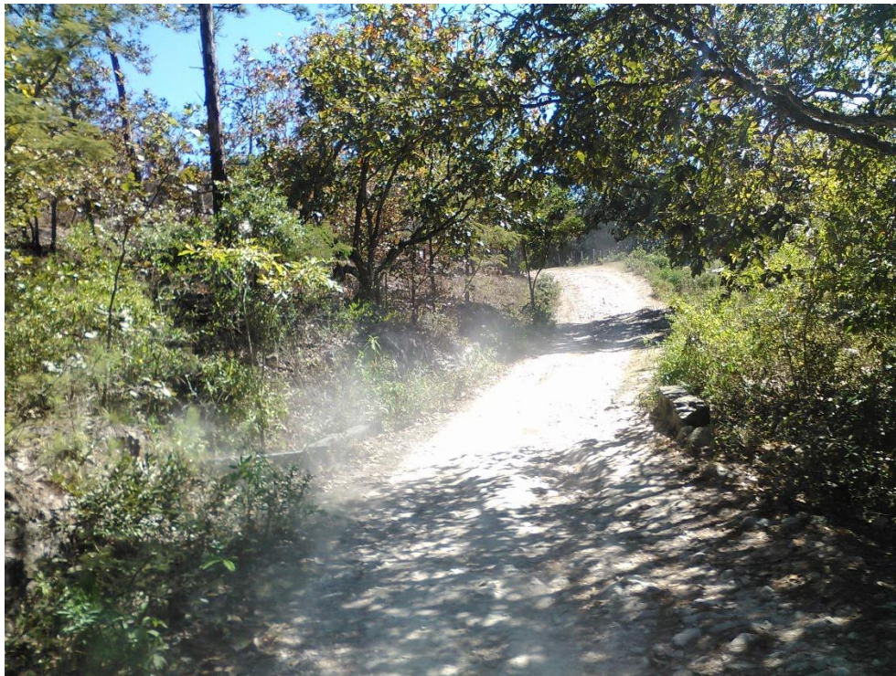
Vista panorámica del tramo a reparar