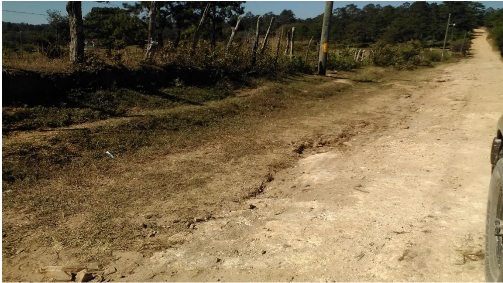
Inicio del proyecto

Proyecto: Conformación y balastado de calles de aldea Vegas del Río adelante de aldea La Calera Código: 1160