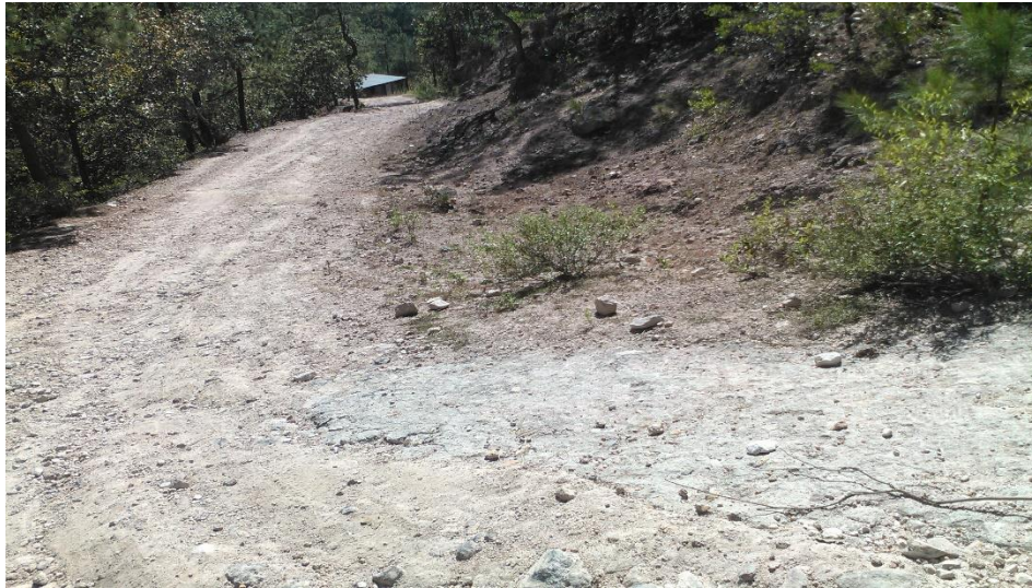
Vista del mal estado del acceso a aldea el Vegas del Río