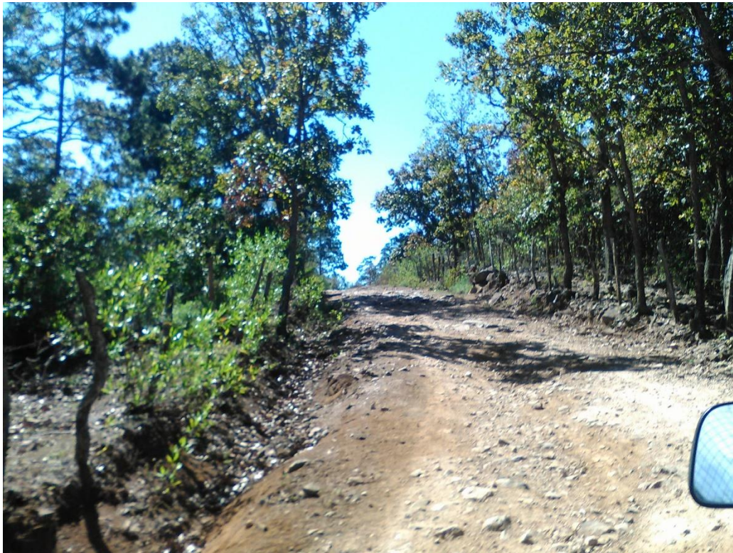
Vista panorámica del tramo a reparar