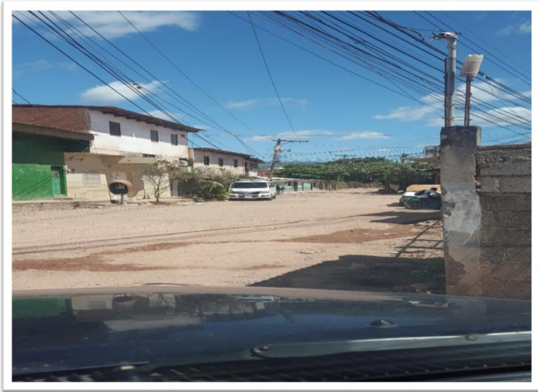
VISTA DEL FINAL DEL TRAMO A PAVIMENTAR