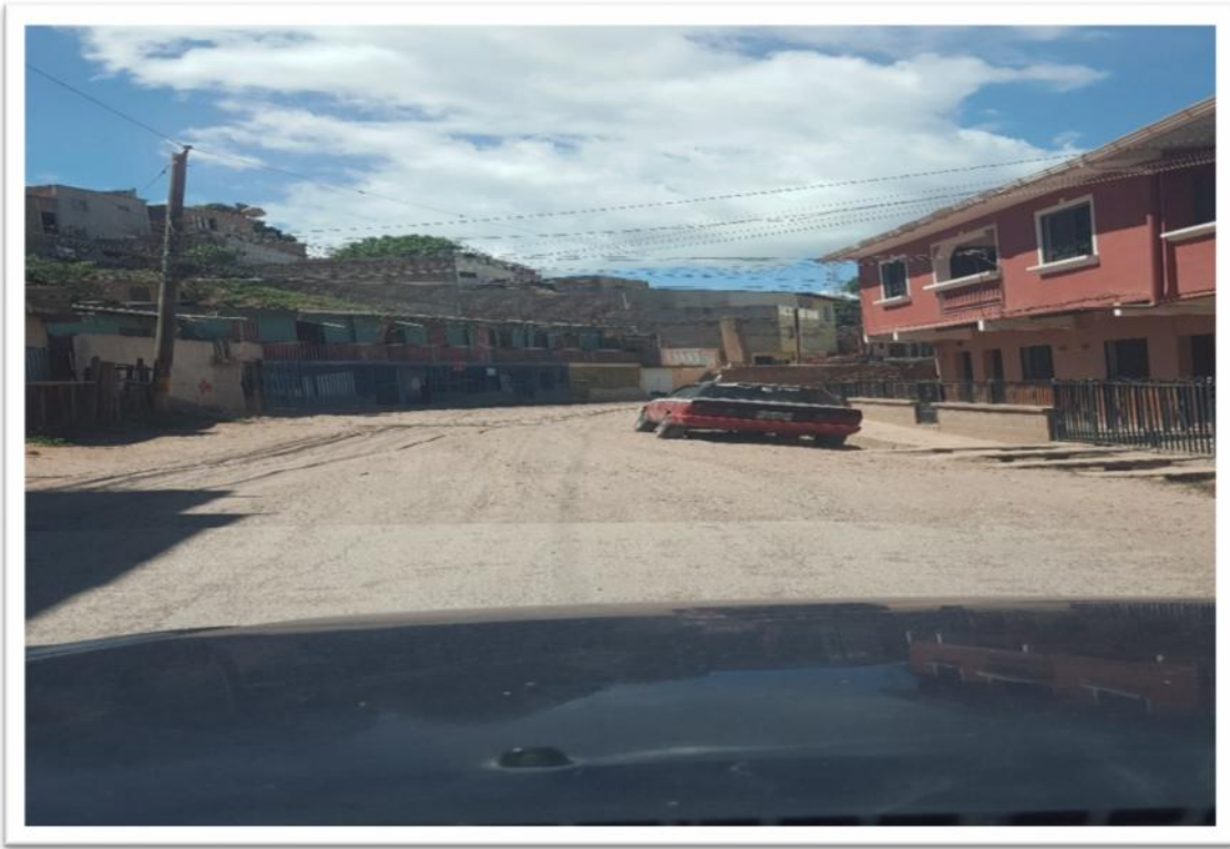
INICIO DE TRAMO A PAVIMENTAR.