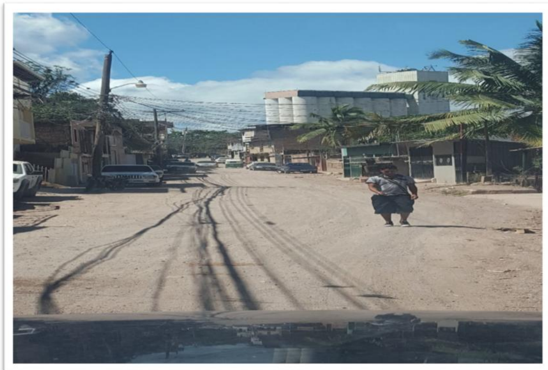
VISTA PANORAMICA DEL TRAMO A PAVIMENTAR