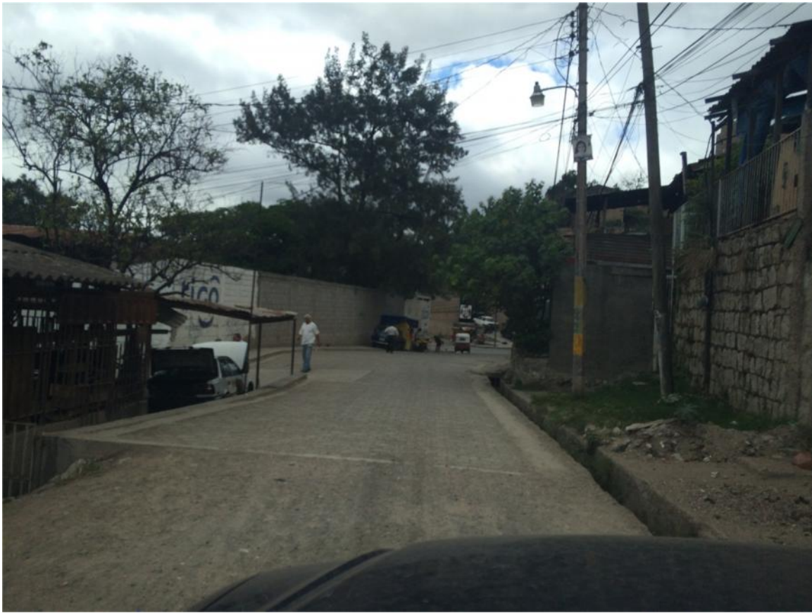
Final del proyecto a pavimentar