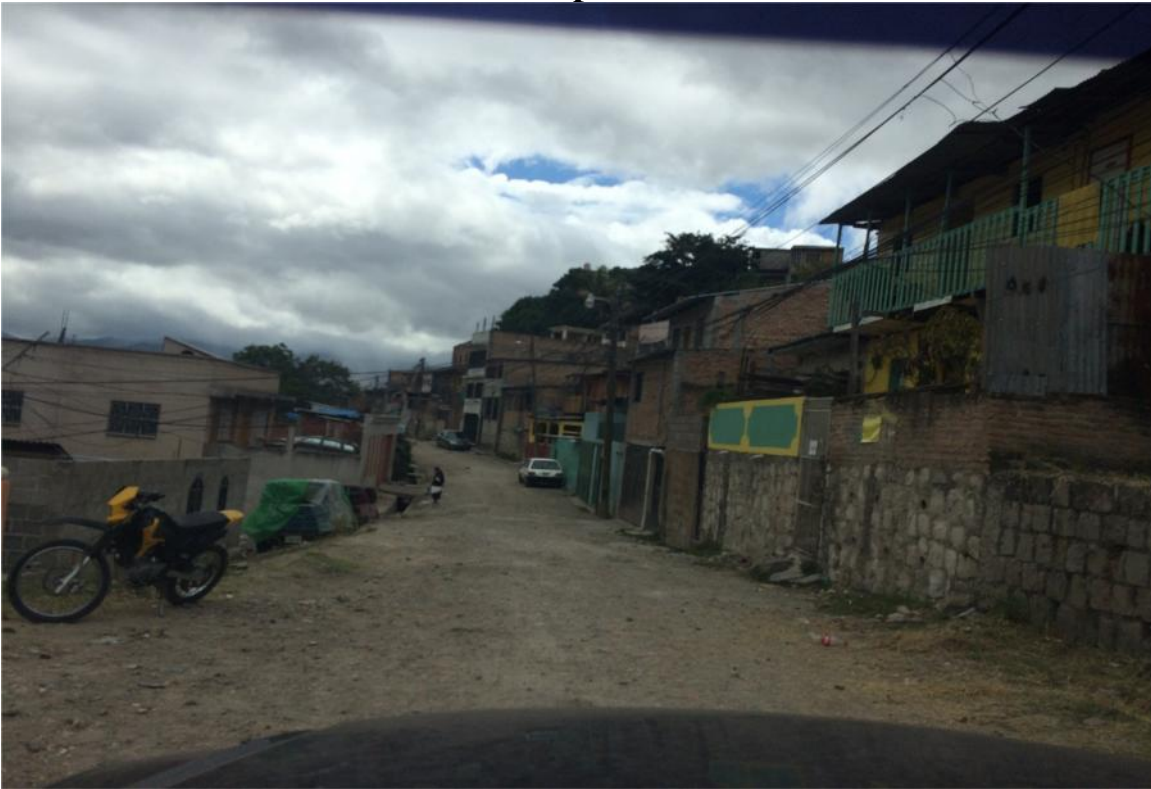
Vista panorámica de calle a pavimentar