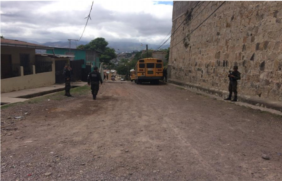
Inicio de pavimentación de calle