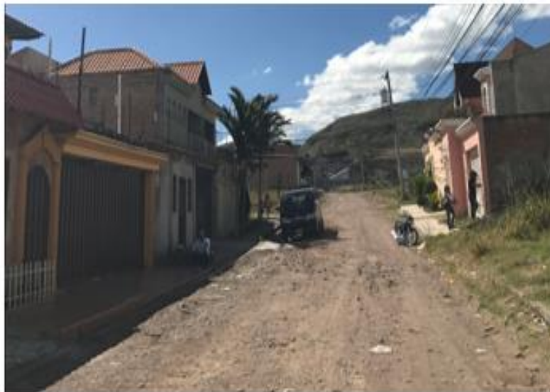
CALLE A PAVIMENTAR CON CONCRETO HIDRÁULICO