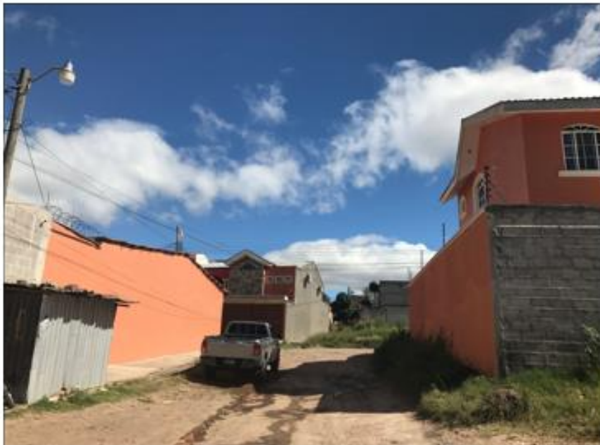
PANORÁMA DE LA CALLE A PAVIMENTAR