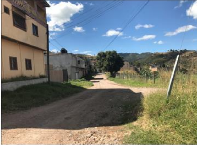
PANORÁMA DE LA CALLE A PAVIMENTAR