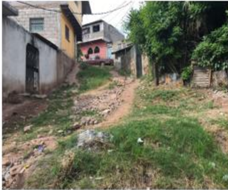
PANORÁMA DE LA CALLE A PAVIMENTAR