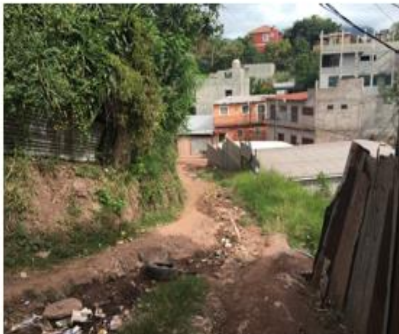
SE OBSERVA EL MAL ESTADO DE LA CALLE