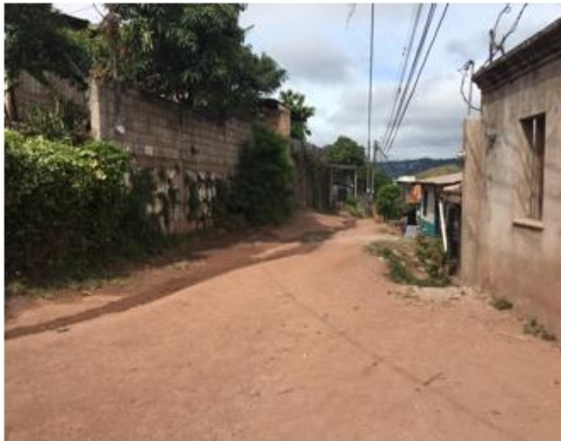
CALLE A PAVIMENTAR CON CONCRETO HIDRÁULICO