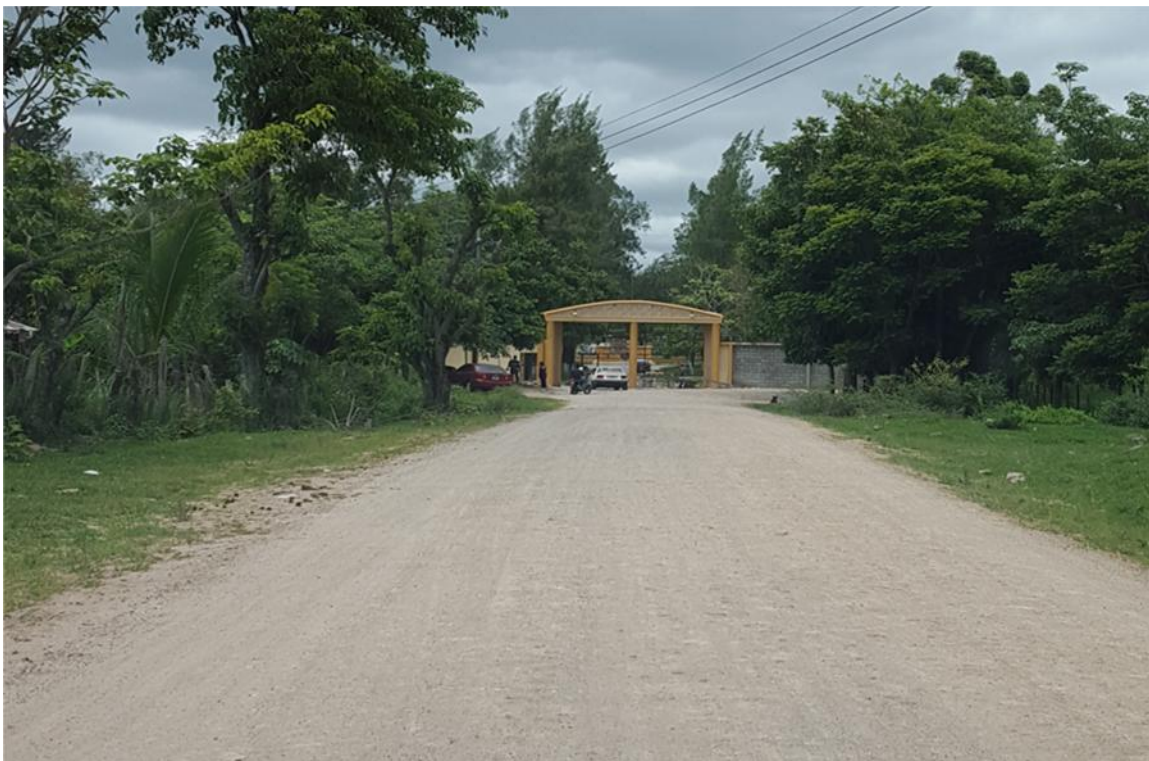
Vista panorámica de la calle a pavimentar, entrada a Hospital Santa Rosita