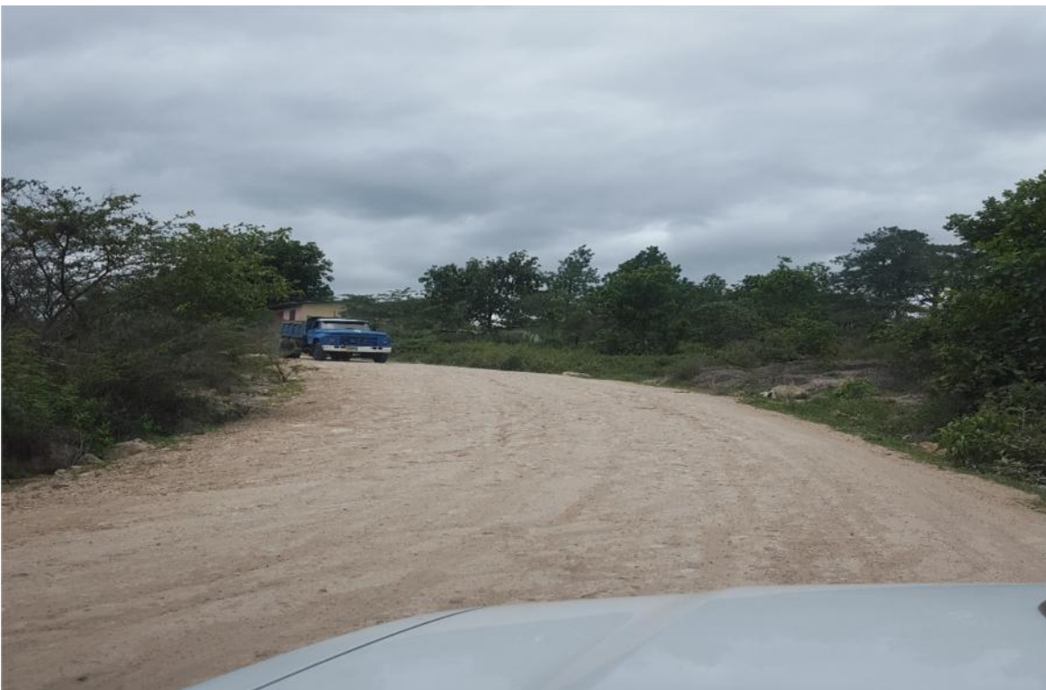
Vista del final del tramo a pavimentar