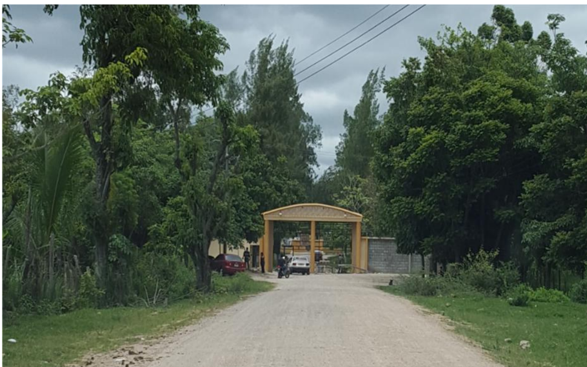
Otra vista del tramo que se pavimentará