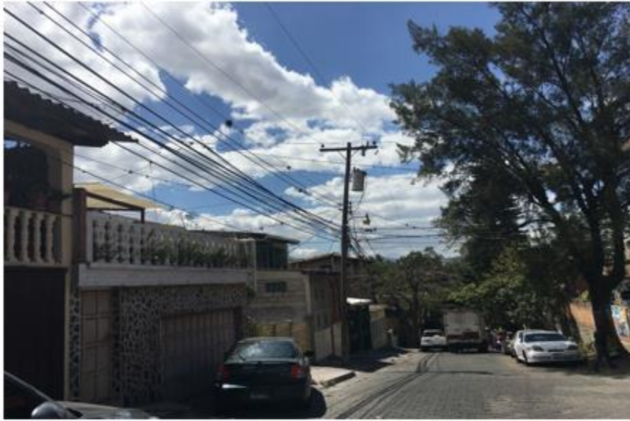
PANORÁMA DE LA CALLE A PAVIMENTAR

Proyecto: Pavimentación de calle con concreto hidráulico, colonia El Álamo Código: 1551