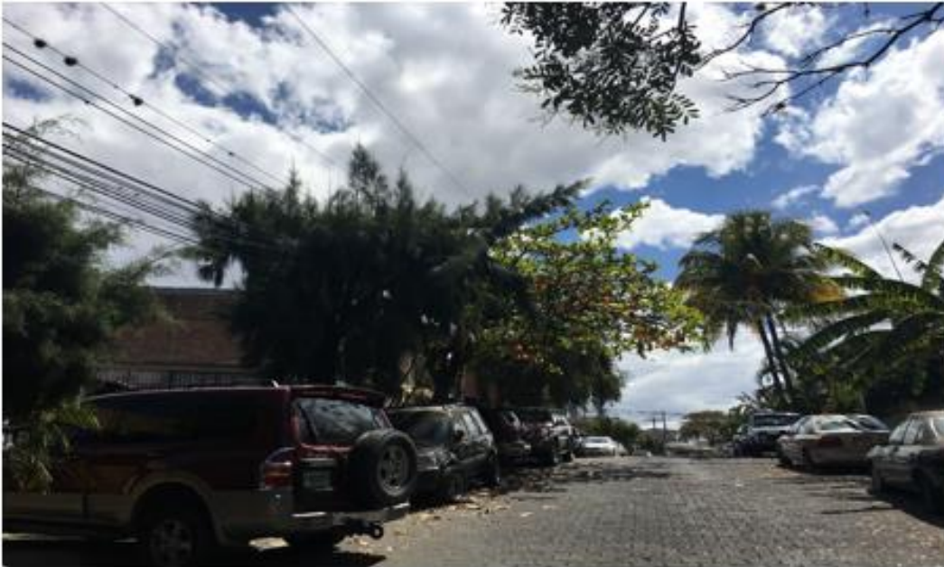
VISTA DE LA CALLE DONDE SE DESMONTARÁ EL ADOQUÍN