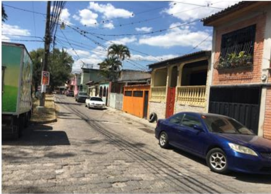
CALLE A PAVIMENTAR CON CONCRETO HIDRÁULICO

Proyecto: Pavimentación de calle con concreto hidráulico, colonia El Álamo Código: 1551