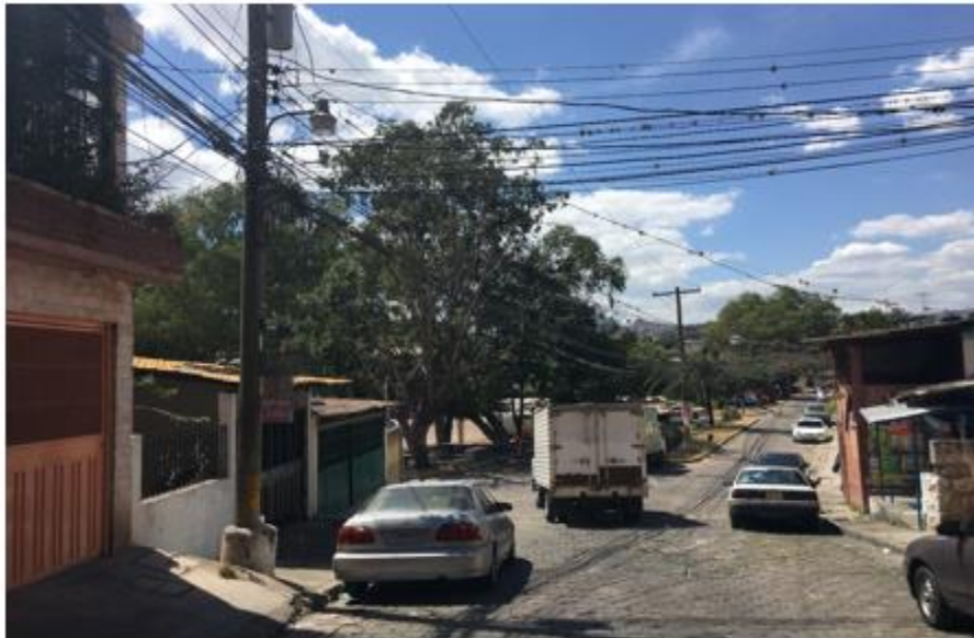
SE OBSERVA EL MAL ESTADO DEL ADOQUINADO