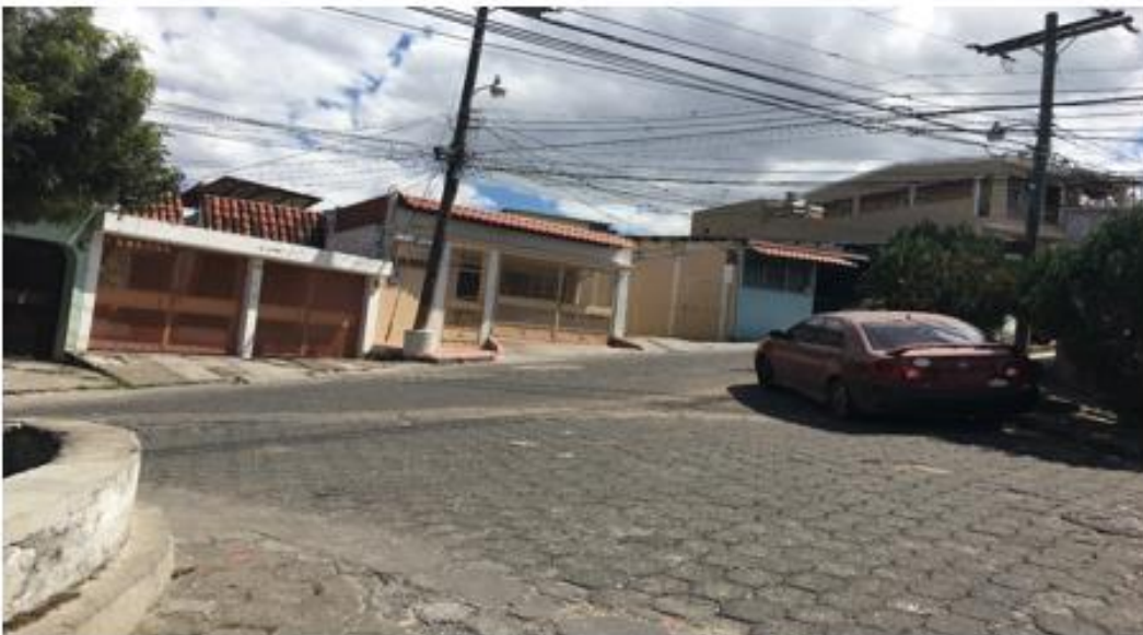
VISTA DE LA CALLE A PAVIMENTAR CON CONCRETO HIDRÁULICO