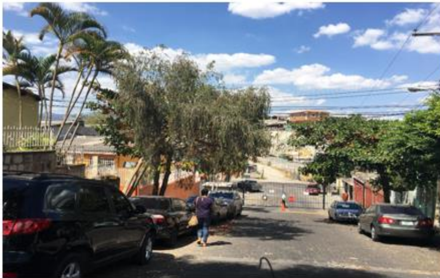
FINAL DE CALLE A PAVIMENTAR CON CONCRETO HIDRÁULICO