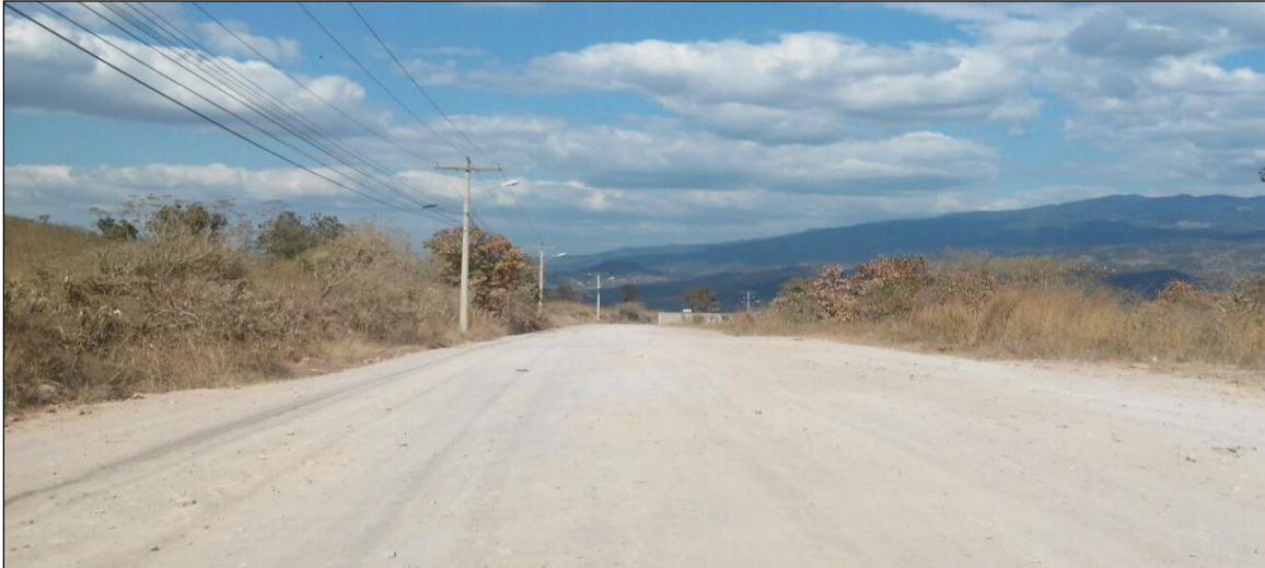
Tramo a reparar en acceso a col. Cerro grande

Proyecto: Conformación y balastado de calles acceso a Cerro Grande Zona 8-Aldea Guanabano Código: 1092