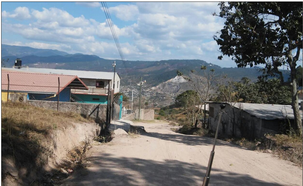
Vista del tramo donde se construirán las huellas vehiculares