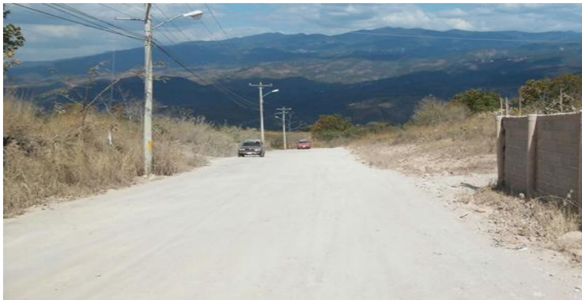
Otra vista panoramica del tramo a reparar