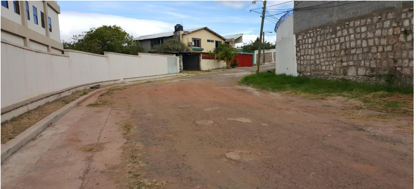
Vista panorámica de tramo a pavimentar

Proyecto: Pavimentación de calle con concreto hidráulico, col. Humuya Código: 1091