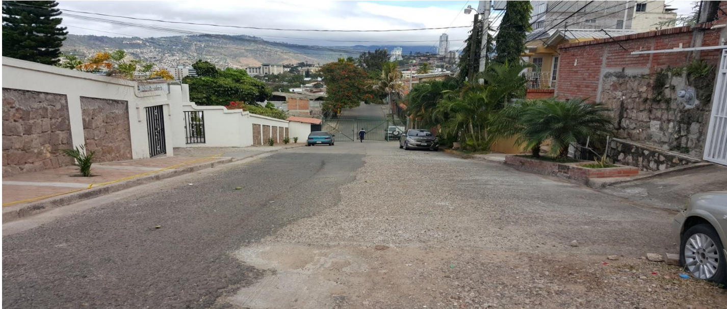
Vista del inicio de calle a pavimentar