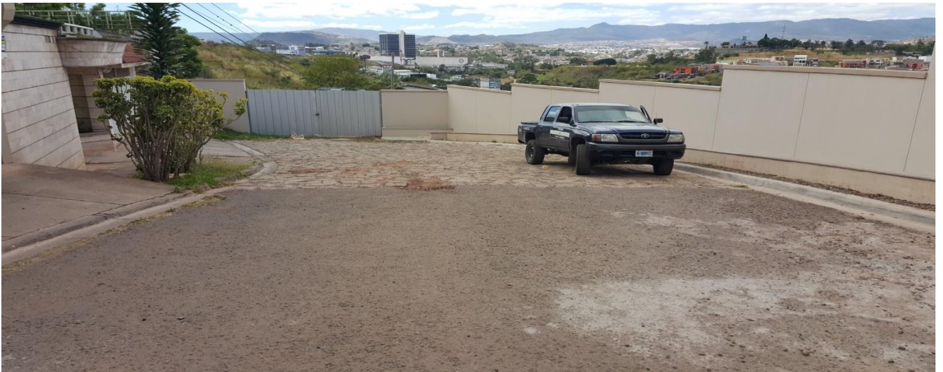
Vista del final de la calle