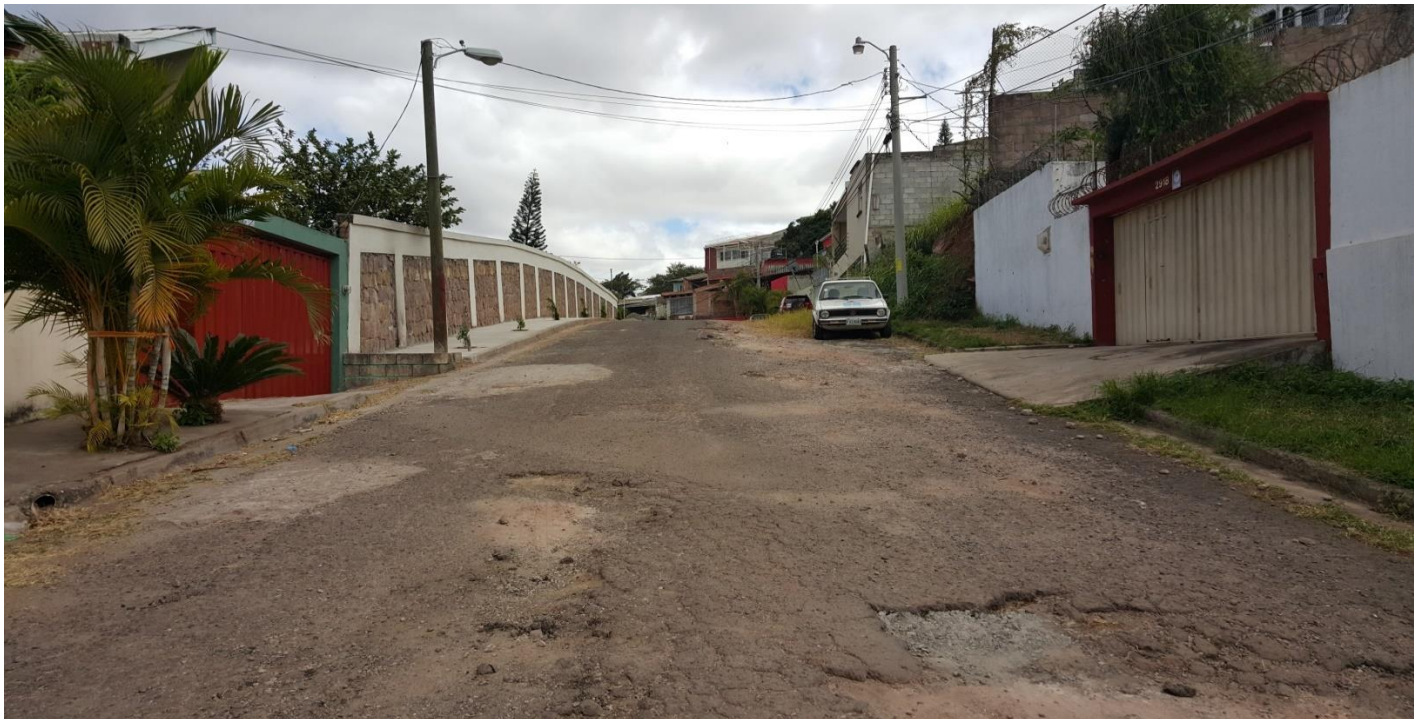
Vista de tramo a pavimentar