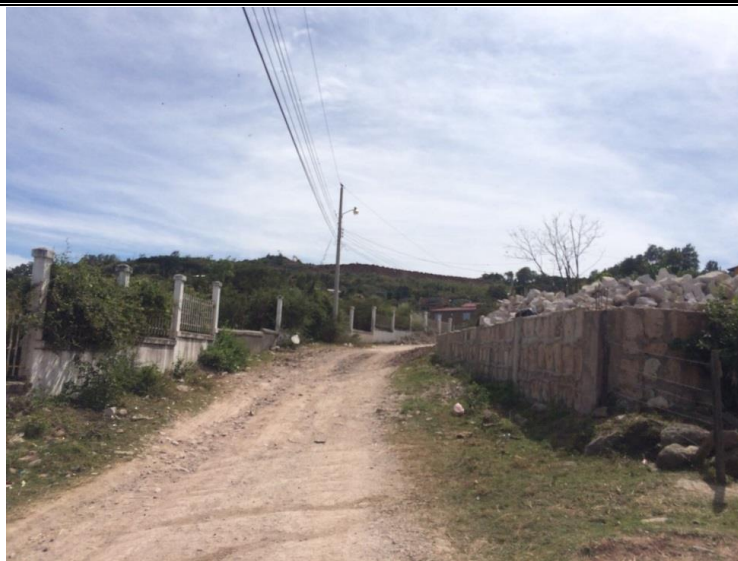
CALLE A CONFORMAR Y BALASTAR