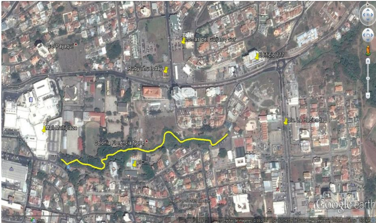
Croquis de ubicación: quebrada la orejona

Quebrada Don Pedro en la Aldea Suyapa, sector atrás de las tres cruces, y Quebrada la Orejona entre las Colonias Florencia Norte y Lomas del Guijarro Sur Tegucigalpa M.D.C.