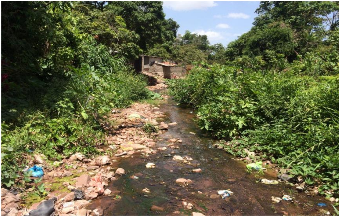
Quebrada don pedro, tramo localizado en aldea suyapa