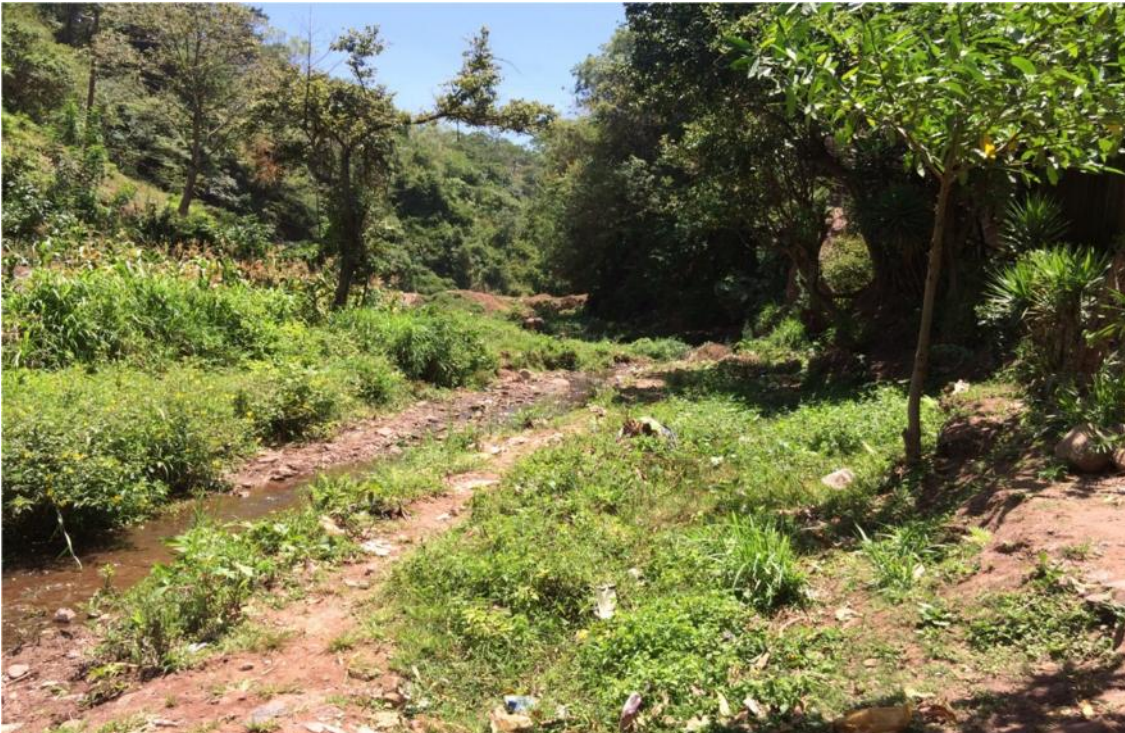
Podemos observar la cantidad de maleza en el sitio