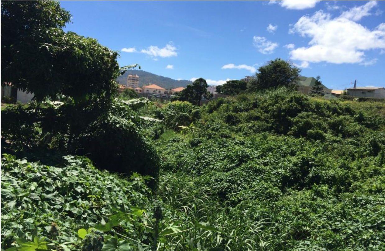
Tramo de quebrada la orejona, col. Florencia norte