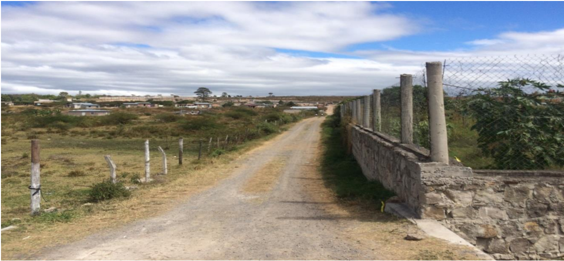
Vista panorámica de la calle a pavimentar