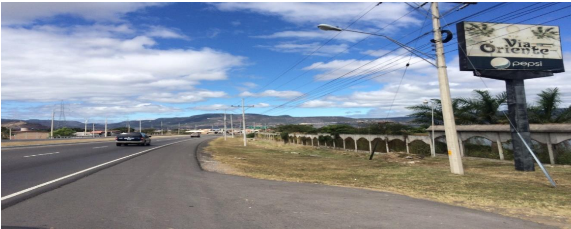
Calle de acceso o entrada a la Villa de los Niños

Proyecto: Pavimentación de calle con concreto hidráulico, aldea Amarateca (Villa de los Niños) Código: 939