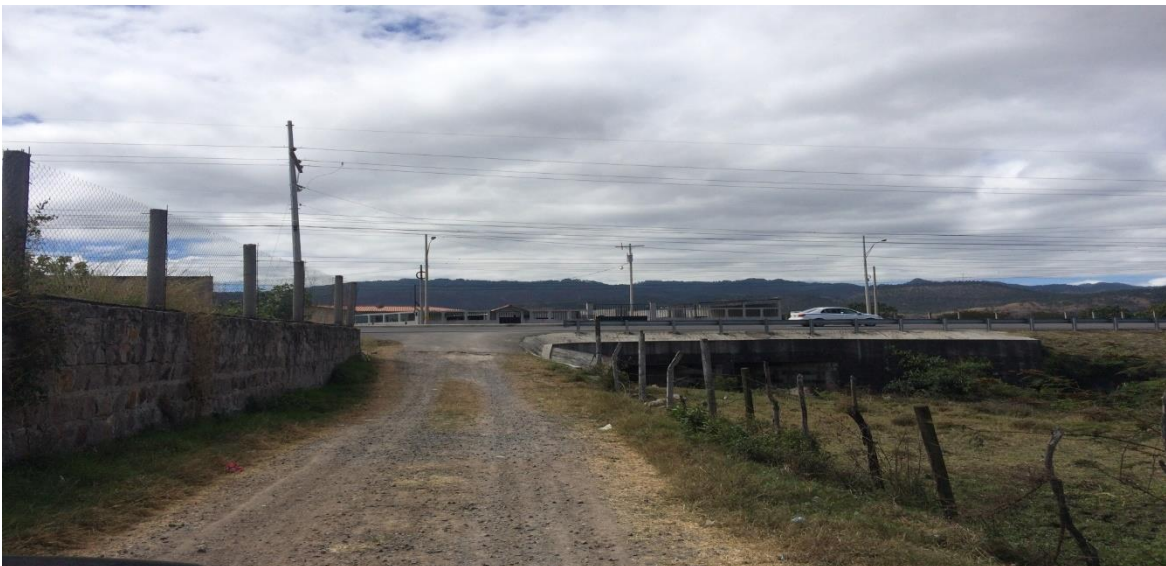
Inicio de la calle a pavimentar