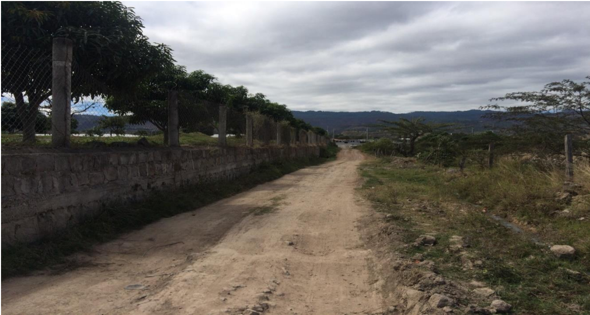
Fin de la calle a pavimentar

Proyecto: Pavimentación de calle con concreto hidráulico, aldea Amarateca (Villa de los Niños) Código: 939