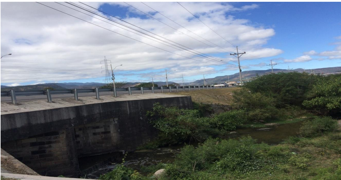
Puente aldea de Amarateca