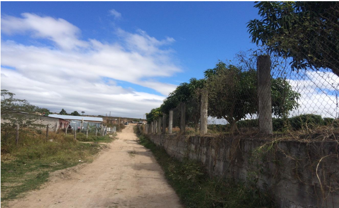
Vista de calle